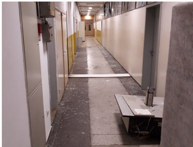
Oštećenja – zgrada RGN fakulteta

svim uredima po zavodima, predavaonicama, kabinetima, laboratorijima, hodnicima, kuhinjama, sanitarnim čvorovima i dr.), odvajanje žbuke od zidova u većini prostorija fakulteta, popucala stakla u nadsvjetlima u većini ureda, a koja zahtijevaju hitnu zamjenu (od suterena pa sve do šestog kata zgrade fakulteta), popadala žbuka i stakla. U pojedinim uredima oštećena i/ili uništena su računala, tastature te drugi predmeti zaposlenika. Velika većina namještaja je uništena s obzirom da su prevrnuti tijekom potresa, a posljedično je uništen i namještaj i inventar na koji su ormari pali (stolovi, stolice i podovi ureda). Pojedini radijatori u uredima i laboratoriju odvojili su se od zidova i pali na pod pri čemu su oštetili i pod. Velika većina slika, fotografija i zidnih karata popadala je, prilikom čega su oštećene ili uništene.