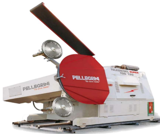
Slika 3-4: Dijamantna žična pila TELEDIESEL 120