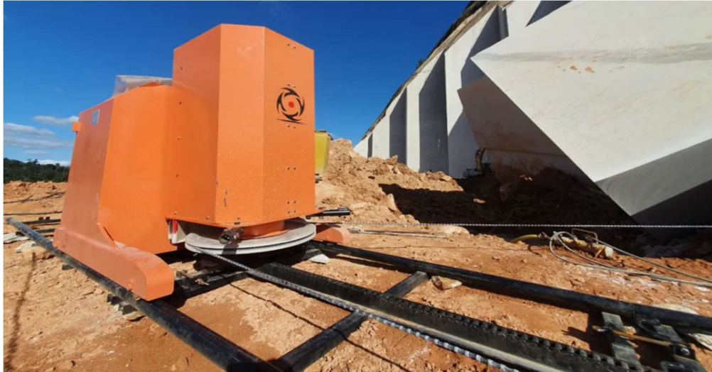
Slika 3-18: Dijamantna žična pila DWS