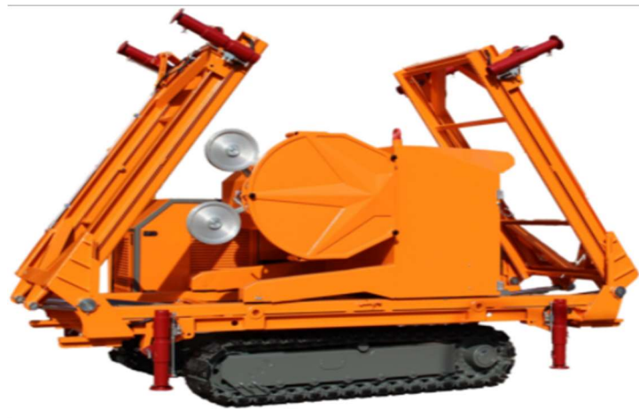
Slika 3-10: Dijamantna žična pila MOBIL FIL

Izuzetno pokretna dijamantna žična pila sa sklopivim tračnicama ukupne duljine 9 metara. Stroj se lako relocira gusjenicama nakon čega poziciju fiksira sa 8 nezavisnih hidrauličkih stabilizatora. Gusjenica se kontrolira daljinskim upravljačem, pogon joj je turbo dizelski motor jačine 56 KS. Može se opremiti pilama za mramor i granit s motorima od 50,60,75 i 100 KS (Marini, 2018.).