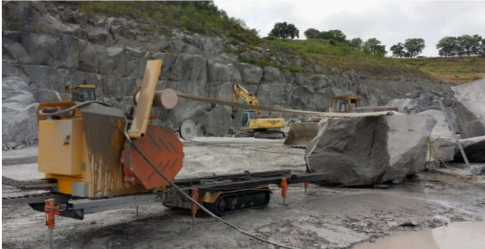
Slika 3-14: Dijamantna žična pila S800T (Promidžbeni materijal tvrtke Dazzini Machine, 2010.)

Glavna karakteristika ove pile je kontrola variranja brzine dijamantne žice pomoću uređaja "Easydrive"- Dazzinijev patent. Stroj se nalazi na gusijenicama zbog kojih je olakšana relokacija, a pred rezanje stabilnost pozicije osigurava 8 hidrauličkih stabilizatora. Duljina tračnica je 6 metara. Opcije glavnog električnog motora su 30, 37, 45 i 56 kW. Pilom se upravlja daljinskim upravljačem (Dazzini Machine, 2010.).