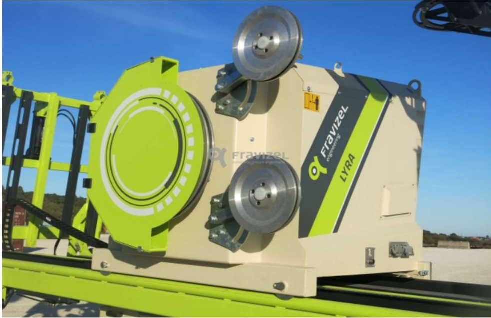
Slika 3-17: Dijamantna žična pila LYRA