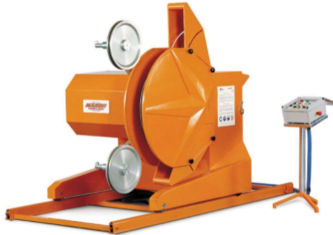
Slika 3-9: Dijamantna žična pila MAR FIL SUPER (Promidžbeni materijal tvrtke Marini, 2018.)

Pila iz serije strojeva većih gabarita, sa snagama glavnog motora od 37, 44 i 55 kW. Osigurana je konstantna napetost žice automatskim pomicanjem pile po tračnicama. Glavni zamašnjak rotira 360°, a njegovo brzo poravnanje u smjeru rezanja omogućuje izvođenje dva reza na udaljenosti 1750-1950 mm. Mogućnost izvedbe radova na terenu s nagibom u svim smjerovima. Kontrolni uređaj odvojen od kućišta stroja (Marini, 2018.).