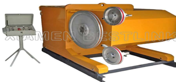
Slika 3-21: Dijamantna žična pila BL (Promidžbeni materijal tvrtke Xiamen Bestlink Factory Co., Ltd., 2017.)

Ova BL serija dijamantnih žičnih pila ima sposobnost izvođenja vertikalni i horizontalni rezova, kao i rezova na nagnutom terenu. Cijeli proces rezanja može biti automatiziran pa je samo potrebno nadgledanje radova. Napetost žice se kontrolira automatski, a brzina inverterom. U sljučaju završetka radova ili preopterećenja, pucanja žice i ostalih neispravnosti, pokretnim dijelovima se prekida dovod električne energije (Xiamen Bestlink Factory Co., Ltd., 2017.).