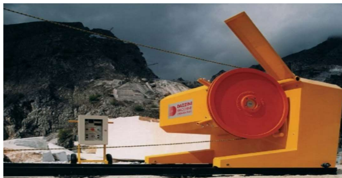
Slika 3-15: Dijamantna žična pila Series 1000 (Promidžbeni materijal tvrtke Dazzini Machine, 2010.)

Zadnja generacija dijamantne žične pile. Elektronički sistem je izrazito precizan zahvaljujući kombinaciji dvaju elektromotora. Mogućnost rada na nagnutoj podlozi. Rotacija i bočno kretanje od 400 mm sa svake strane su hidraulični, a daljnje kretanje moguće je elektromotorom i beskonačnim vijkom. Ovakav sustav ima sposobnost rezanja u razini tla, te izvedbe dva paralelna reza maksimalne širine od 2 m, bez pomicanja stroja. Ima i poseban sistem za grijanje glavnog zamašnjaka kako bi se spriječilo zamrzavanje u zimskom periodu (Dazzini Machine, 2010.).