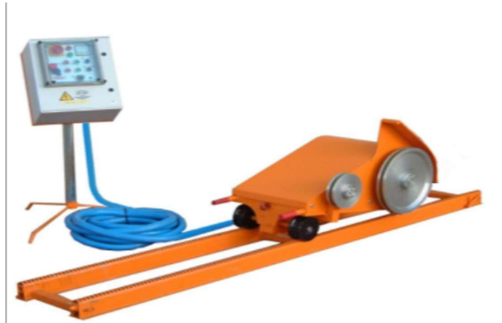
Slika 3-7: Dijamantna žična pila MICRO FIL (Promidžbeni materijal tvrtke Marini, 2018.)