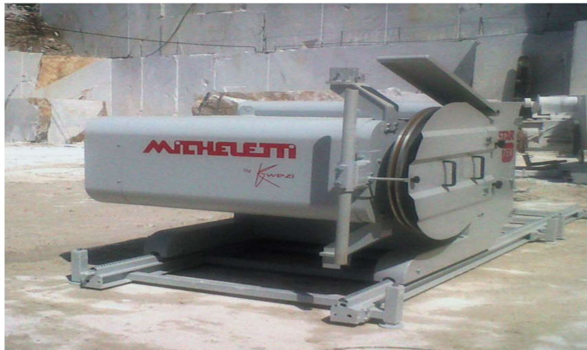
Slika 3-11: Dijamantna žična pila TELESTAR PLUS

Dijamantna žična pila dizajnirana za rezanje vertikalnih i horizontalnih rezova velikih površina, te rezova na terenu s nagibom. Snaga glavnog električnog motora varira od 30 do 75 kW. Potpuna rotacija zamašnjaka od 360° omogućuje rezanje dvaju paralelnih rezova maksimalne udaljenosti 220 cm bez premještanja tračnica. Sadrži inverter za kontroliranje brzine žice u rasponu 0-40 m/s. U slučaju pojave anomalija prilikom rezanja, sigurnosni uređaj zaustavlja kretanje svih pokretnih dijelova stroja. Upravljačka ploča nije vezana za kućište pa se pilom može upravljati sa sigurne udaljenosti (Micheletti by Kwezi, 2015.).