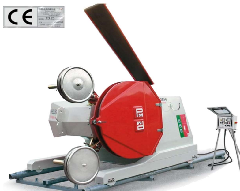
Slika 3-5: Dijamantna žična pila TELEDIAM 80

Stroj namjenjen za velike rezove u masivnim stijenama pogonjen elektromotorom. Dva sklopa reduktora s električnim pogonom omogućuju rotaciju glavnog pogonskog kotača za 360° i njegov bočni pomak kako bi se mogla napraviti dva paralelna reza. Dolazi i u opciji sa inverterom za kontroliranje brzine dijamantne žice u rasponu od 0 do 30 m/sek (Pellegrini).