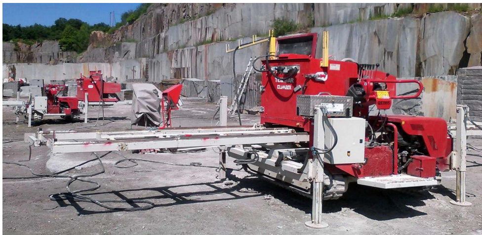
Slika 3-12: Dijamantna žična pila TELESTAR CLIMBER (Promidžbeni materijal tvrtke Micheletti, 2015.)

pogonski motor pa nema gubitka u prijenosu energije. Rotira 360° što mu omogućuje izradu dvaju paralelnih rezova 600-1200 mm bez pomicanja tračnica. Upravljački uređaj nije fiksiran za kućište pa se strojem upravlja iz sigurne udaljenosti. (Micheletti by Kwezi, 2015.)