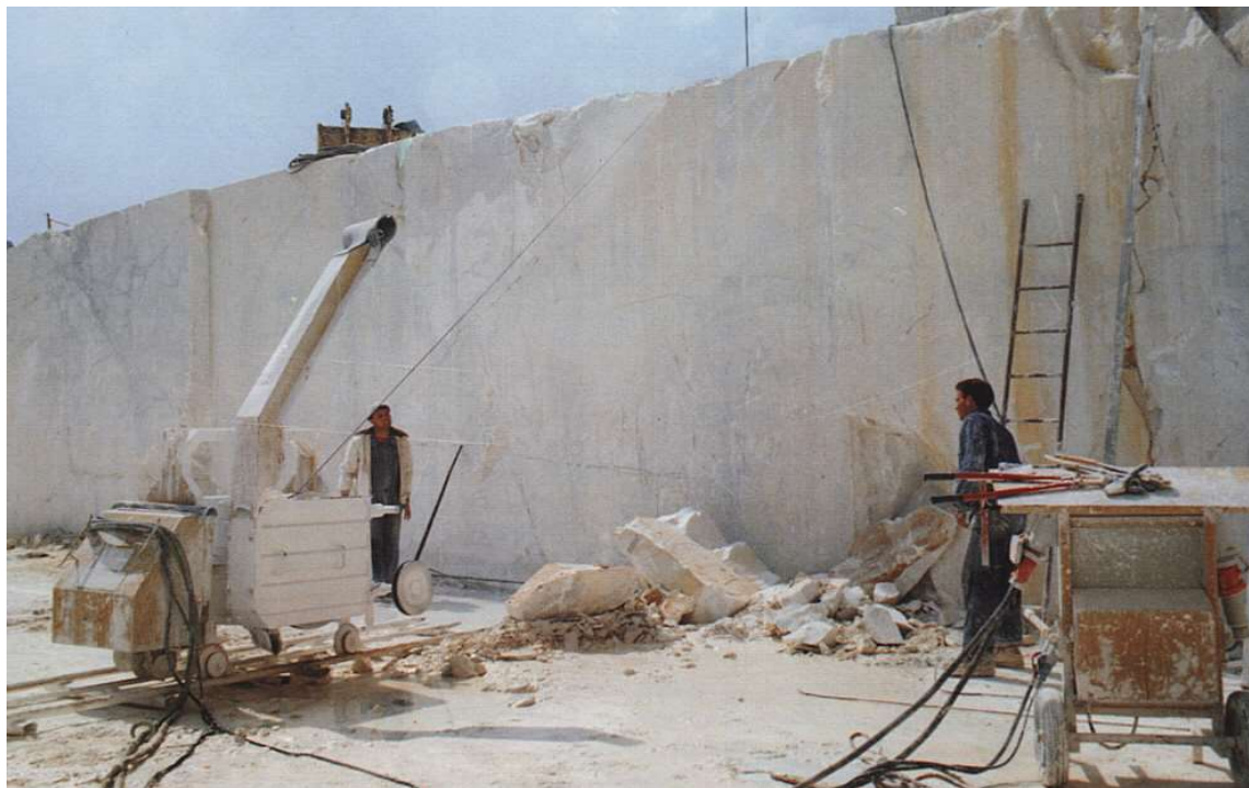
Slika 2-1: Dijamantna žična pila na ležištu (Kujundžić, 2003.)

obuhvatnog kuta žice i sprječavanje njenog spadanja sa pogonskog kotača omogućavaju dva orijentacijska kolotura koja se nalaze ispred zamašnjaka (Dunda i Kujundžić, 2003.).