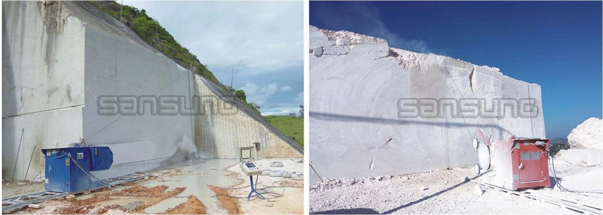
Slika 3-20: Dijamantna žična pila SWS (Promidžbeni materijal tvrtke Xiamen Sansung Mining Equipment Co., Ltd., 2017.)