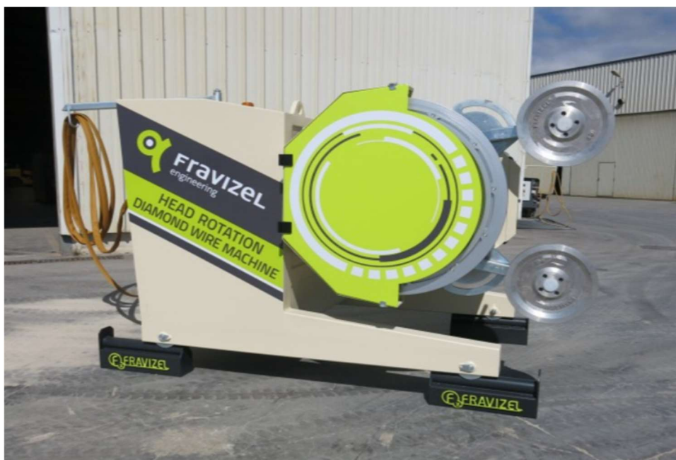
Slika 3-16: Dijamantna žična pila LYNX (Promidžbeni materijal tvrtke Fravizel, 2017.)

Najbrža dijamantna žična pila na tržištu. Namjenjena za rezove velikih površina. Rotacija od 315° omogućuje brzo postavljanje stroja u poziciju za izvedbu horizontalnih rezova i rezova pod kutem. Vertikalni rezovi do udaljenosti od 2.2 m. Automatsko zaustavljanje pile i dotoka vode na kraju rezanja i u slučaju prekida žice. Lak pristup elektromotoru radi održavanja (Fravizel, 2017.).