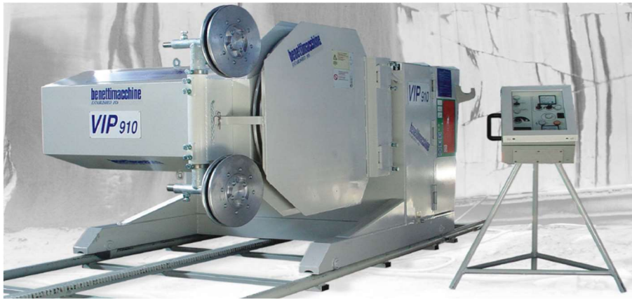
Slika 3-1: Dijamantna žična pila VIP 910 (Promidžbeni materijal tvrtke Benetti Macchine, 2014.)

rotaciju od 360° za rezanje pod bilo kojim kutem, te mogućnost pravljenja dva paralelna reza na razmaku od 170 do 200 cm (Benetti Machine, 2014.).