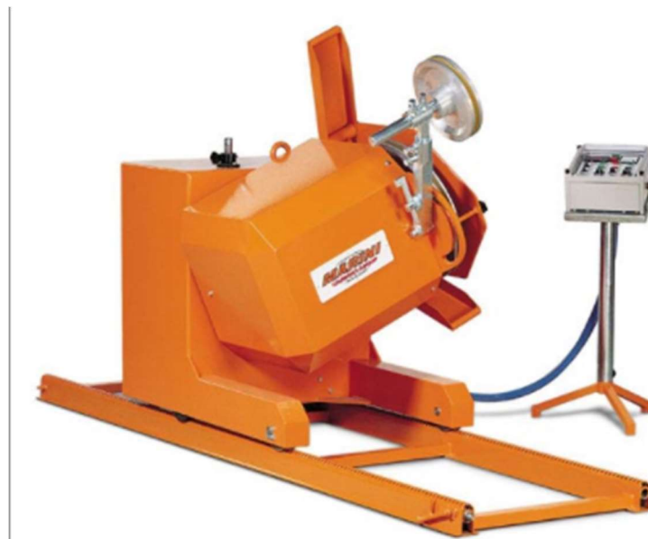
Slika 3-8: Dijamantna žična pila MINI FIL (Promidžbeni materijal tvrtke Marini, 2018.)

Dijamantna žična pila s 3 opcije jačine motora- 11, 15 i 18 kW. Idealna za rezanje komercijalnih blokova mramora i izradu manjih rezova na bancima. Brzina dijamantne žice je fiksna, a kontrola napetosti konstantna. Glavni zamašnjak se kontrolira manualno i rotira 360°. Mogućnost izvedbe radova na terenu s nagibom u svim smjerovima. Kontrolni uređaj odvojen od kućišta stroja (Marini, 2018.).