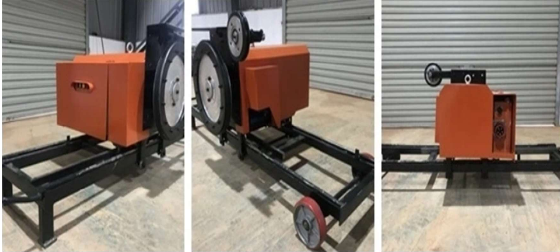
Slika 3-19: Dijamantna žična pila WSM