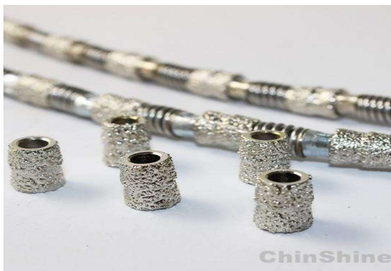
Slika 2-2: Dijamantna žica (ChinShine dijamantni alati, 2019.)

Dijamantna žica je pojam koji koristimo kao opis skupa dijelova koji čine kompletirani alati u službi reznog elementa dijamantne žične pile. Na čelično užu su nanizane dijamantne perle, spojnice, opružni razdjeljivači, blokirni i zaštitni prstenovi. Osim što je rezní element, dijamantna žica je ujedno i vučni element postrojenja pa su njena vrsta, tehničke značajke i kvaliteta, uz svojstva stijene, presudni za efikasnost piljenja (Dunda S., Kujunžić T. 2003.).