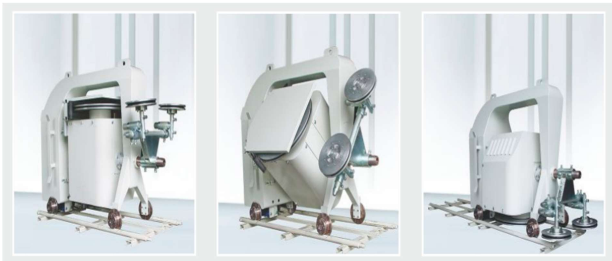
Slika 3-2: Dijamantna žična pila GAMA 875 (Promidžbeni materijal tvrtke Benetti Macchine, 2014.)

Kompaktna pila izrađena sa posebnim metalnim okvirom oko zamašnjaka. Dizajnirana je za rezanje velikih primarnih blokova, te obradu blokova mramora, granita i abrazivnog kamenja. Vektorski inverter omogućava raspon brzine gibanja dijamantne žice od 0 do 40 m/sek, a superkartica osigurava automatsko napinjanje i kontrolu žice. Stroj se po tračnicama giba pomoću zupčanika. Kao i kod modela V912, zajamčeno je piljenje horizontalnih rezova u razini tla bez pomoćnih dodataka (Benetti Machine, 2014.).