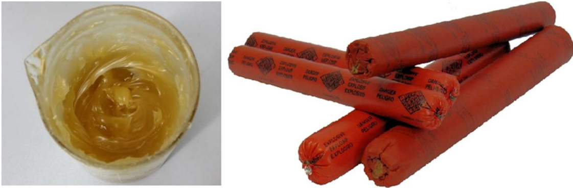
Slika 4-7. Emulzijska matrica (lijevo) (Zečić, 2015.) i emulzijski eksploziv (desno) (AUSTIN POWDER, 2023).

Amonij nitratni praškasti eksplozivi su praškasti eksplozivi izrađeni na bazi TNT-a i amonijum nitrata. Slabe su osjetljivosti na udar i trenje, zbog čega spadaju u eksplozive sigurne za rukovanje i transport, a nisu ni štetni za okolinu. Pri niskim temperaturama ne smrzavaju. Primjenjuju se prije svega za masovna rudarska miniranja u podzemnoj i površinskoj eksploataciji, za miniranje od mekih do čvrstih stjenskih masa, gdje nisu prisutni metan i eksplozivna ugljena prašina. Iniciraju se klasičnim sredstvima za iniciranje: rudarskom kapicom, električnim detonatorima, neelektričnim sustavom iniciranja i detonirajućim štapinom. Zbog svoje niske vodootpornosti koriste se za miniranja u suhim i vlažnim mitskim bušotinama, a nisu primjenjivi za miniranje u bušotinama u kojima ima vode. na Slici 4-8 prikazan amonij nitratni praškasti eksploziv.