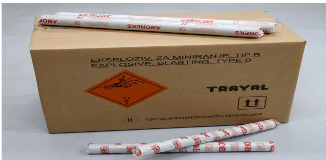
Slika 4-8. Amonij nitratni praškasti eksploziv AMONEKS. (Trayal, 2023)

Amonij nitratni praškasti eksplozivi su praškasti eksplozivi izrađeni na bazi TNT-a i amonijum nitrata. Slabe su osjetljivosti na udar i trenje, zbog čega spadaju u eksplozive sigurne za rukovanje i transport, a nisu ni štetni za okolinu. Pri niskim temperaturama ne smrzavaju. Primjenjuju se prije svega za masovna rudarska miniranja u podzemnoj i površinskoj eksploataciji, za miniranje od mekih do čvrstih stjenskih masa, gdje nisu prisutni metan i eksplozivna ugljena prašina. Iniciraju se klasičnim sredstvima za iniciranje: rudarskom kapicom, električnim detonatorima, neelektričnim sustavom iniciranja i detonirajućim štapinom. Zbog svoje niske vodootpornosti koriste se za miniranja u suhim i vlažnim mitskim bušotinama, a nisu primjenjivi za miniranje u bušotinama u kojima ima vode. na Slici 4-8 prikazan amonij nitratni praškasti eksploziv.