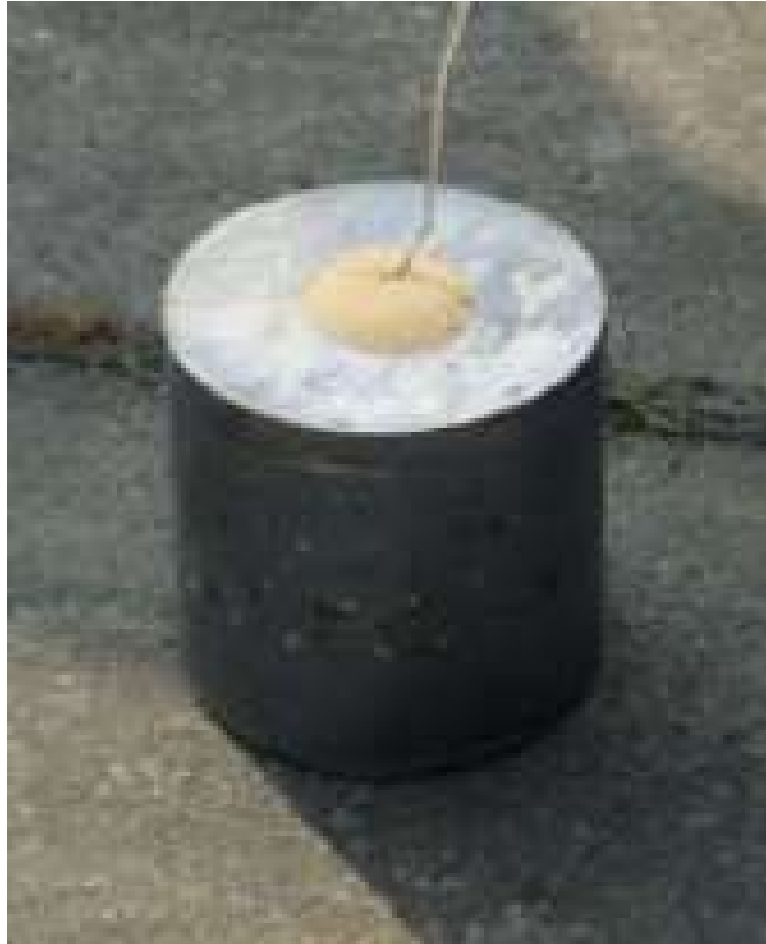
Slika 4-1. Olovni blok spreman za detonaciju. ( Memim encyclopedia, 2023 )