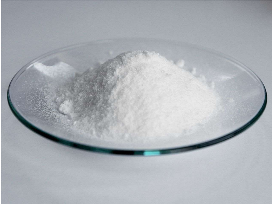
Slika 4-5. Pentrit. (Wikipedia, 2023.)

Za svaki eksploziv kojem se testirala radna sposobnost provođena su tri testa. Osim mjerenja volumena bruto proširenja nakon eksplozije, kod svakog testa je mjerena temperatura bloka, što je omogućilo određivanje korekcijskog faktora. Na primjeru eksploziva ELMEX-a, u tablici 4-3 prikazani su zapisani podatci za provedene testove.