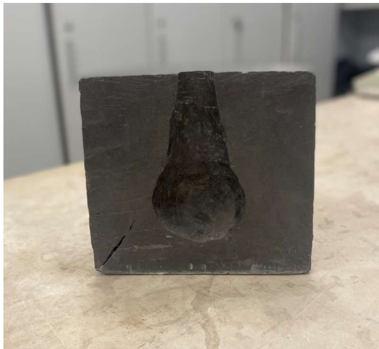
Slika 4-3. Presjek olovnoga bloka nakon detonacije.