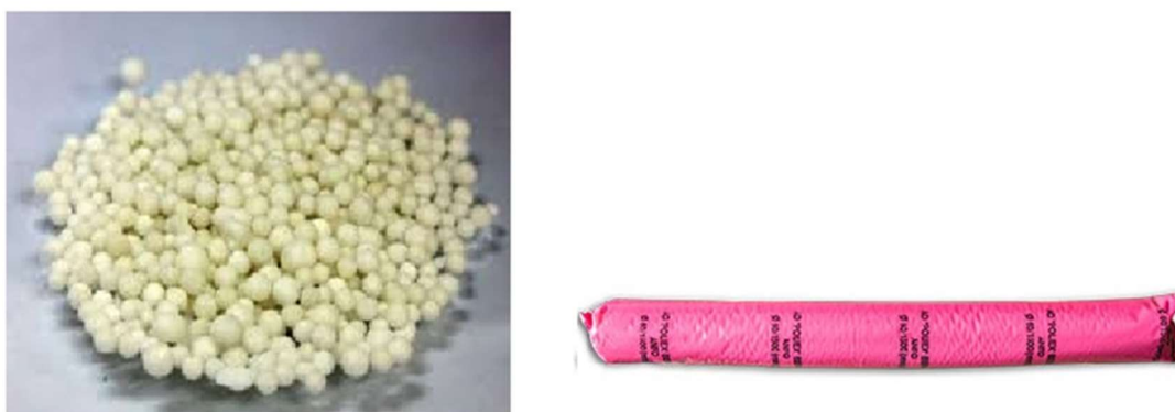
Slika 4-6. ANFO eksploziv (lijevo) (Zečić, 2015.) i patronirani ANFO eksploziv (desno) (POLIEX, 2021.).

ANFO eksplozivi (engl. ammonium nitrate fuel oil ) su jedni od najčešće korištenih eksploziva. Sastoje se od amonijevog nitrata najčešće u obliku granula, rjeđe u prahu, te od goriva na bazi nafte, odnosno mineralnog ulja. Ključni čimbenici koji utječu na njihovu kvalitetu uključuju karakteristike amonijevog nitrata kao osnovnog sastojka (npr. poroznost i granulacija), odabir pogodnog goriva, te postupak miješanja amonijevog nitrata s gorivom. Nedostatak ovih eksploziva je njihova osjetljivost na vlagu što ograničava vrijeme skladištenja. Osim toga, slaba vodootpornost ograničava njihovo korištenje u suhim uvjetima (Ester, 2005). Na Slici 4-6 prikazan je ANFO eksploziv prije i nakon patroniranja.