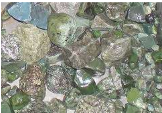
Slika 6-1. Silikomanganska troska