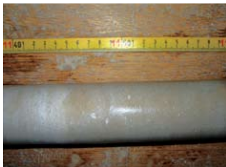
Sl. 11. Promjena boje na kontaktu vapnenca i dolomitiziranog vapnenca

Potrebno je utvrditi bilo kakvu pojavu koja može ukazivati na laminaciju, listanje te zonalnu i koncentričnu građu. Takve pojave nehomogenosti mogu prouzročiti listnato, koritasto i pločasto raspadanje kamena. Promjene boje mogu ukazivati na promjene nastale u vrijeme singenetskih, dijagenetskih i postdijagenetskih procesa (sl. 11).