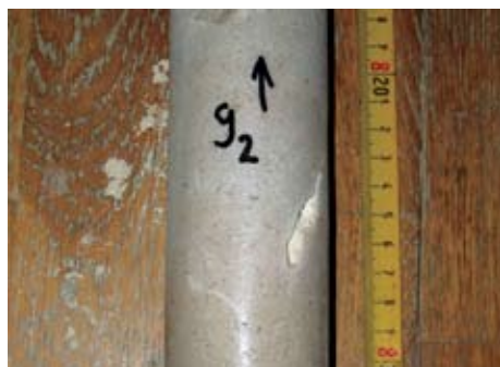
Sl. 10. Otopanje ljušturica fosilnog kršja