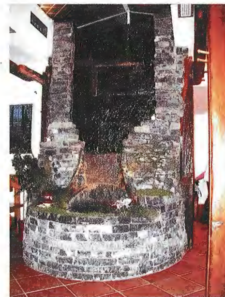
Sl. 6 Slastičarnica u Zagrebu. Lipovečki kamen ugrađen u fontanu i slap preko kojega se prelijeva voda a vegetacija cijelom objektu daje posebnu draž

Kamen je tržištu zanimljiv zbog lagane obrade i ugradnje. Ovim se kamenom relativno lako zida. Manja atraktivnost s obzirom na boju može se poboljšati ukoliko se sporadične žučkastosmeđe slojne površine (rezultat limonitizacije) orijentiraju u zidu ili ogradi tako da budu vidljive ( face bedded ) kao što to prikazuje slika 5. Posebno je atraktivan prilikom primjene u interijerima. Na slici 6 (slastičarnica u Zagrebu) prikazan je primjer kamene fontane i slapa preko kojega se prelijeva voda a vegetacija cijelom objektu daje posebnu draž. Kamen se u kamenolomu razvrstava po debljinama. Prilikom ugradnje omogućuje različiti strukturni izraz. Udio ploča po debljini je sljedeći: učešće kamena debljine 2-3 cm je 6 %; debljine 3-5 cm-12 %; debljine 5-7 cm-15 %; debljine 7-10 cm -17 %; debljine 10-13 cm-19 %; debljine 13-17 cm-21 % i učešće debljine kamena preko 17 cm je 10 %.