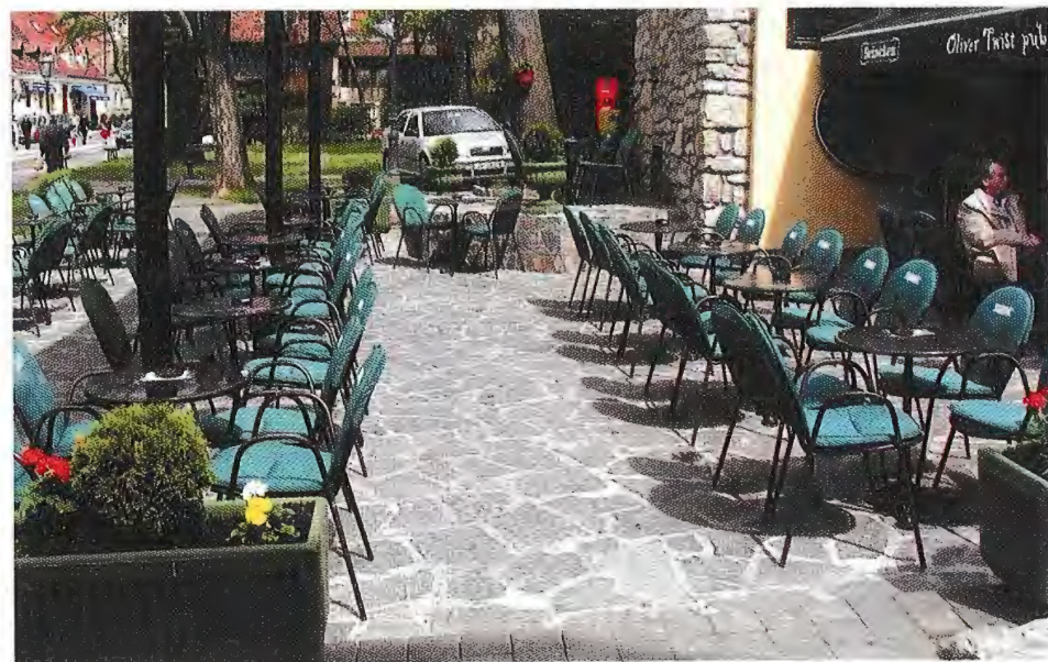
Sl. 2 - Lipovečki kamen ugrađen je u novu terasu "kafića" Oliver Twist puba (Zagreb)