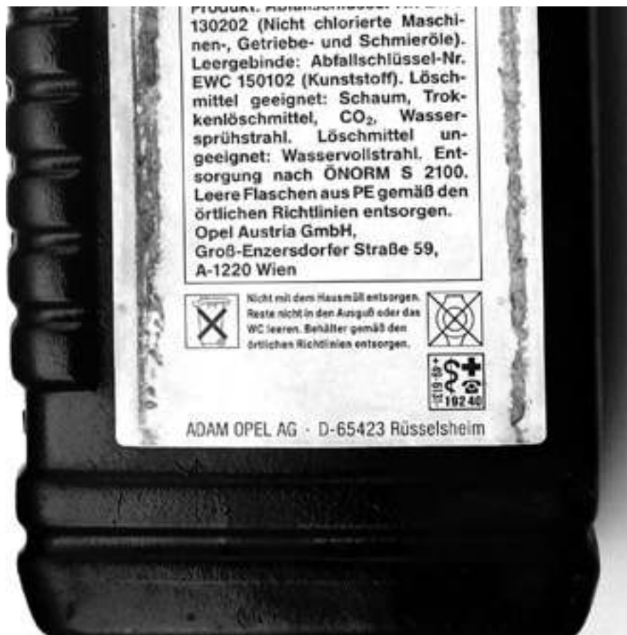
Slika 2-4 Ambalažni otpad – još jedan primjer upozoravajućih piktograma na kantici motornog ulja u Njemačkoj ( http://lerotic.de/opasni/index.htm )

Slika 2-4 pokazuje još jedan primjer upozoravajućih piktograma na kantici motornog ulja u Njemačkoj.