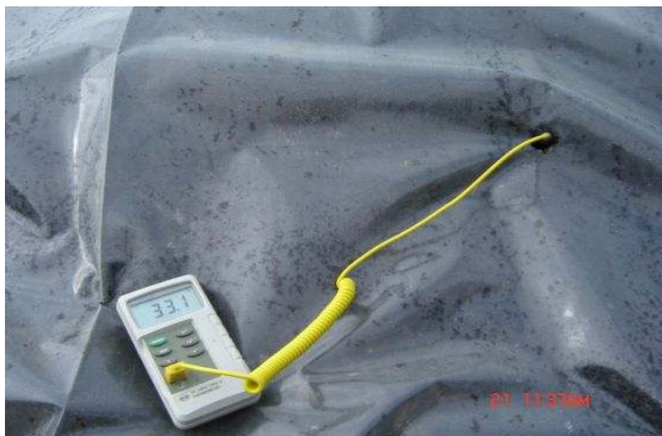
Slika 4-2 Zbrinjavanje otpadnih mazivih ulja u MC Čišćenje ( http://www.mcciscenje.hr/home/clanak.php?id=12380 )

Slika 4-2 prikazuje zbrinjavanje otpadnih mazivih ulja u poduzeću MC Čišćenje.