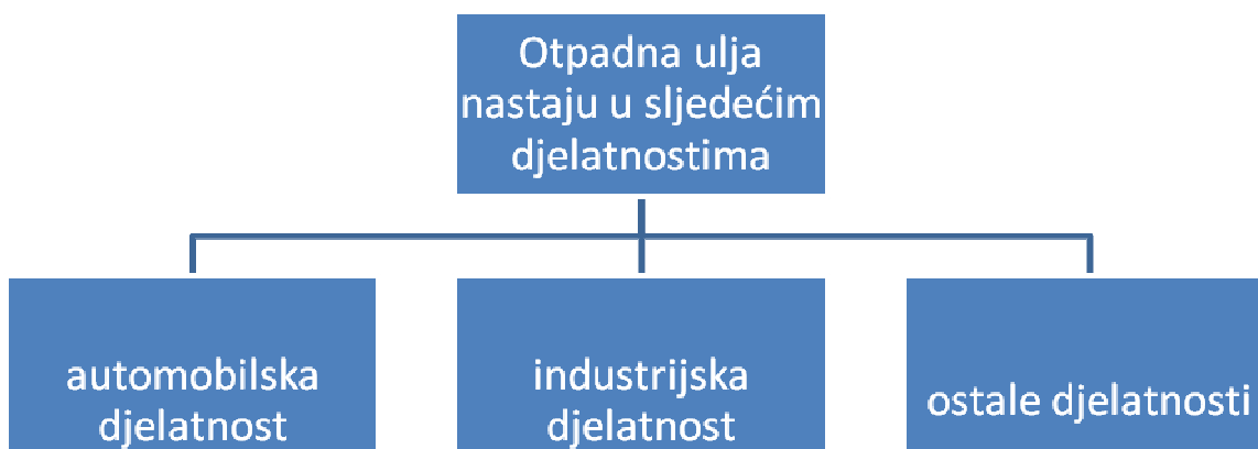
Slika 3-2 Otpadna ulja u djelatnostima (Muharemi, 2012)

Otpadna ulja, čak i kada ne sadrže količine halogena i PCB-a i PCT-a iznad propisanih granica, smatraju se izrazito štetnima za okoliš jer već male količine onečišćuju velike količine pitke vode. Kada ih imaju u svom sastavu, PCB i PCT spojevi su toksični, kancerogeni i postojani u hranidbenom ciklusu. Sljedeće štetno svojstvo otpadnih ulja je da gorenjem na relativno niskim temperaturama (oko 500°C) oslobađaju vrlo otrovne spojeve, dioksine, koji zatim iz zraka prelaze u žive organizme, zaključuje svoju analizu o otpadnim uljima autor Muharemi (2012). Slika 3-2 prikazuje u kojim se sve djelatnostima nalaze otpadna ulja.