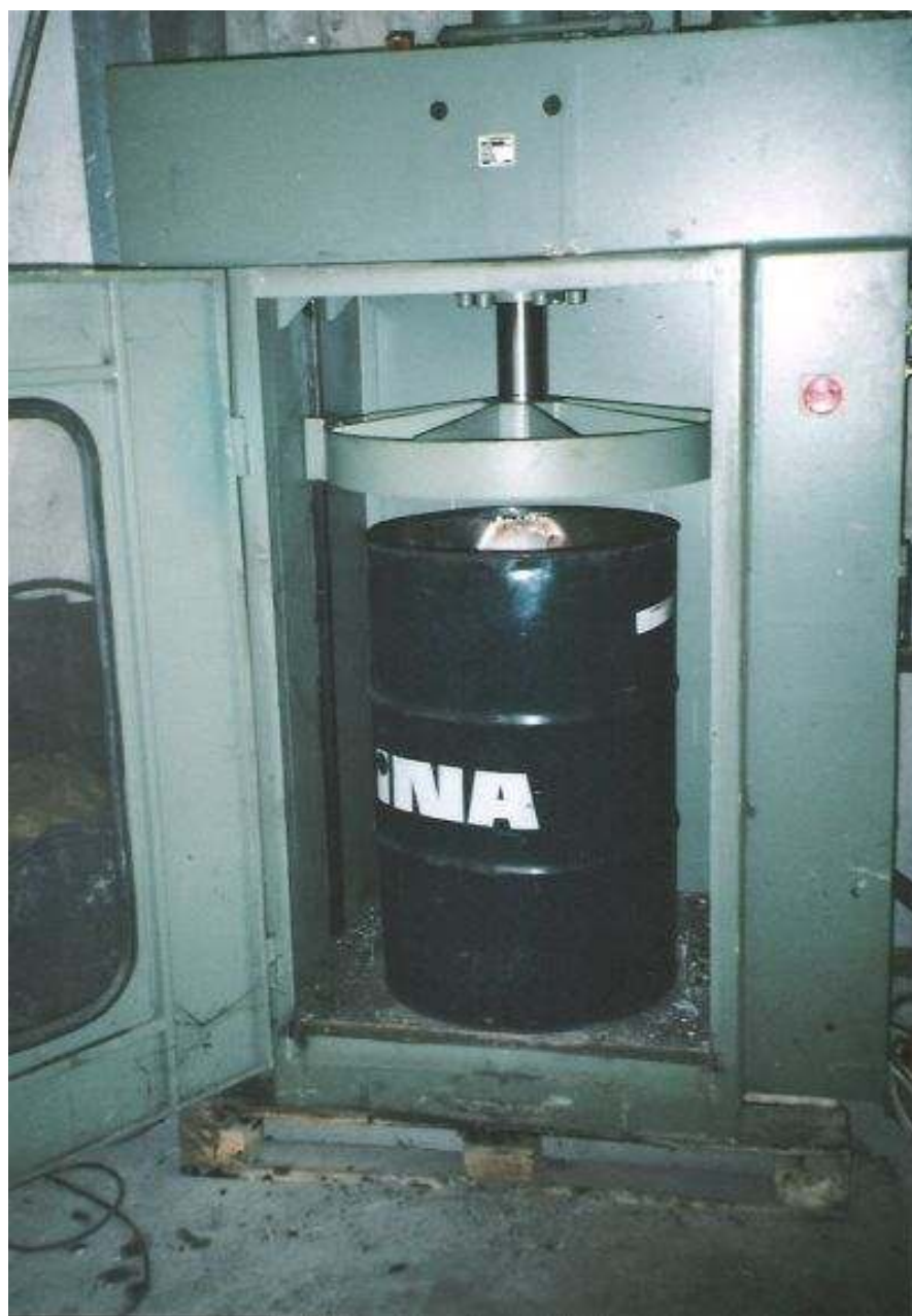
Slika 4-3 Zbrinjavanje otpadnih mazivih ulja u MC Čišćenje ( http://www.mcciscenje.hr/home/clanak.php?id=12380 )

Slika 4-3 pokazuje način zbrinjavanja otpadnih mazivih ulja u poduzeću MC Čišćenje.