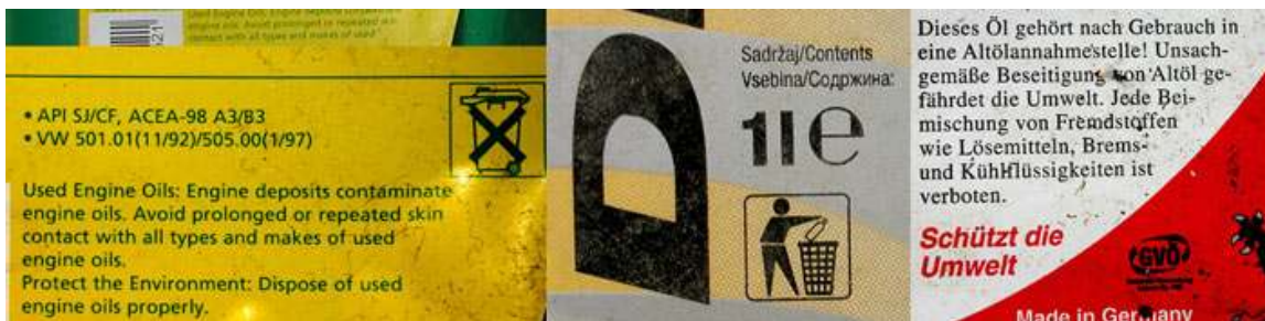
Slika 2-3 Ambalažni otpad – primjer upozoravajućih piktograma na kanticama motornog ulja u Njemačkoj i Velikoj Britaniji ( http://lerotic.de/opasni/index.htm )

Slika 2-3 daje interesantan prikaz upozoravajućih piktograma na kanticama motornog ulja u Njemačkoj i Velikoj Britaniji