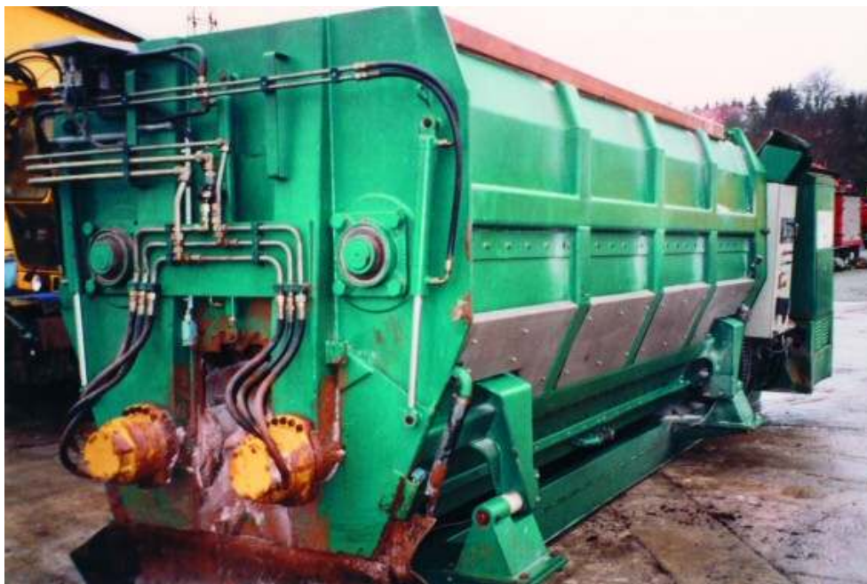
Slika 4-1 Zbrinjavanje otpadnih mazivih ulja u MC Čišćenje – kontejner ( http://www.mcciscenje.hr/home/clanak.php?id=12380 )

Slika 4-2 prikazuje zbrinjavanje otpadnih mazivih ulja u poduzeću MC Čišćenje.