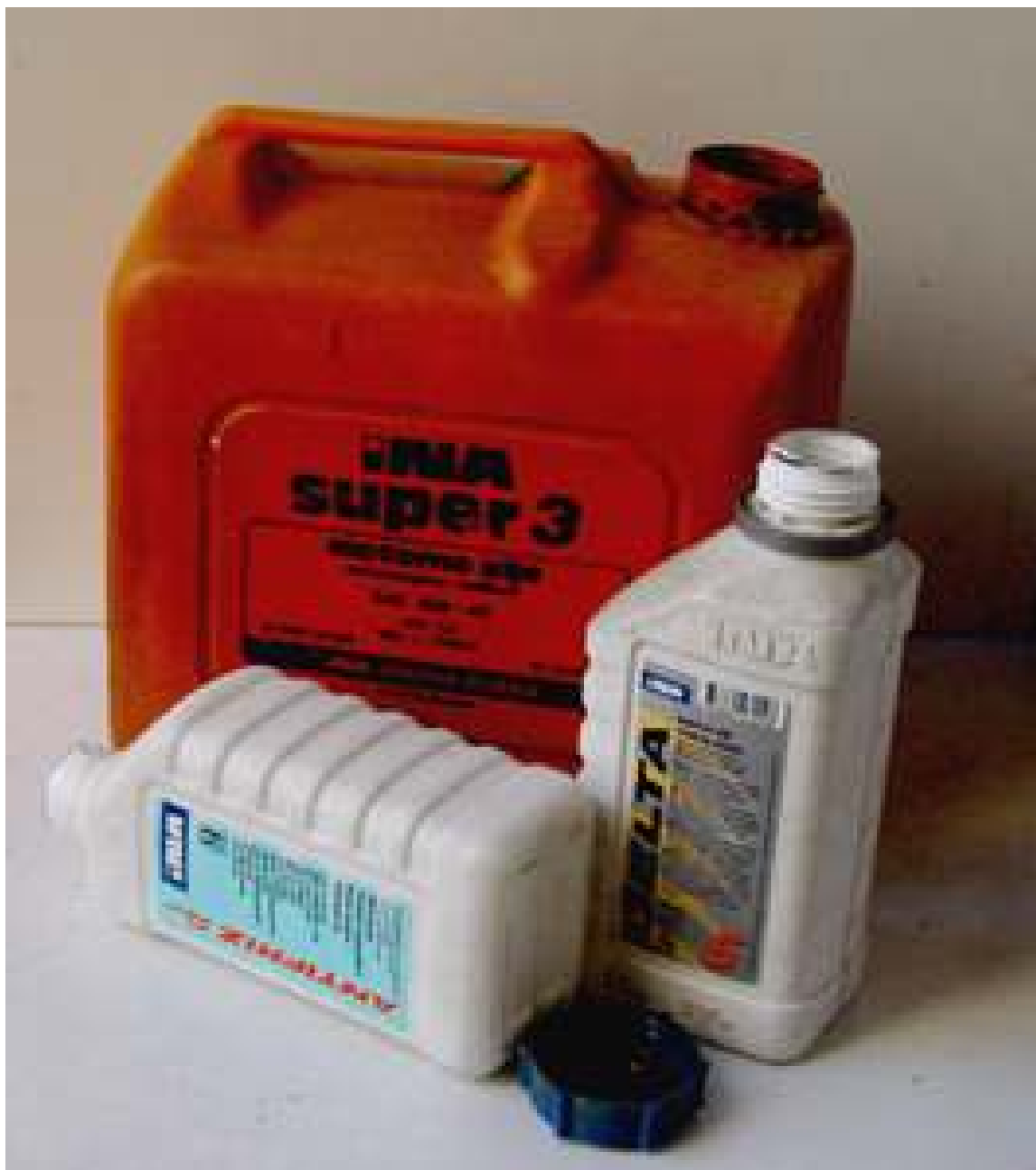
Slika 2-1 Ambalažni otpad – primjer kantica motornog ulja u Hrvatskoj