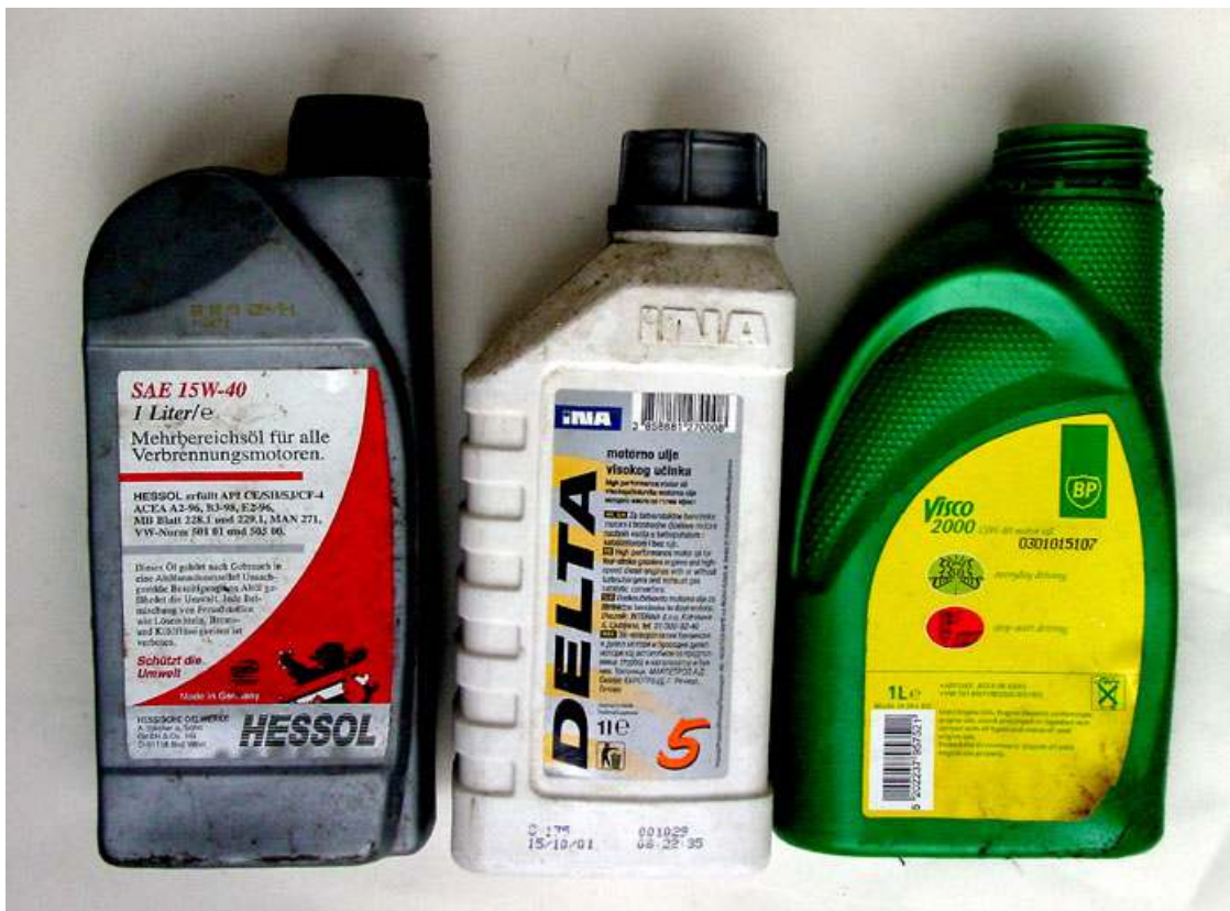
Slika 2-2 Ambalažni otpad – primjer kantica motornog ulja u Hrvatskoj i Njemačkoj ( http://lerotic.de/opasni/index.htm )

Slika 2-2 prikazuje ambalažni otpad na primjeru kantica motornog ulja u Hrvatskoj i Njemačkoj.