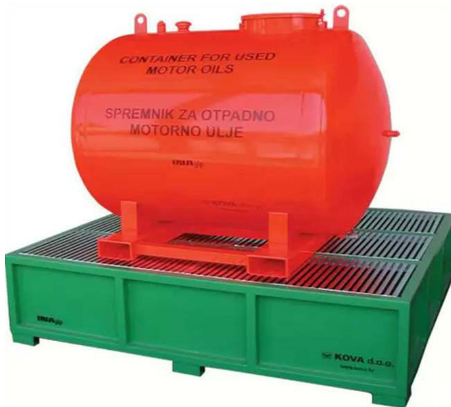
Slika 3-3 Spremnik za otpadna ulja ( http://recikliraj.hr/recikliranje-otpadnih-ulja )

Naravno, treba napomenuti da je u prikladnu opremu potrebno uložiti nezanemariva sredstva. Važno je spomenuti i segment prijevoza otpadnih tvari gdje prema Zakonu o otpadu (N.N. 178/04) i Zakonu o prijevozu opasnih tvari (N.N. 79/07) otpadna ulja se moraju prevoziti prema međunarodnim ADR propisima.