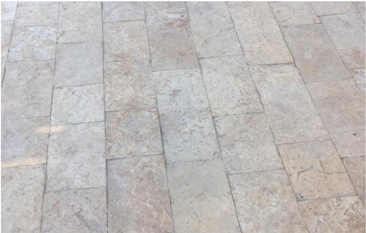
Slika 4-4. Šetnica obložena pilanom pločom

7) Pilana ploča – koristi se za postavljanje na okomite i vodoravne površine