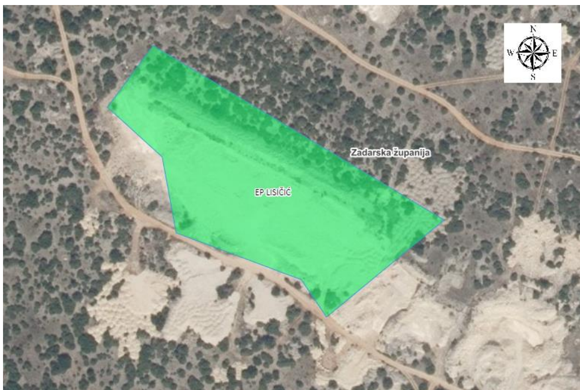
Slika 2-2. Eksploatacijsko polje "Lisičić" (JISMS 2020.)