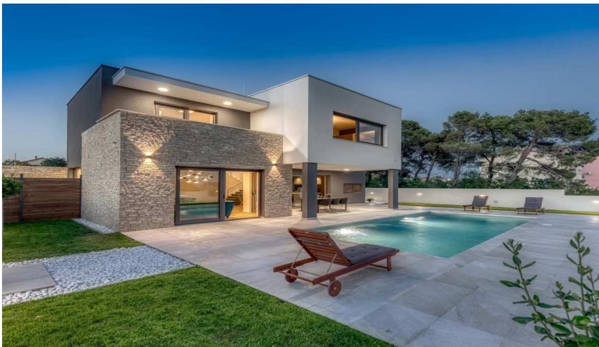
Slika 4-1. Zid kuće obložen benom