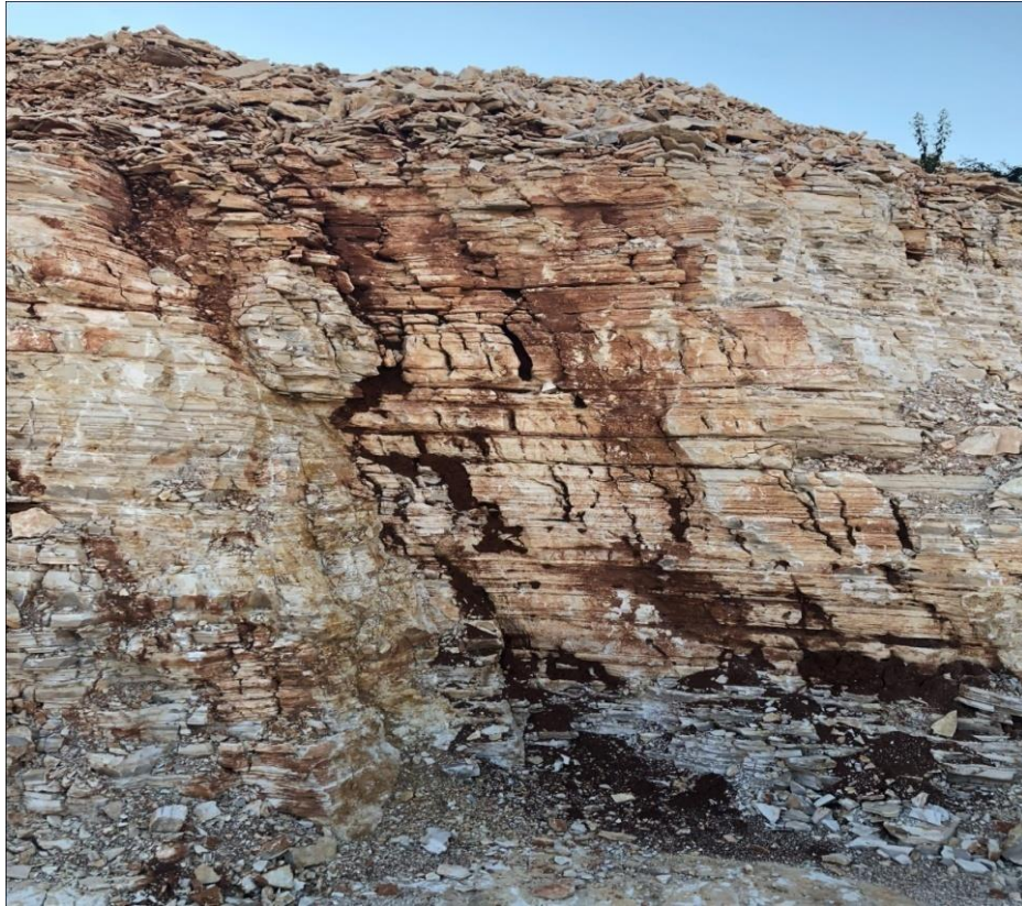
Slika 2-5. Leće zemlje crvenice i proslojci unutar slojnih ploha (Bačić, 2018.)