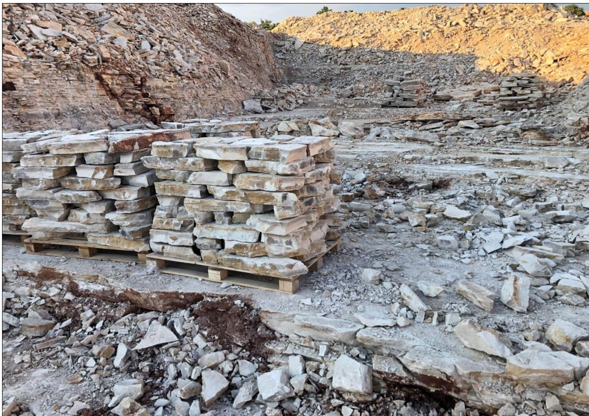
Slika 3-4. Palete debljeg kamena spremne za dalju obradu u pilani (Bačić, 2018.)

kao i povećanje otkopnih gubitaka. Na slici 3-4 prikazane su palete debljeg kamena spremne za dalju obradu u pilani.