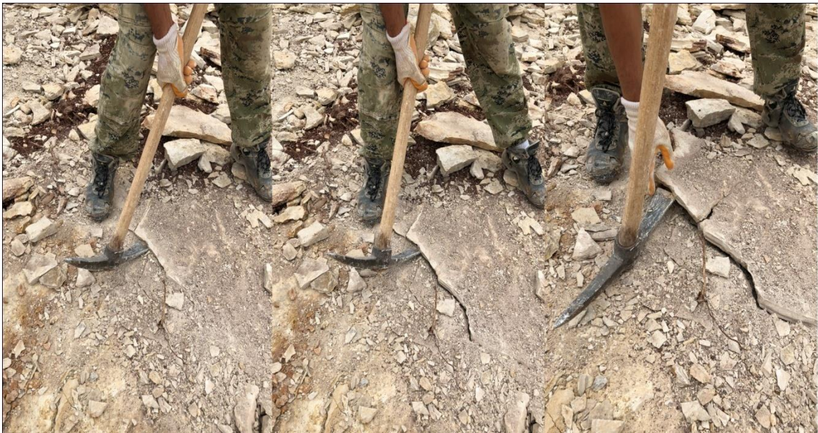
Slika 3-1. Ručno dobivanje (Bačić, 2018.)

Nakon odlamanja ploče se na licu mjesta slažu u palete prema asortimanu po debljini i veličini. To znači da se na jednoj paleti nalaze ploče iste debljine i boje, te po prilici iste veličine različitog nepravilnog oblika. Na svaku paletu se stavi brojna oznaka, oznaka radilišta i kategorija proizvoda (kvaliteta, debljina i veličina ploča). Na slici 3-1 prikazan je ručni način dobivanja.