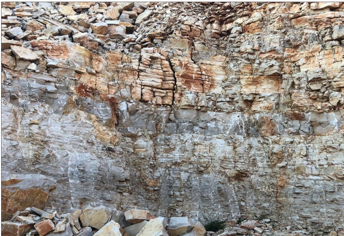
Slika 2-4. Izmjena svijetlosivosmeđih vapnenaca sa svjetlijim vapnencima (Bačić, 2018.)

Ležište "Lisičić" izgrađeno je od tankopločastih vapnenaca koji se razlikuju po boji, tako da postoje ružičastosivi do svijetlosmeđi i sivopločasti do tamnosivi vapnenci. Obje inačice se međusobno vertikalno izmjenjuju. Na slici 2-4 prikazana je izmjena svijetlosivosmeđih vapnenaca sa svjetlijim vapnencima.