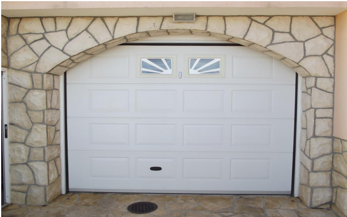
Slika 4-2. Ulaz u garažu obložen bijelim izbijenim ciklopom