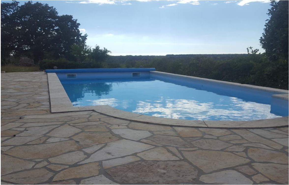
Slika 4-3. Staza oko bazena obložena lomljenom pločom

7) Pilana ploča – koristi se za postavljanje na okomite i vodoravne površine