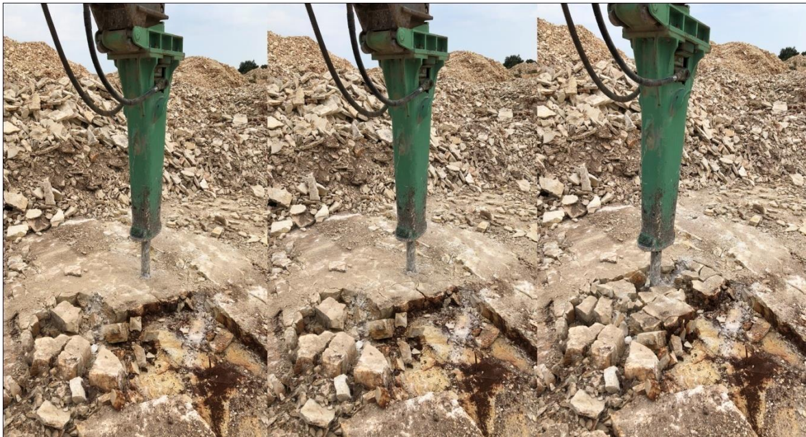
Slika 3-3. Strojno dobivanje (Bačić, 2018.)

Drugi način strojnog otkopavanja karakterizira prethodno razbijanje slojeva (uz djelomično potpuno odvajanje ploča), djelovanjem sile na njihovu površinu, te eventualnim naknadnim horizontalnim odvajanjem po slojnicama radnim elementom ili ručno. Na slici 3-3 prikazan je strojni način dobivanja.