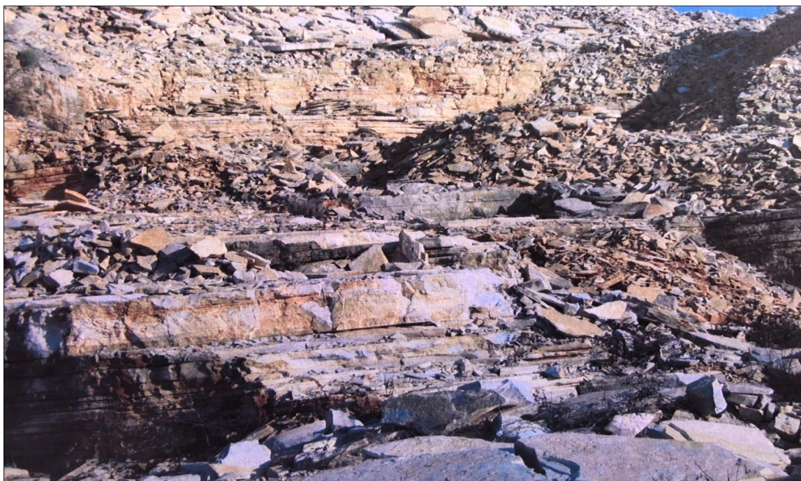
Slika 2-3. Pretežito tanki slojevi (3 cm -6 cm) sa slabo zastupljenim debelim (iznad 15 cm) amalgamiranim slojevima (Jovičić, 2010)

Vapnenci pokazuju jasno izraženu slojevitost u vidu ravnih i oštih slojnih ploha. Debljina slojeva je centimetarska od 1 – 10 cm, rijetko iznad 10 cm. Često je više centimetarskih slojeva slijepljeno u decimetarske slojeve. Slojne plohe su ravne, oštre do jasne, duž kojih dolazi do cijepanja vapnenca u ploče različitih dimenzija i debljina. Lome se nepravilno do plitko školjkasto. Donje slojne plohe su jasne i ravne, rjeđe valovite. Neke od njih ispunjene su glinovitom supstancom ili terra rosom, i kod takvih slojnih ploha dolazi do lakšeg odvajanja ploča vapnenca. Na slici 2-3 prikazana je slojevitost eksploatacijskog polja "Lisičić".