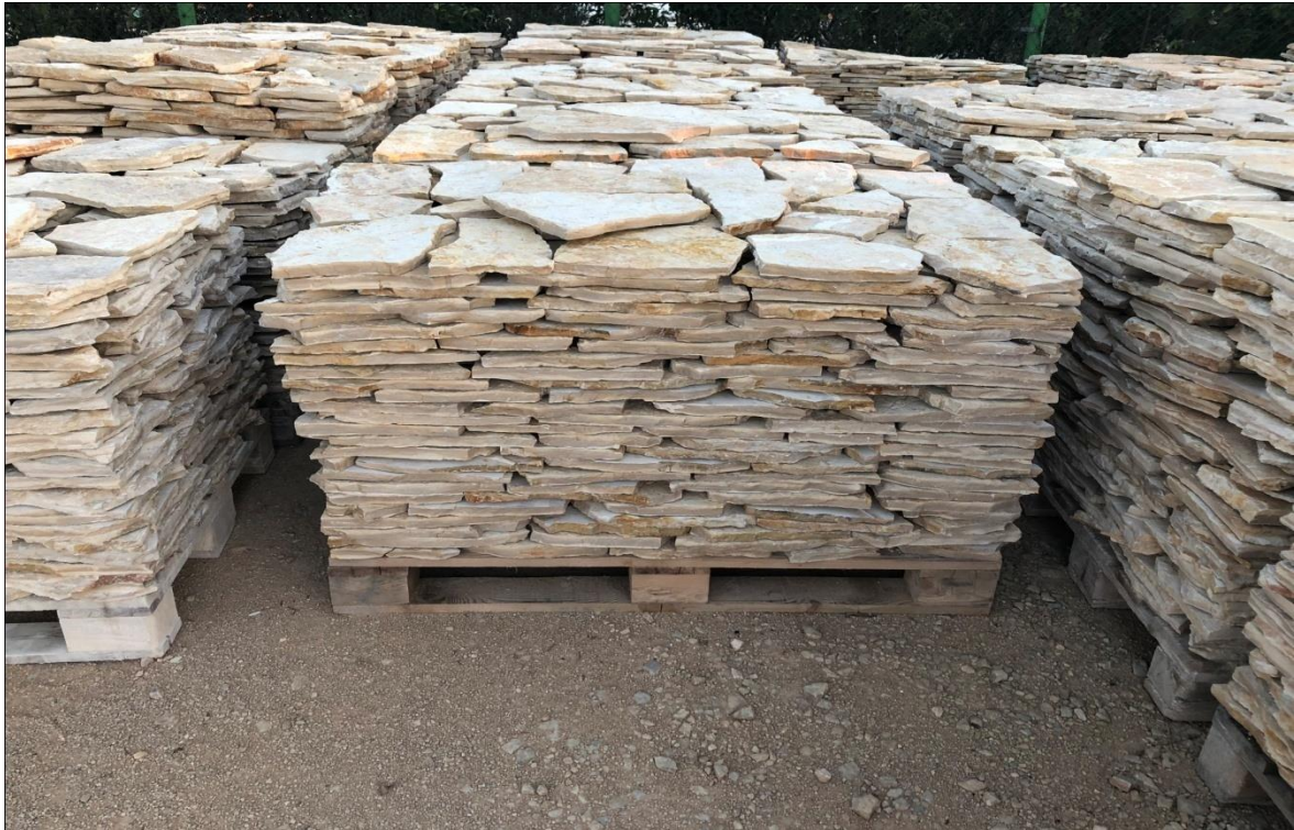
Slika 3-2. Paleta lomljenog kamena spremna za tržište (Bačić, 2018.)

Složene palete se s otkopnog polja prebacuju, utovarivačem opremljenim vilicama umjesto lopate, na deponij gotovih proizvoda formiran unutar eksploatacijskog polja. Palete se s tog deponija, kamionima kupaca, direktno odvoze na tržište ili se otpremaju u pilanu na dalju obradu (uglavnom palete s debljim pločama). Na slici 3-2 prikazana je paleta lomljenog kamena spremna za tržište.