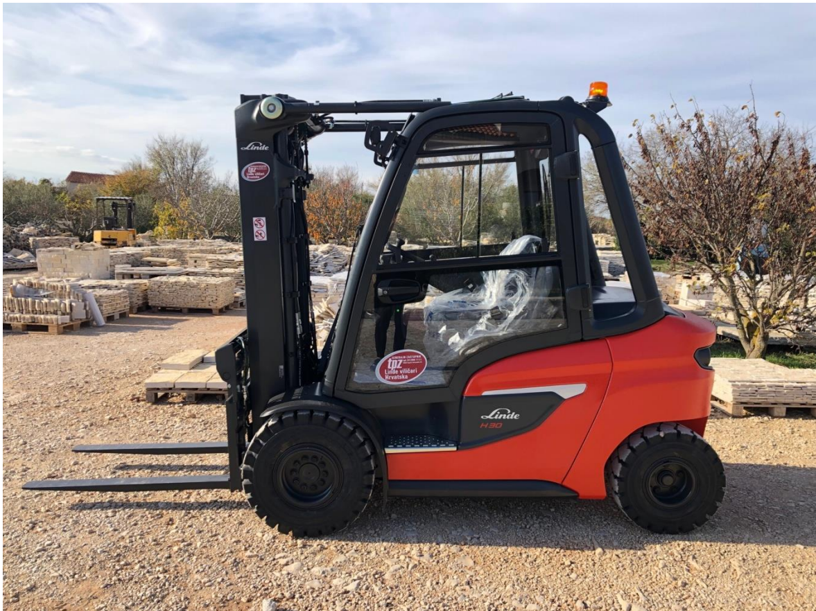
Slika 5-1. Čeoni viličar Linde H30