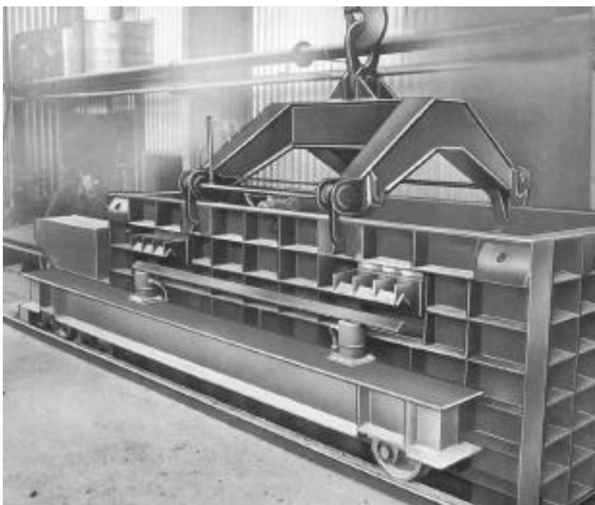
Slika 4-3. Kalupi za formiranje blokova ( Dunda i Kujundžić, 2003.)

Kalupi (slika 4-3.) za formiranje blokova napravljeni su od materijala otpornog na tlak i vibracije. Prije dodavanja šarže, stranice kalupa očiste se metalnim strugačima i zatim premažu s dva sloja premaza. Prvi sloj je tzv. odjeljivač i ima ulogu da ostvari adheziju između bloka i stranica kalupa zbog lakšeg odvajanja. Drugi sloj, na bazi poliesterskih smola, nanosi se tanko i ima ulogu stvaranja tanke opne oko bloka koja mu armira vanjsku površinu. Kalupi se pri formiranju blokova fiksiraju na vibracijsku stanicu u vakuum komori. Uloga vakuuma i vibracija je istisnuti sav zrak i rasporediti šaržu unutar bloka da bi se dobio kompaktni materijal smanjene poroznosti. Takav proizvod ima povećanu postojanost i otpornost na djelovanje atmosferilija i drugih utjecaja.