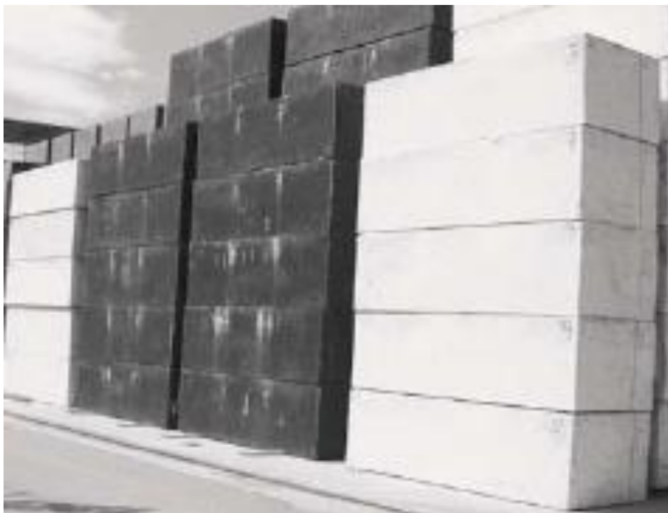
Slika 4-4. Breton blokovi dimenzija 308x125x88 (Bretonstone, 2020)

Breton blokovi proizvedeni koristeći vibro kompresijsku vakuum komoru imaju dimenzije 308x125x88 cm te su prikazani na slici 4-4. Iz njih se dobivaju ploče dimenzija 308x125 debljine između 9 mm do 30 mm. Kao vezivo koriste poliesterske smole s aditivima za povećanu adheziju.