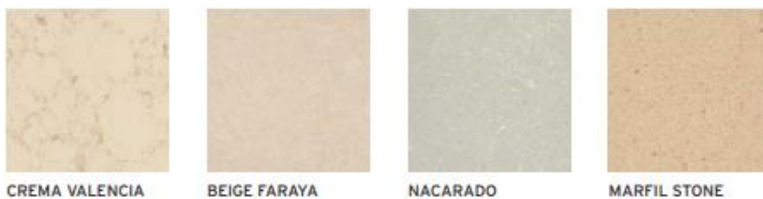
Slika 4-7. Umjetni kamen kompanije Compac

Umjetni kamen različitih boja iz španjolske kompanije Compac koja koristi Breton tehnologiju prikazan je na slici 4-7.