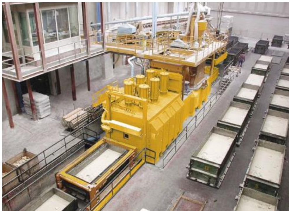
Slika 4-5. Vibro kompresijska vakuum komora i kalupi (Bretonstone, 2020)

Ovisno o vrsti modela i veličini postrojenja, proizvode od 1500 do 8000 m 2 po jednom radnom danu. Vibro kompresijska vakuum komora i kalupi za proizvodnju blokova marke Breton prikazani su na slici 4-5.