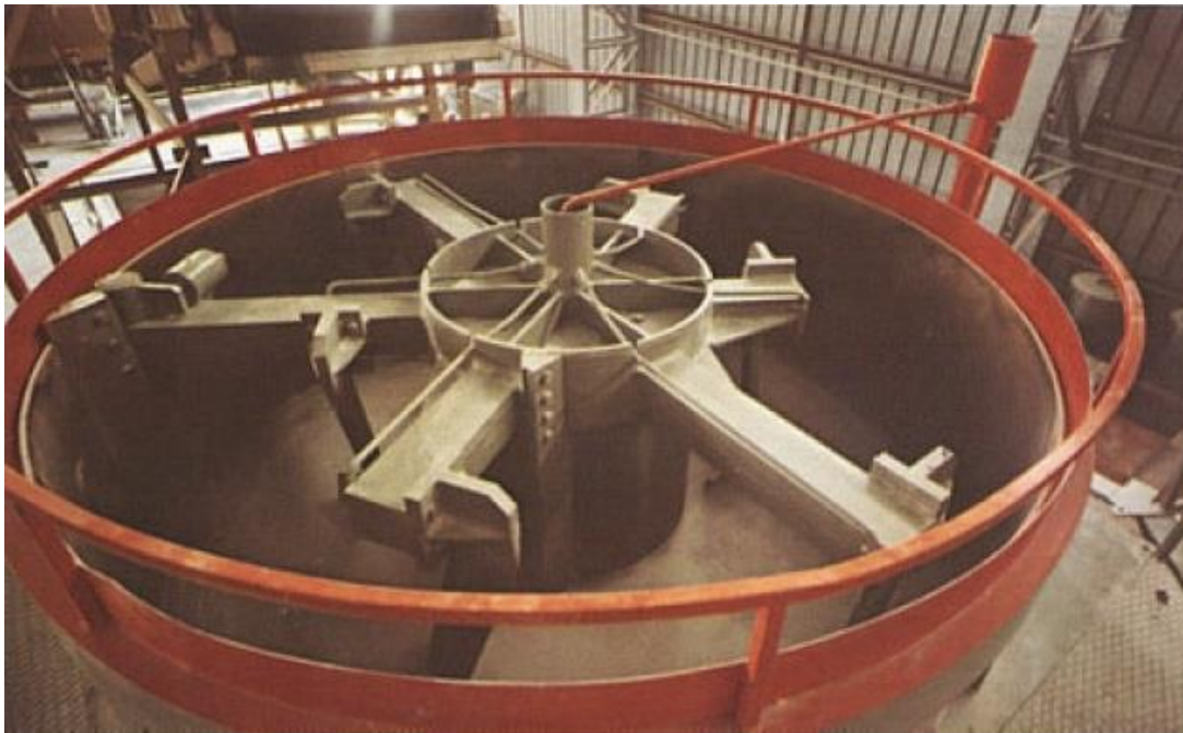
Slika 4-2. Epicikloidalna miješalica (Dunda i Kujundžić 2003)