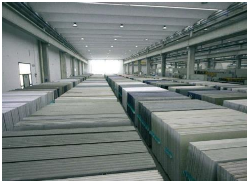
Slika 4-6. Breton ploče (Bretonstone, 2020)

Umjetni kamen različitih boja iz španjolske kompanije Compac koja koristi Breton tehnologiju prikazan je na slici 4-7.