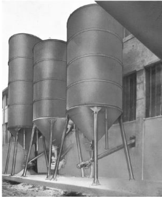
Slika 4-1. Silosi iz kojih se suhe frakcije dodaju u miješalicu (Dunda i Kujundžić, 2003)