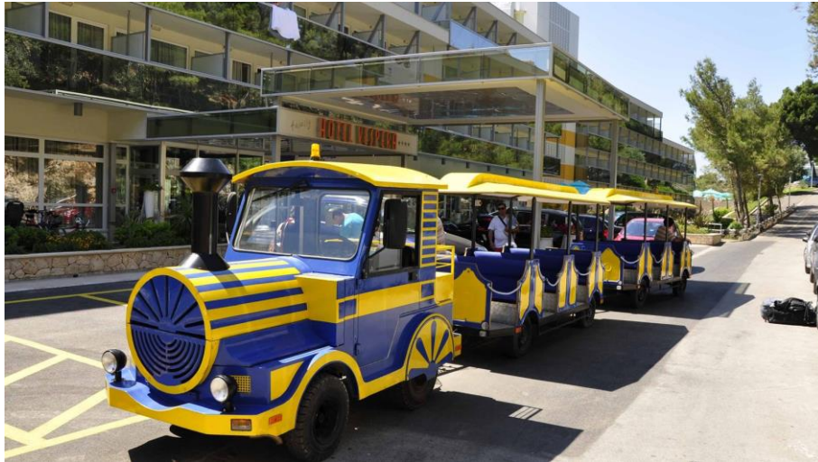
Slika 2-1. Turistički vlakić Turističke zajednice Malog Lošinja ( www.visitlostinj.hr ) – vučno turističko vozilo s dvije priključne naprave i otvorenim prostorom za putnike

odobrena (NN 86/15). Primjeri vozila koja se koriste u turističkom prijevozu uz uključivanje u cestovni promet su turistički vlakić (slika 2-1) i električna turistička vozila (slika 2-2).