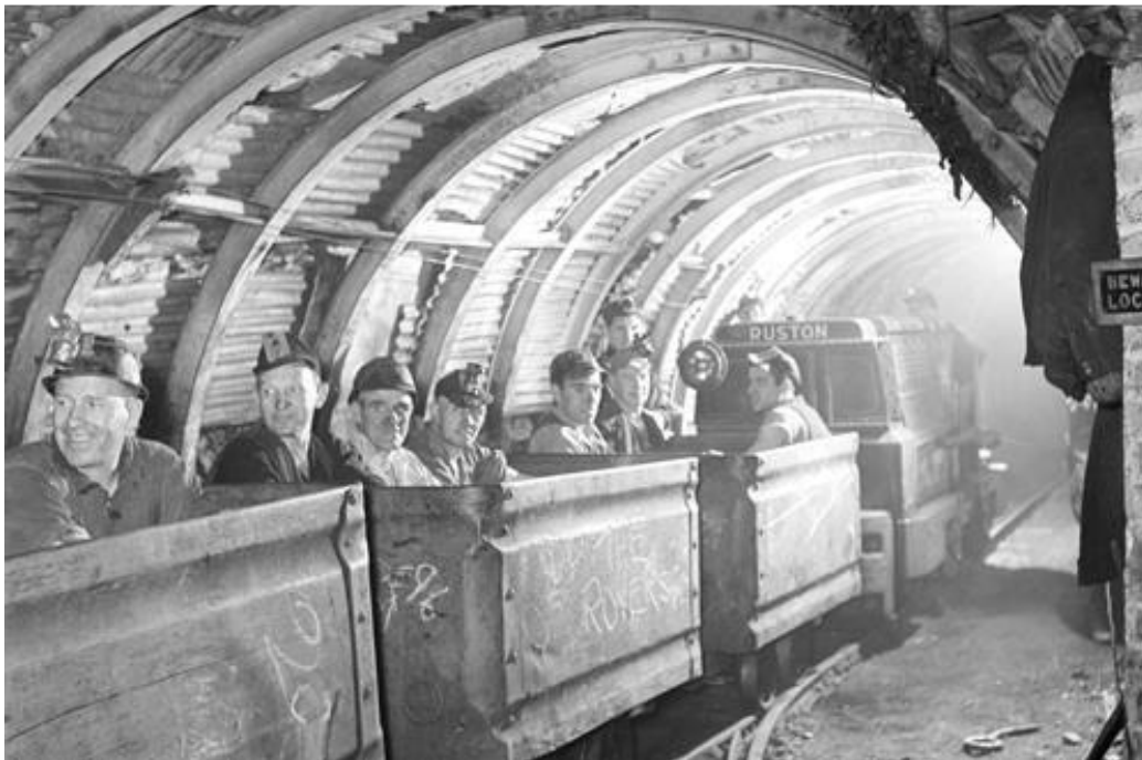
Slika 2-3. Prijevoz rudara vagonetima s lokomotivnom vučom (National Coal Mining Museum, 2022)

Tijekom prijevoza osoba prostorije moraju biti slobodne te se u njima ne smije obavljati ikakav drugi transport. U same prostorije po kojima se kreću lokomotive ne smije se deponirati nikakav materijal i moraju se redovito odvodnjavati. Za prolaz ljudi u aktivnim jamama