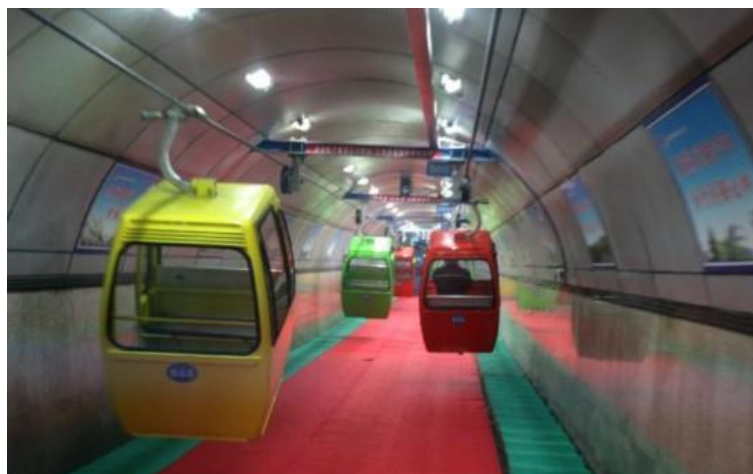
Slika 2-6. Prijevoz rudara žičarom u rudniku uglja tvrtke Henan Yima Coal Group in Gengcun Village, Sanmenxia City, central China's Henan Province (People's Daily Online, 2010)

Kontinuirani način transporta spuštanjem i dizanjem. Razni tipovi izvedbi sustava s različitim visećim tračnicama, sastoje se od pruge i čeličnog užeta koje se veže uz pojam žičare. U viseće žične željeznice se ubrajaju i jamske žičare s ovješanim sjedalicama, namijenjene za transport ljudi. One su sastav s beskonačnim užetom sa svrhom transporta ljudi. Sjedalice mogu biti fiksne i slobodne ovisno o nagibu. Do 18° slobodne i do 30° fiksne. Sustav sa slobodnom sjedalicom može postići veće brzine. Tijekom prijevoza sve stanice, skretnice i vrata moraju biti osvijetljeni. Ako se prijevozi više od 24 rudara stanica mora biti izgrađena u horizontalnoj prostoriji. Udaljenost žičare do poda mora iznositi najmanje 0,3 m. (Pavlović, 1963.) Primjer viseće žične željeznice prikazan je na slici 2-6, a prema izvoru, koristi se u rudniku uglja tvrtke Henan Yima Coal Group u središnjoj Kini (People's Daily Online, 2010).