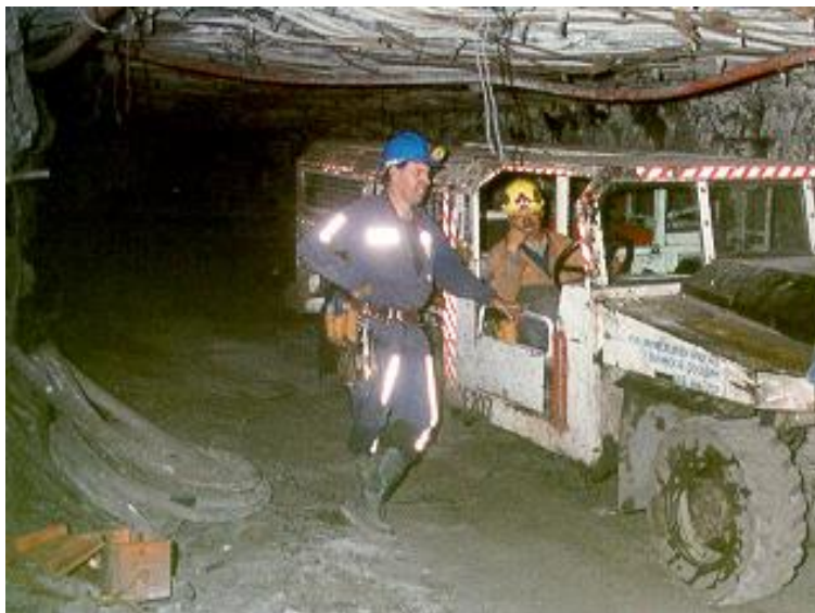
Slika 2-7. Prijevoz rudara u automobilom (Underground Coal, 2022)

Osim prethodno navedenih metoda transporta osoba, u podzemnim rudnicima osobe se mogu transportirati i biciklima. Uvjet za transport biciklima je da su vozne površine ravne. Biciklima se prijevoze rudari, nadzornici i specijalizirano osoblje. Zbog nesigurnosti i veće vjerojatnosti za ozljeđivanje ne koriste se toliko često. (Underground Coal, 2022)