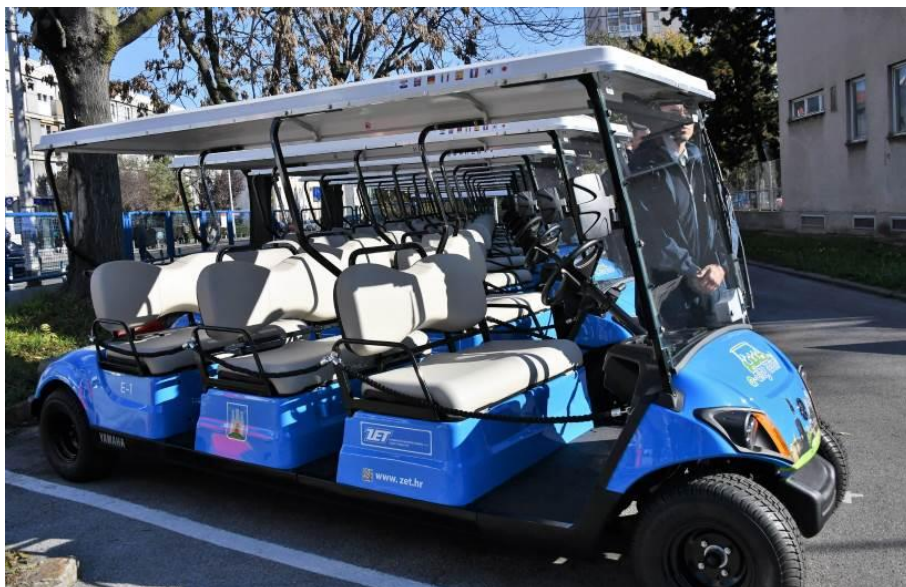
Slika 2-2. ZET-ov električno turističko vozilo proizvođača Yamaha ( www.zgexpress.net ) – električno vozilo sa otvorenim prostorom za putnike