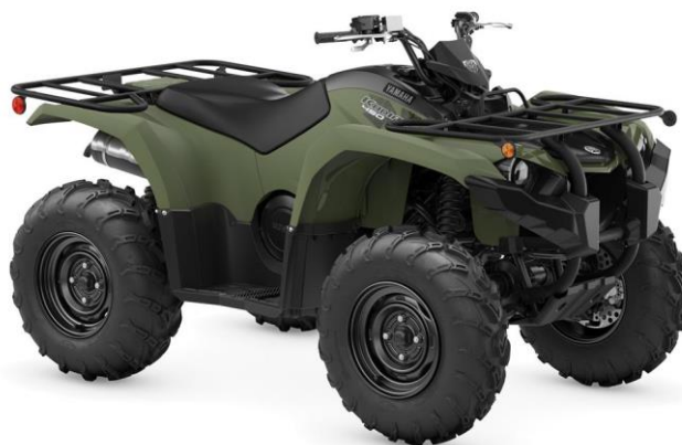
Slika 3-3. ATV Kodiak 450