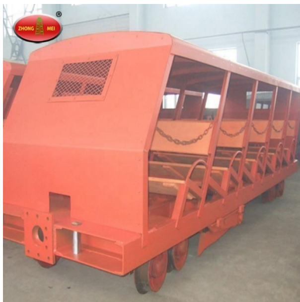
Slika 2-4. „Dolly car“ za prijevoz rudara proizvođača Shandong China Coal Group

U Hrvatskoj i na prostoru bivše SFRJ prijevoz rudara se obavljao vagonetima sličnima onima koji su se koristili za prijevoz materijala, s malim modifikacijama. Vagoneti za prijevoz rudara imali su ugrađena sjedišta za sigurniju i udobniju vožnju, bili su električno izolirani i morali su imati sigurnosnu kočnicu. Na zadnjem vagonetu nalazila se signalna lampa koja bi signalizirala prolaz. Broj vagoneta za prijevoz ljudi određivao se preko tehničkih sposobnosti lokomotive i maksimalne nosivosti stijene. Maksimalna brzina kojom se obavljao prijevoz ljudi nije smjela prelaziti 6 km/h, odnosno 3 km/h ako se uz to prevezio materijal, no na većim dubinama se moglo kretati i do 12 km/h. Vagoni i lokomotive se moraju redovito pregledavati: dnevno za mala oštećenja i tjedno za velika kako ne bi došlo do nesreće. (Sl. list SFRJ, br. 24/91). Slika 2-3 prikazuje prijevoz rudara vagonetima za uglj s lokomotivinom vučom u prošlosti u Velikoj Britaniji no nije jasno postoje li i u njemu modifikacije za prijevoz ljudi. U novije vrijeme koriste se specijalizirani vagoni za prijevoz rudara. Sami vagoni mogu biti priključeni za lokomotivu, a ukoliko je ulaz u rudnik pod velikim nagibom – čeličnim užetom. (Sl. list SFRJ, br. 24/91)