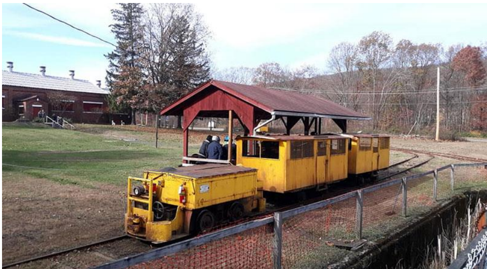
Slika 3-1. Lokomotiva za prijevoz turista u „No.9 Mine and museum“