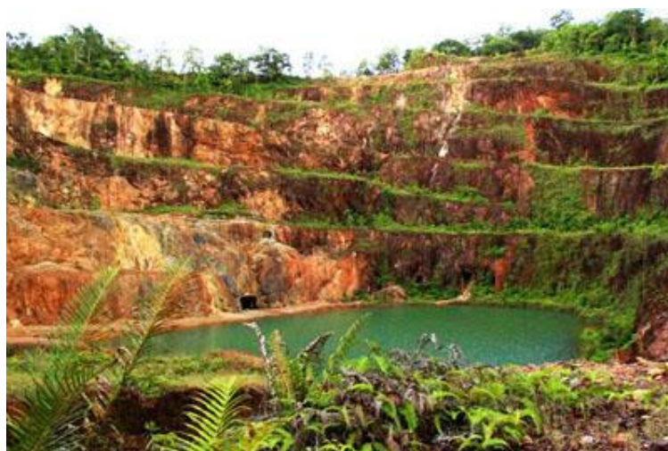
Slika 3-2. Kik Karak Hill