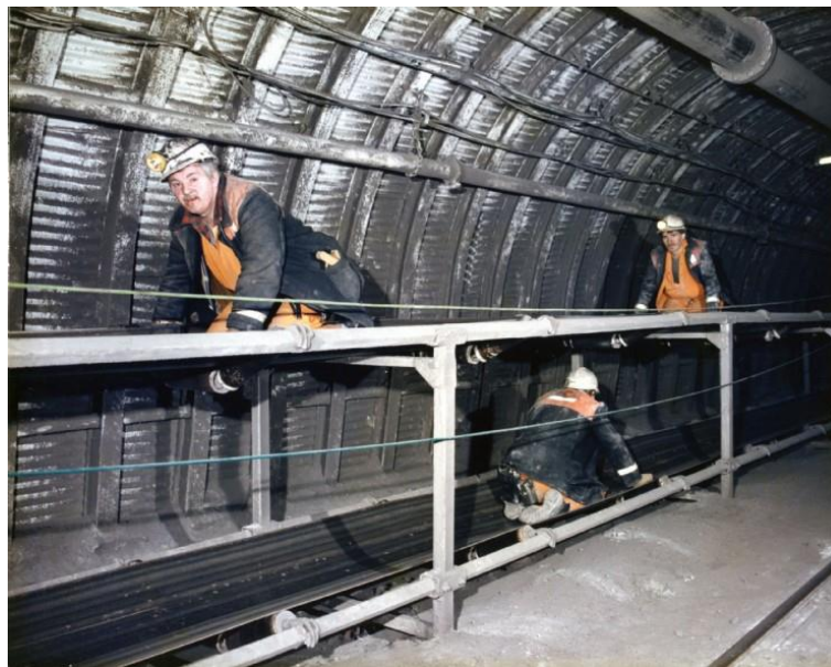
Slika 2-5. Prijevoz rudara u transportnom trakom (Dunda i Kujundžić, 2000)

Prijevoz beskonačnom trakom je jedan od najkorištenijih tipova transporta kontinuiranim načinom rada. Transporter se sastoji od trake, noseće konstrukcije, valjaka, pogona, uređaja za napajanje trake, te može sadržavati i druge dijelove. Transport se obavlja preko pomične elastične podloge koja se kreće u beskonačnu petlju. Prijevoz ljudi transportnom trakom obavlja se samo s posebnim konstrukcijskim i sigurnosnim mjerama. Transport ljudi obavlja se samo u horizontalnim ili kosim radovima do nagiba od 18^\circ . Za razliku od transporta vučom, istovremeni transport ljudi i materijala nije dopušten. Ljudi potrbuške ležeći s glavom naprijed stupaju na traku s određenim razmakom pazeći da se u tom da ne zapnu bilo kojim djelom za traku (slika 2-5). Znakovima je naznačena lokacija za izlazak s trake. Do ozljede može doći ukoliko se osobe ne pridržavaju sigurnosnih mjera. (Dunda i Kujundžić, 2000)