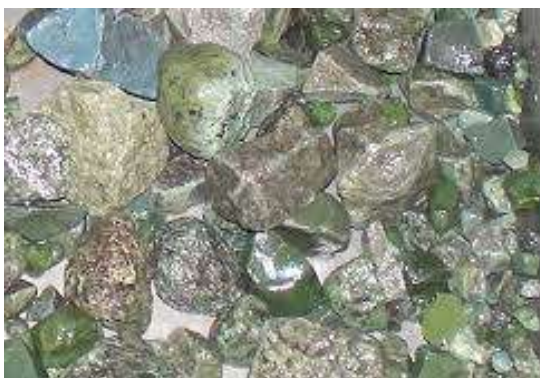
Slika 6-1. Silikomanganska troska