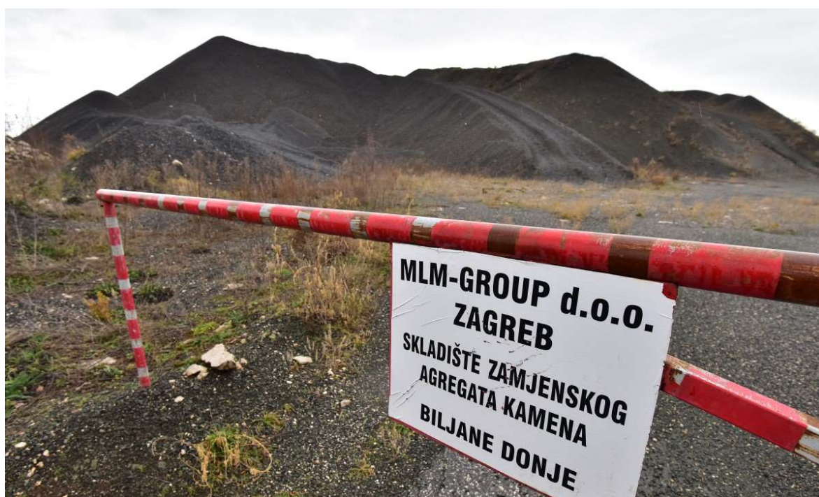
Slika 5-1. Odlagalište Biljani Donji

Oko 140.000 tona silikomanganske i feromanganske troske s područja bivše Tvornice elektroda i ferolegura pohranjeno je od svibnja 2010. do veljače 2011. godine na zemljište u Biljanima Donjim, prikazano na slici 5-1. Europska komisija je 2013. godine zaprimila pritužbe o crnom brdu troske koji se nalazi svega 50-ak metara od kuća u Biljanima Donjim te je 2014. godine uputila prigovor Republici Hrvatskoj o mogućem lošem gospodarenju otpadom. Europska komisija je još u nekoliko navrata pozivala Republiku Hrvatsku preko Europskog suda na što ranije zatvaranje i saniranje odlagališta u Biljanima Donjim zbog potencijalnog rizika za okoliš i zdravlje čovjeka.