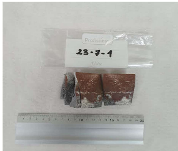
Slika 4-1. Prikaz uzorka 23-7-1 nakon sloma

Uzorku 23-7-1 utvrđena je gustoća od 2694,744 \text{ kg/m}^3 i jednoosna tlačna čvrstoća 77,408 \text{ MPa} , a sila pri kojoj se dogodio slom je iznosila 150,7 \text{ kN} . Izgled uzorka poslije sloma je prikazan na slici 4-1.