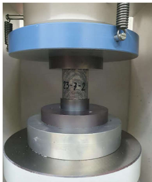
Slika 3-4. Ispitivanje uzorka 23-7-2

Drugi uzorak je imao oznaku 23-7-2 i on je bio visok 53,1 mm, promjer d_1 je bio isti kao promjer d_2 i oni su iznosili 49,7 mm dok je masa bila 278,61 g. Površina poprečnog presjeka je iznosila 1939,021 mm 2 , a volumen je iznosio 102962,015 mm 3 .