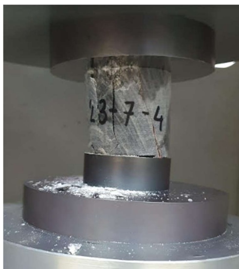
Slika 3-6. Ispitivanje uzorka 23-7-4

Zadnji uzorak je bio pod oznakom 23-7-4 i on je visok 52,2 mm, promjer d_1 je bio isti kao promjer d_2 i oni su iznosili 49,7 mm dok je masa bila 278,49 g. Površina poprečnog presjeka je iznosila 1939,021 mm 2 , a volumen je iznosio 101216,896 mm 3 .