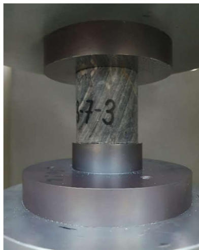
Slika 3-5. Ispitivanje uzorka 23-7-3

Treći uzorak je označen oznakom 23-7-3 i visok je 53,1 mm, promjer d_1 je bio isti kao promjer d_2 i oni su iznosili 49,7 mm dok je masa bila 278,97 g. Površina poprečnog presjeka je iznosila 1939,021 mm 2 , a volumen je iznosio 102962,015 mm 3 . Važno je napomenuti kako je treći uzorak imao pukotinu na krajnjem gornjem rubu.