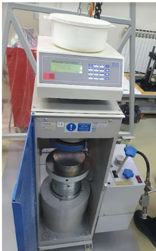
Slika 3-2. Prikaz uređaja za ispitivanje jednoosne tlačne čvrstoće