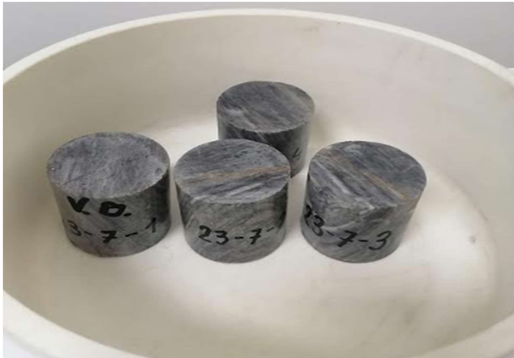
Slika 3-1. Prikaz pripremljenih uzoraka