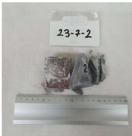
Slika 4-2. Prikaz uzorka 23-7-2 nakon sloma

Uzorku 23-7-2 utvrđena je gustoća od 2705,949 \text{ kg/m}^3 i jednoosntlačna čvrstoća 74,006 \text{ MPa} , a sila pri kojoj se dogodio slom je iznosila 143,5 \text{ kN} . Izgled uzorka poslije sloma je prikazan na slici 4-2.