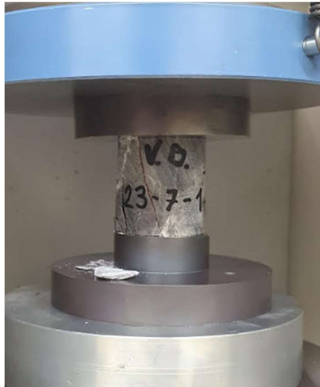
Slika 3-3. Ispitivanje uzorka 23-7-1

Prvi uzorak je imao oznaku 23-7-1 i on je bio visok 54,10 mm, promjer 1 ( d_1 mu je bio 49,9 mm), promjer 2 mu je iznosio d_2 = 49,7 mm, a masa mu je bila 283,82 g. Površina poprečnog presjeka je iznosila 1946,831 mm 2 , a volumen je iznosio 105323,55 mm 3 .