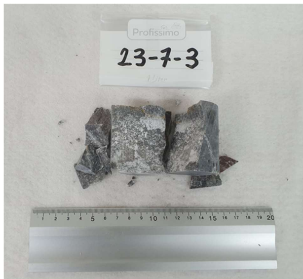
Slika 4-3. Prikaz uzorka 23-7-3 nakon sloma

Uzorku 23-7-3 utvrđena je gustoća od 2709,446 \text{ kg/m}^3 i jednoosna tlačna čvrstoća 80,917 \text{ MPa} , a sila pri kojoj se dogodio slom je iznosila 156,9 \text{ kN} . Izgled uzorka poslije sloma je prikazan na slici 4-3.