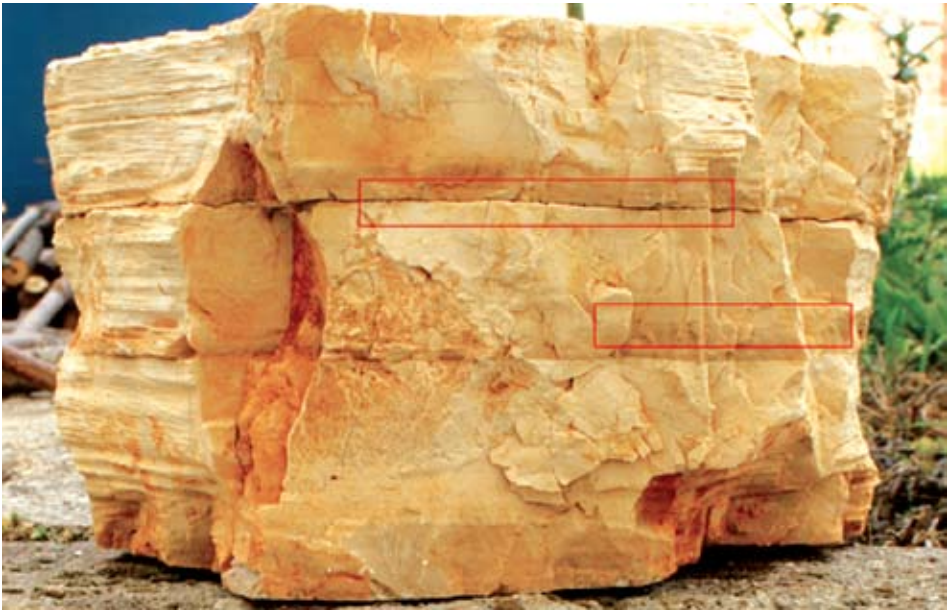
Sl. 7 Kontakt karbonatni muljnjak-kalkarenit: oštri (gore) i blagi (dolje)

"otvorenim", odnosno slobodnim za fizičko i mehaničko razdvajanje, bilo bi vrlo korisno i isplativo.