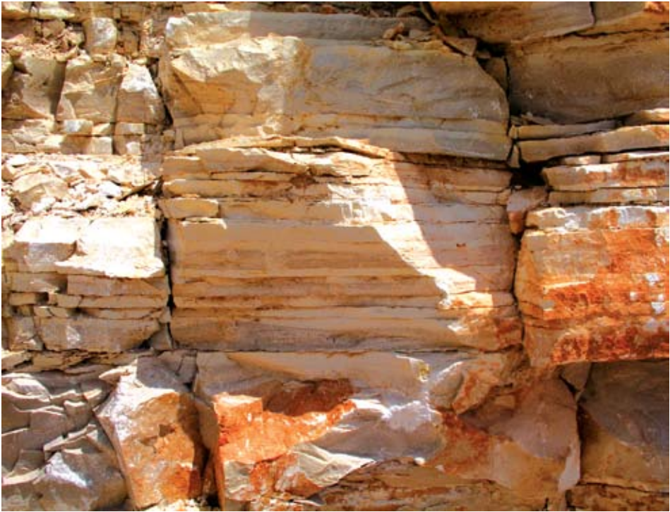
Sl. 1 Izmjena slojeva muljnjaka (mikrita) i kalkarenita

debljine. Prilikom ugradnje kameni elementi najčešće se polažu na način kako su bili položeni u ležištu ("naturally bedded"). U tom slučaju kameni su elementi opterećeni okomito na slojevitost. Takav se način ugradnje smatra statički najboljim i najprirodnijim posebice kod izrade zidova. Sporadično se njime oblažu fasade pri čemu se ugrađuje na način da su mu vidljive slojne plohe ("face bedded"). Vrlo rijetko se ugrađuje na način da su kamene ploče vertikalne i orijentirane okomito na vidljive površine kamenih konstrukcija ili "edge bedded".