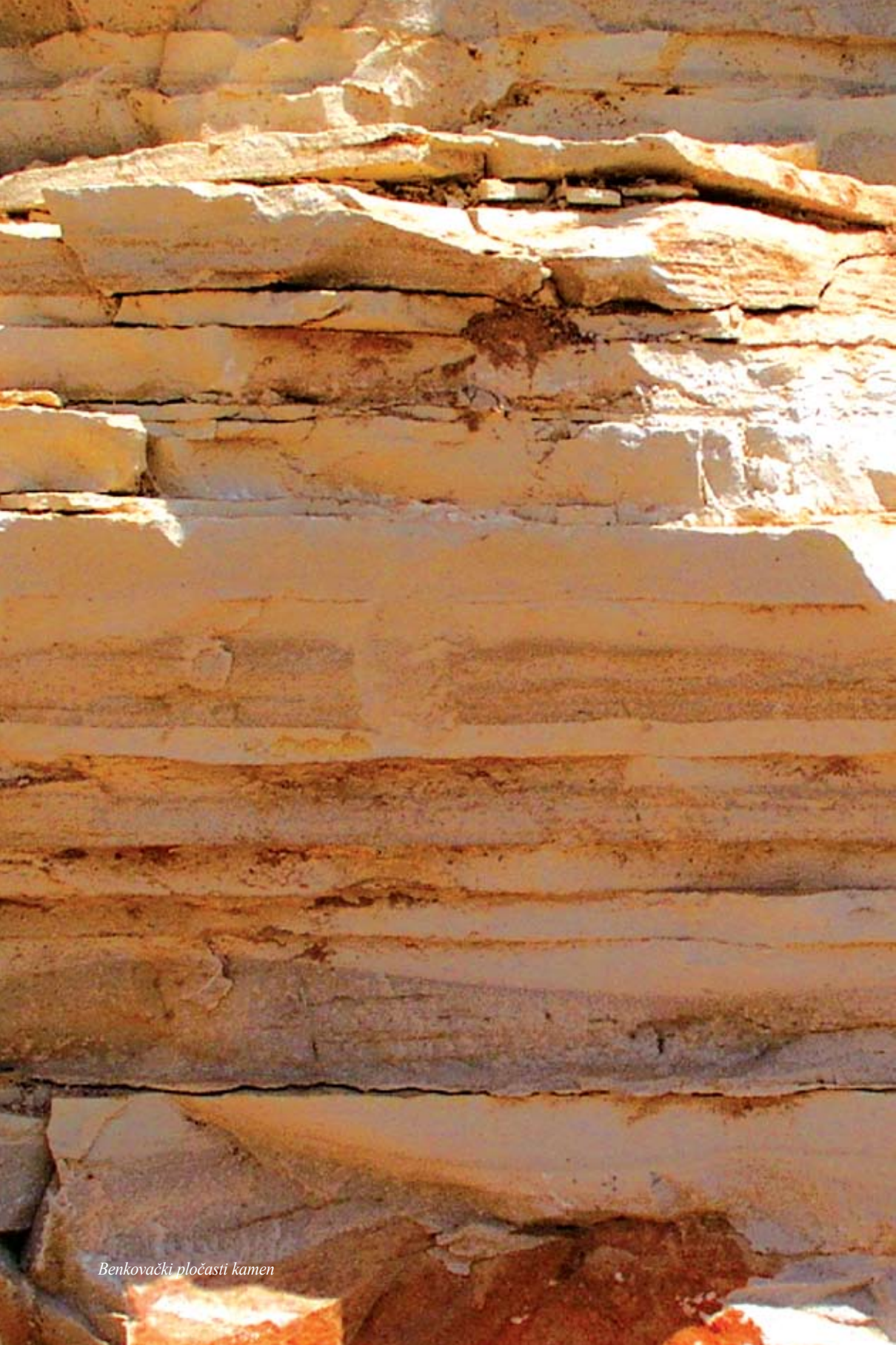
Benkovački pločasti kamen