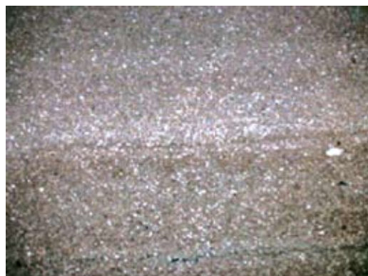
Sl. 5 i 6 Uzorak sa 3,0 m dubine: laminirana tekstura vidljiva (lijevo) i pod mikroskopom (desno)

Učestali udio kamenih elementa sa "zatvorenim slojnicama" smanjuje iskoristivost stijenske mase u ležištima. Brojni "zatvoreni", slijepljeni ili amalgamirani slojevi važno su obilježje i značajan problem kod većine ležišta na benkovačkom području. Smanjuju iskoristivost stijenske mase. Pojam amalgamirani dolazi od lat. riječi amalgamatio što se odnosi na stapanje, u ovom slučaju stapanje proslojaka. Učiniti "zatvorene slojnice"