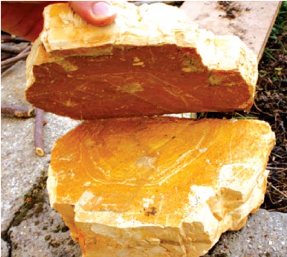
Sl. 8 Pojave zemljanog (glinovitog) materijala unutar "zatvorenih slojnica" olakšavaju razdvajanje

sa površine terena. Tijekom vremena mogu se filtrirati oborinama duž slojnih ploha i prisutnih sustava pukotina. Na sl. 9, 10 i 11 vidljivi su kameni elementi prije i poslije tretiranja vodom.