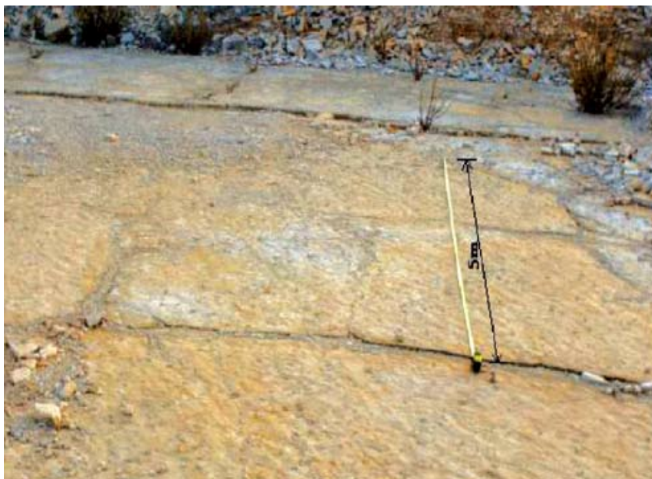
Sl. 4 Priprema za određivanje K_{pcj-5}

Primjer (f): Izračunavanje koeficijenta volumne cjelovitosti K_{vcj-6} : Dobiven je umnoškom koeficijenta linearne cjelovitosti (a) i koeficijenta površinske cjelovitosti (e), ( 0,56 \times 0,51 \times 100 = 28,56 %). Koeficijent linearne cjelovitosti utvrđen je okomito na slojevitost a koeficijent površinske cjelovitost odnosi se na površinu gornjeg vidljivog sloja u kamenolomu (sl. 4).