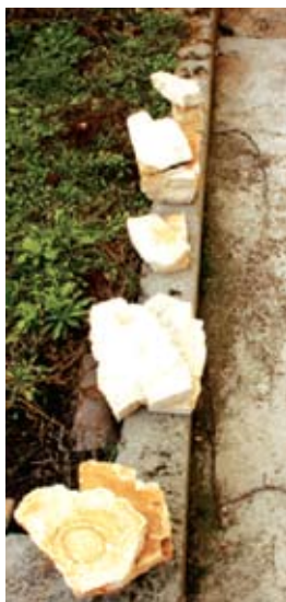
Sl. 9, 10 i 11 Uzorci sa "zatvorenim" slojnicama prije i poslije tretiranja vodom