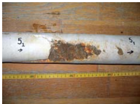
Sl. 8. Pukotina ispunjena crljenicom

Utvrđivanje cjelovitosti stijenske mase mora se provesti vrlo pomno. Izmjereni položaji diskontinuiteta u bušotinama (sl. 8), na površini terena i na otkopnim frontama starih radilišta mogu se analizirati na način da im se odredi optimalnost međusobnog prostornog odnosa mjerenjem i analizom kuta \varphi između diskontinuiteta. Prema tome, ako smo u ležištu izmjerili n različitih diskontinuiteta, broj njihovih