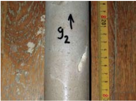
Sl. 10. Otopanje ljušturica fosilnog kršja