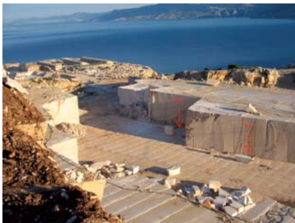
Sl. 1. Primjer ležišta prirodnog kamena s oznakama položaja bušotina

Posebna se pozornost stoga mora posvetiti istraživanju ležišta arhitektonsko-građevnog kamena. Istraživanje omogućuje utvrđivanje geološke građe i sastava ležišta. Ponajviše se to odnosi na određivanje strukturno-petrografskih značajki ležišta i tehničko-tehnoloških značajki kamena. Istraživanjem se prije svega trebaju zadovoljiti potrebe za određivanjem dekorativnosti kamena, posebice ako se radi o novom varijetetu