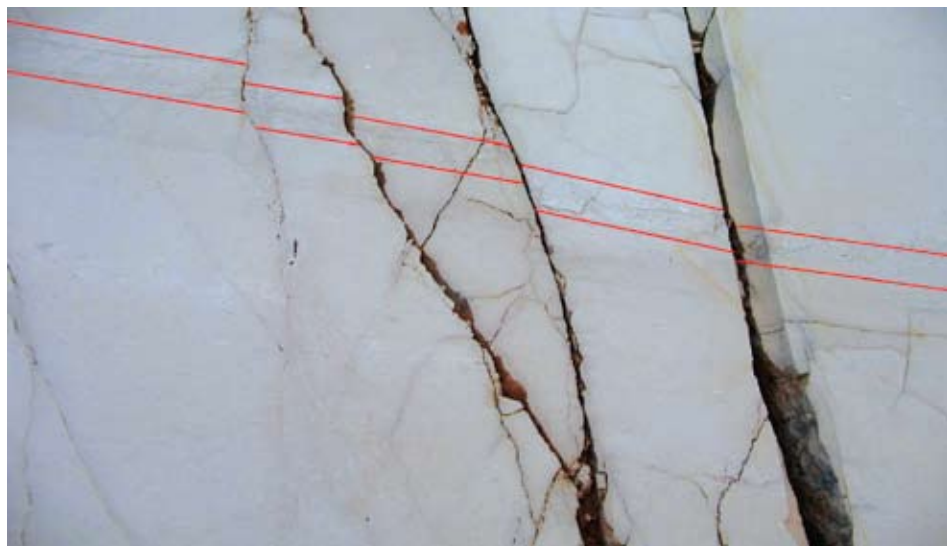
Sl. 7. Sloj pomaknut rasjedom (pukotine ograničavaju veličinu blokova)

Za svaku se bušotinu posebno određuje koeficijent linearne cjelovitosti. Cjeloviti dijelovi jezgri l_1, l_2, \dots, l_n analiziraju se posebno za pojedine intervale dužina npr. >50, >100, >150, >200 cm itd., već prema tome kakvi se blokovi očekuju u stijenskoj masi. Nakon toga linearni se koeficijenti K_{lcj1}, K_{lcj2} i K_{lcj3} izračunavaju za svaki smjer bušenja posebno, prema već prethodno spomenutim ograničenjima i dobivenim intervalima jezgri.