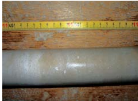
Sl. 11. Promjena boje na kontaktu vapnenca i dolomitiziranog vapnenca

Potrebno je utvrditi bilo kakvu pojavu koja može ukazivati na laminaciju, listanje te zonalnu i koncentričnu građu. Takve pojave nehomogenosti mogu prouzročiti listnato, koritasto i pločasto raspadanje kamena. Promjene boje mogu ukazivati na promjene nastale u vrijeme singenetskih, dijagenetskih i postdijagenetskih procesa (sl. 11).