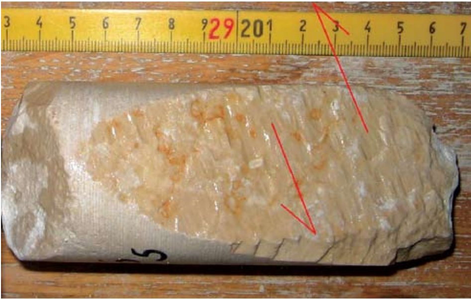
Sl. 4. Strije na kamenoj jezgri

Slika 4. prikazuje strije na kamenoj jezgri (jezgra je na lijevom prekidu oštećena habanjem te nije moguće ocijeniti je li se lom dogodio uzduž zdravog dijela ili pukotine). Strije ukazuju na smjer i intenzitet tektonskih gibanja u ležištu.