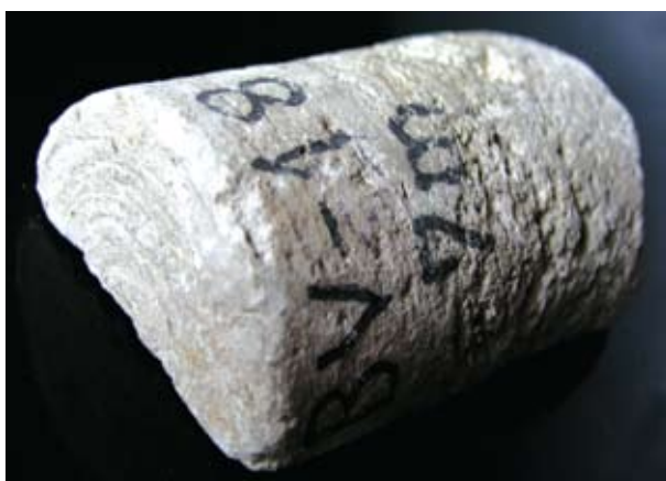
Sl. 2. Kamena jezgra izbrušena u osnovici zbog nepravilnog bušenja (porozni vinicit)

Na osnovi dugogodišnjeg iskustva može se sa sigurnošću tvrditi da se kvalitetom istražnog bušenja i interpretacijom dobivenih rezultata može učiniti znatan napredak