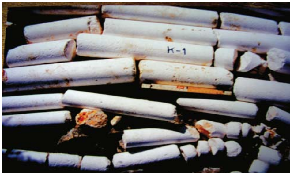
Sl. 3. Primjer neuspjelog bušenja na ležištu prirodnog kamena

Kakvoća bušenja i jezgre omogućuju dobru procjenu svih potrebnih čimbenika važnih za ležište. Važan je bušaći pribor koji ne uzrokuje lom kamene jezgre na mjestima gdje je ona prirodno zdrava i cjelovita.