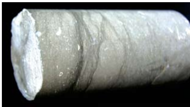
Sl. 6. Polirani uzorak jezgre iz bušotine (s prijelomom „naživo“)

Prirodni kamen je kamen koji se koristi za oplemenjivanje prostora u kojem živimo. Njegova dekorativnost je jedan od važnih čimbenika pri izboru kamena. Strukturne i teksturne značajke kamena i njegova boja važni su elementi u sklopu dekorativnog kriterija. Dekorativnost se utvrđuje na način da se cijela jezgra polira po potrebi, posebice ako se radi o novom ležištu (sl. 6). Moguće je i poliranje prethodno izrezane jezgre u tanke izdužene pločice što također omogućuje dobar uvid u strukturne i teksturne značajke kamena i njegovu dekorativnost. Mogućnost poliranja do visokog sjaja ukazuje na gust i kompaktan kamen bez pora.