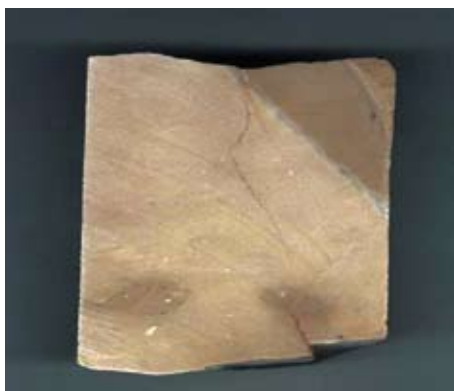
Sl. 9. Tektonski kontakt i mikropukotine u nejednoliko dolomitiziranom vapnencu

Za detaljno određivanje cjelovitosti važno je registrirati bilo kakve defekte koji bi mogli prouzročiti pucanje jezgre, kamenog bloka ili ploče u tijeku piljenja, brušenja i poliranja ili pak nakon ugradnje kamenih elemenata i ploča. Mikro i makro defekti, različito koncentrirane pore, stiloliti, pukotine i kaverne nastale tektonizacijom (sl. 9), te desikacijske pukotine (nastale isušivanjem) moraju se na presjecima bušotina detaljno zabilježiti. Posebno je opasna jasno i slabo vidljiva mikroslojevitost koja može voditi štetnom listanju kamena.