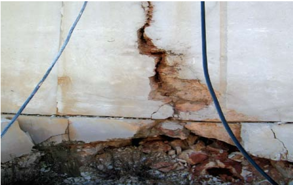
Sl. 5. Kavernozna zona

U prikazu presjeka bušotine svaki se prekid jezgre mora označiti na način iz kojega je vidljivo je li prekid uzduž prirodnog diskontinuiteta ili je nastao kao rezultat nepravilnog rada.