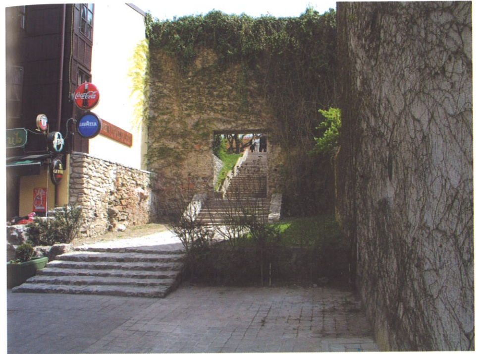
Prolaz prema parku Opatovina (litotamnijski vapnenac i mramorizirani vapnenac s kojima je obavljena obnova dijela konstrukcije bedema i prolaza)

Povijesno najstariji dio Tkalče čini visoki i debeli kaptolski kameni zid prema Potoku (današnja Tkalčičeva). Bio je to nekoć zapadni obrambeni zid Kaptola. Danas se on najbolje može vidjeti na mjestu gdje se iz Tkalče stepenicama stiže u park Opatovina. Tu je također upotrebljen litotamnijski vapnenac iz