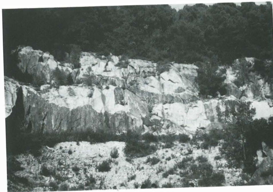
Kamenolom Mala Burina