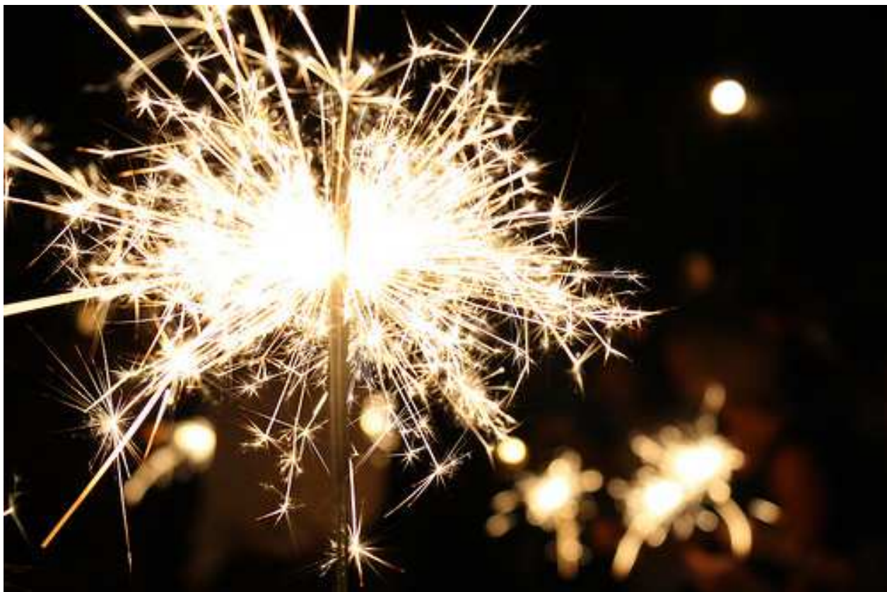
Slika 4-4. Korištenje magnezija (mstworkbooks.co.za, 2015)

Na slici 4-4. prikazane su iskre nastale korištenjem magnezija.