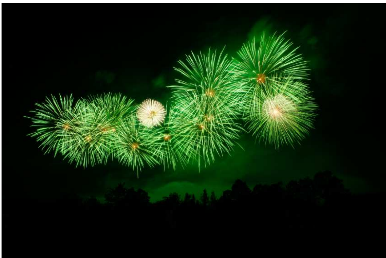
Slika 4-2. Prikaz barijevog nitrata (basstechintl, 2015)

Na slici 4-2. je prikazana reakcija barijevog nitrata u pirotehničkoj smjesi.