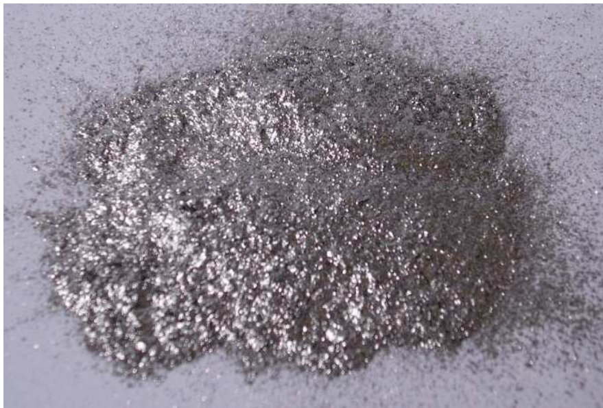
Slika 4-3. Aluminijev prah.

Na slici 4-3. Prikazan je aluminijev prah.