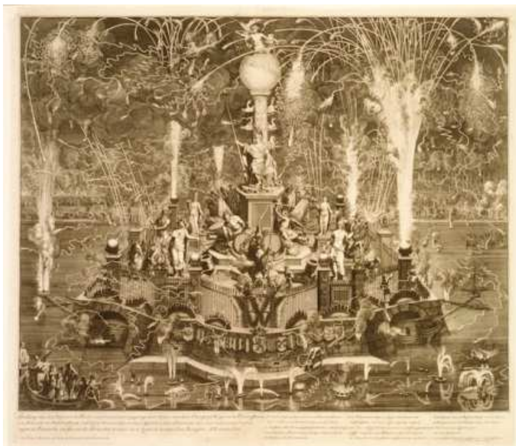
Slika 2-1. Konstrukcija vatrometa u prošlosti (blogs.artinfo, 2013)

Na slici 2-1. prikazana je nekadašnja konstrukcija za vatromete.