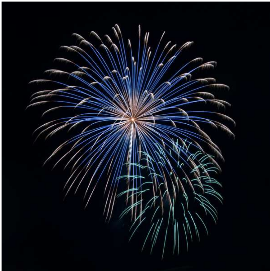
Slika 4-7. Prikaz efekta nastalog uporabom bakra

Na slici 4-7. Prikazana je uporaba bakra za dobivanje plave boje.