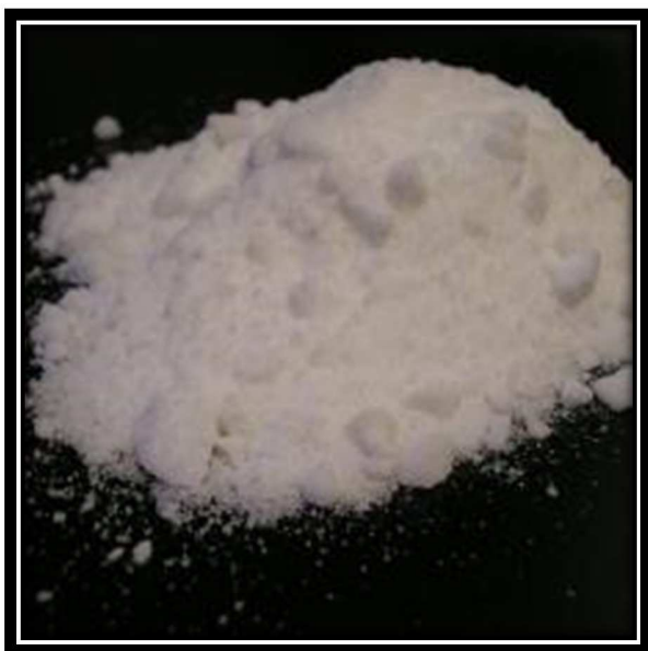
Slika 4-1. Amonijev perklorat (pyrodata, 2015)

Na slici 4-1. Prikazan je amonijev perklorat.