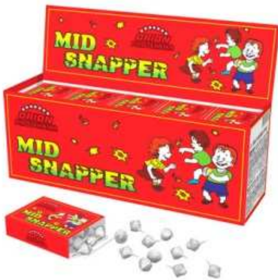
Slika 3-1. Pirotehničko sredstvo razreda I – udarne bombice 180 MID SNAPPER (Orion, 2015).

Na slici 3-1. prikazano je pirotehničko sredstvo razreda I – udarne bombice, komercijalnog imena 180 MID SNAPPER.