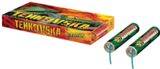
Slika 3-2. Pirotehničko sredstvo razreda II – petarda Tenkovska (;Mirnovec, 2015).

Na slici 3-2. prikazano je pirotehničko sredstvo razreda II– petarda komercijalnog naziva Zolja.