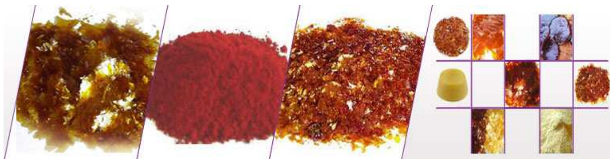
Slika 4-6. Šelak (karepo, 2015)

Na slici 4-6. prikazan je šelak u raznim oblicima.