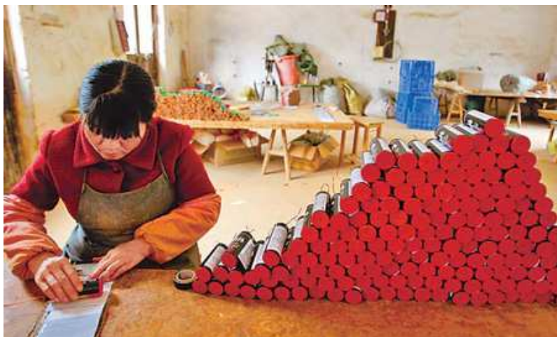
Slika 1-1. Proizvodnja petardi (fireworksden, 2014)

Na slici 1-1. je prikazana proizvodnja petardi