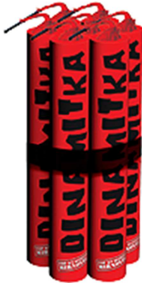
Slika 3-3. Pirotehničko sredstvo razreda III – petarda Dinamitka (Mirnovec, 2015).

Na slici 3-3. prikazano je pirotehničko sredstvo razreda III – petarda komercijalnog naziva Topovski udar.