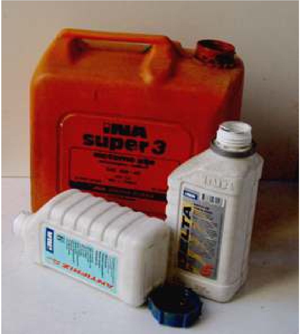
Slika 2-1 Ambalažni otpad – primjer kantica motornog ulja u Hrvatskoj ( http://lerotic.de/опасni/index.htm )