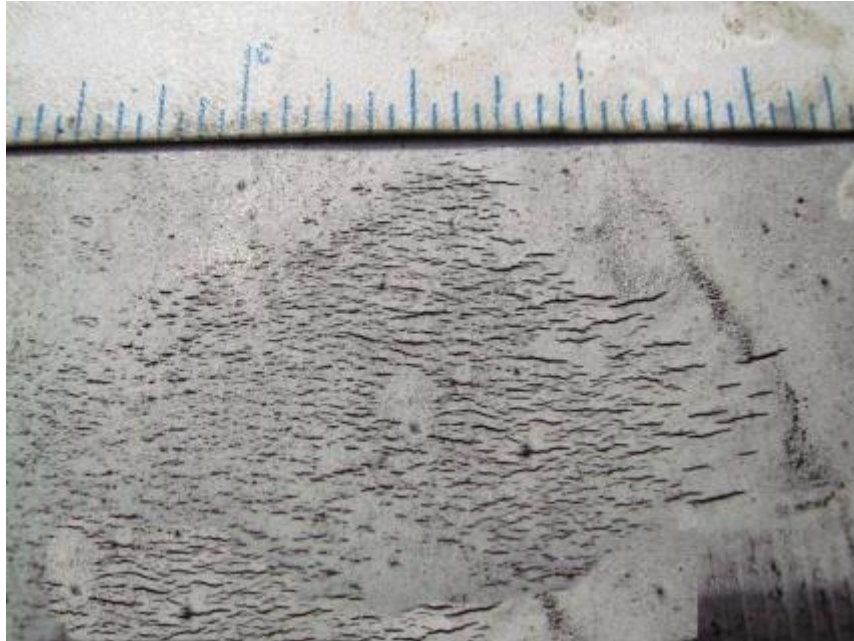
Slika 3-1. Serija pukotina uslijed korozije (Tomar et al., 2008)