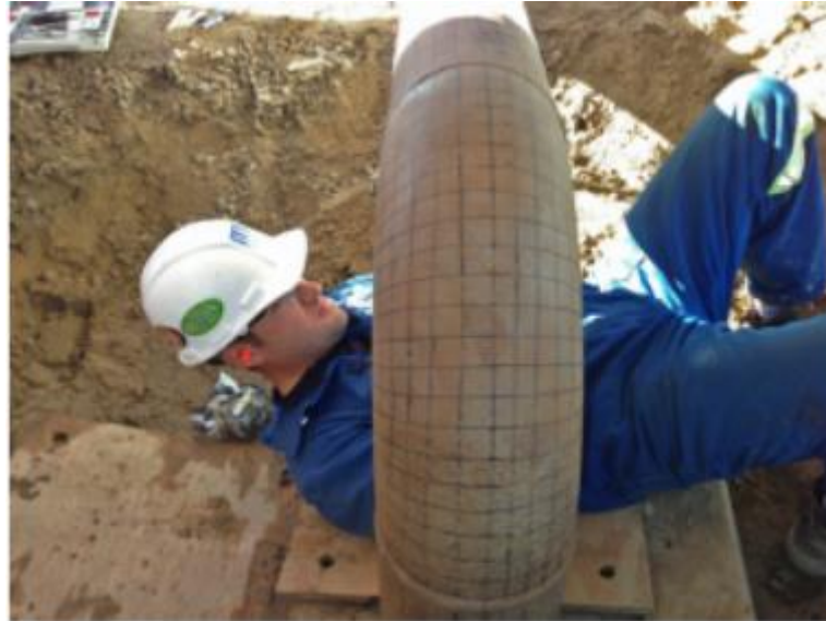
Slika 1-2. Direktan pregled stanja jednog dijela cjevovoda (Revie, 2015)