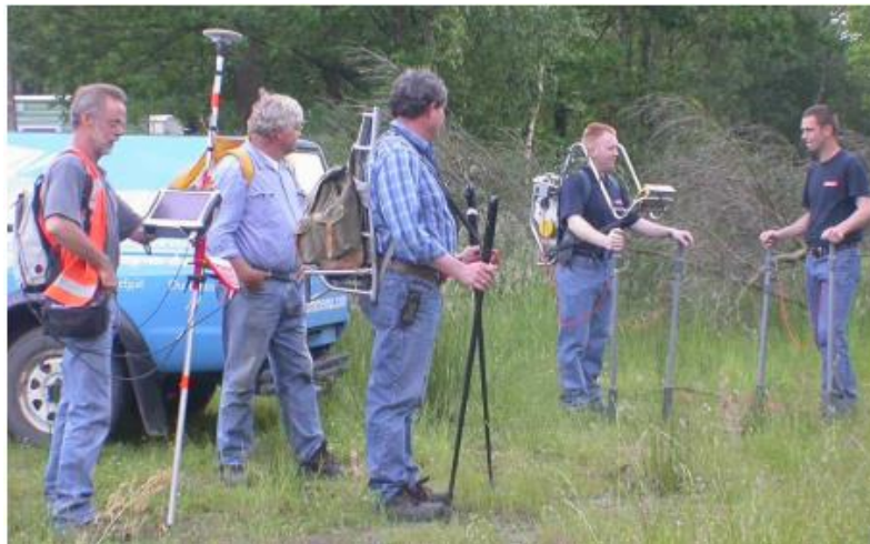
Slika 2-1. Radna skupina s pripadajućim alatom za mjerenja (van Os i van Mastrigt, 2006)

korozije. Slika 2-2. prikazuje direktan pregled jednog dijela cjevovoda. U zadnjem koraku (naknadna procjena) analiziraju se prikupljeni podaci iz prethodnih koraka na temelju kojih se donosi zaključak o uzrocima i posljedicama vanjske korozije na površini metala, a ujedno se određuju intervali koji bi trebali još jednu procjenu. Izračuni koji se koriste u zadnjem koraku sastoje se od računanja mogućnosti nastanka kvara po kilometru uslijed vanjske korozije na temelju direktnog i indirektnog pregleda, zatim, ovisno o izračunatoj vrijednosti kvara po kilometru cjevovoda računa se i vremenski interval do sljedećeg direktnog pregleda. Kad se na istom cjevovodu provedu nova nadzemna istraživanja, cjevovod će biti subjekt novog direktnog pregleda, ali će rezultati prethodnog pregleda biti dostupni za korak indirektnog pregleda.