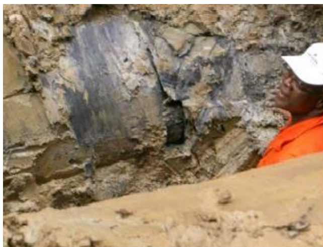
Slika 2-4. Nepostojanje premaza locirano mjerenjem gradijenta napona istosmjerne struje (Nicholson, 2006)