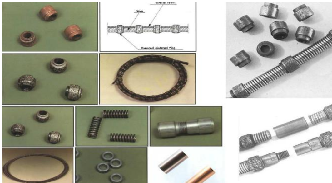
Slika 2-3: Elementi koji formiraju dijamantnu žicu njihovim nizanjem na čelično uže (Dunda, Kujundžić, 2003.)

Dijamantne perle su osnovni rezni dio žice i o njima ovisi učinak i potrošnja alata. Postoje dvije vrste perli ovisno o načinu nanošenja dijamantnih zrnaca na metalni nosač a to su galvanizirane i sinterirane perle. Po obliku se razlikuju konične i cilindrične perle. Parametri dijamantnog sloja perli su koncentracija, granulacija i marka dijamantnih zrnaca i vrsta veziva kojom su ta zrnca povezana. Veoma je bitno uspostaviti pravac kretanja piljenja koji ostaje isti tijekom cijelog procesa u protivnom može doći do ispadanja zrnaca iz veziva te bržeg trošenja dijamantnog sloja perli. Kod obnavljanja žice bitno je i paziti na smjer okretanja perli. O koncentraciji dijamanta će ovisiti broj reznih elemenata na pojedinoj perli te ona bitno utječe na potrošnju dijamantnog sloja i efikasnost samog alata. Kod perli s većom koncentracijom manje će se trošiti dijamantni sloj zbog manjih naprezanja na pojedino zrnce ali takve perle su i skuplje pa će svaki zastoј u radu puno više financijski opterećivati cijeli kop. Kod odabira optimalne granulacije prvenstveno se vodi računa o vrsti kamena. Kod većih zrnaca dolazi do većih otpora rezanja, veće količine skinutog materijala i veće količine vode za hlađenje ali je kvaliteta ispiljene površine lošija. Različite marke dijamantnih zrna uslijed svojih različitih svojstava daju i različite učinke, čvršća zrnca se manje troše te su pogodnija za piljenje tvrdih kamena (Dunda, Kujundžić, 2003).