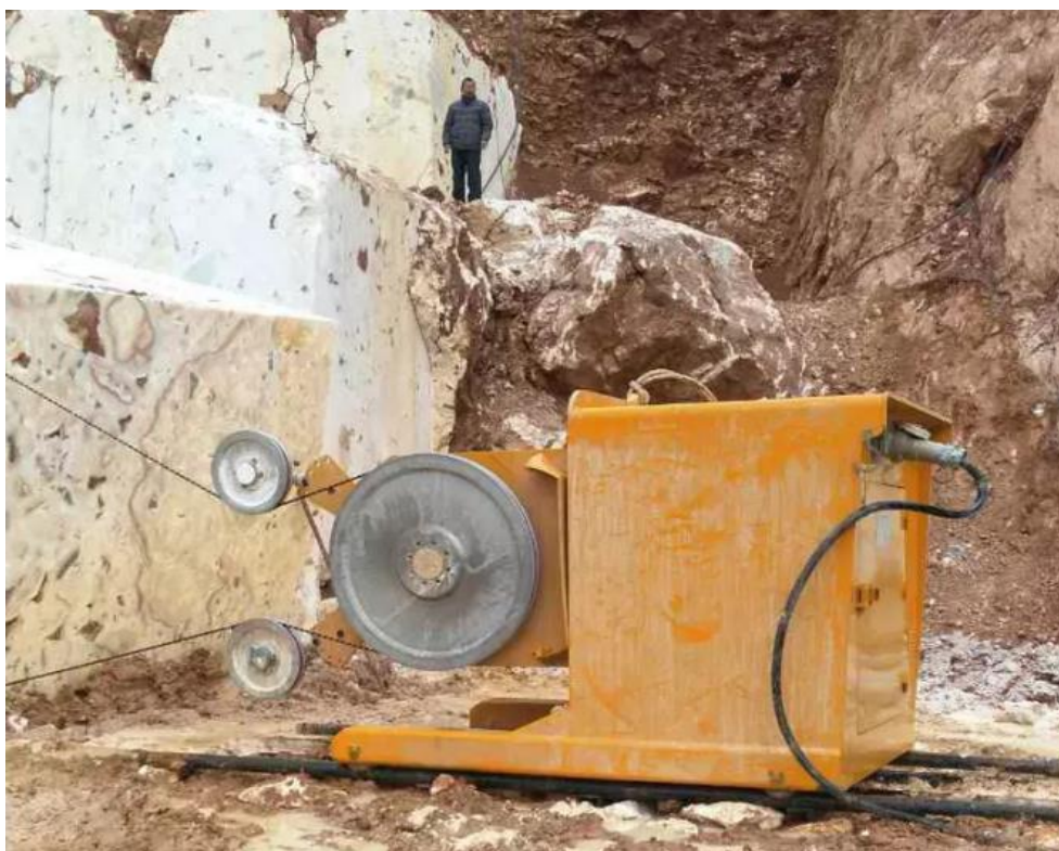
Slika 2-1: Dijamantna žična pila

Dijamantna žična pila je stroj koji pili stijenu korištenjem abrazivne dijamantne žice kao reznog elementa namotanog u beskonačnu petlju oko pogonskog kotača trenja. Sastoji se od pogonskog dijela sa zamašnjakom i komandnog dijela, pogonska jedinica se nalazi u kućištu na poluosovini unutar konstrukcije na četiri kotača. Komandni dio je odvojen od pogonskog dijela radi zaštite rukovatelja. Zamašnjak se dovodi u odgovarajući položaj preko poluosovine te se taj položaj podudara s orijentacijom reza koja će se izvesti. Suvremene izvedbe imaju mogućnost piljenja bilo kakvog horizontalnog, kosog ili vertikalnog reza. Pogonski kotač je obložen gumenom oblogom koja štiti dijamantnu žicu i sam kotač od trošenja, sama obloga se istroši u mjesec dana normalnog rada i mijenja se, te također osigurava potreban koeficijent trenja preko kojeg se vučna sila kotača prenosi na žicu pomoću sile trenja. Ispred zamašnjaka se nalaze dva orijentacijska kotura koji povećavaju obuhvatni kut žice i sprječavaju njeno ispadanje s kotača.(Dunda, Kujundžić 2003.)