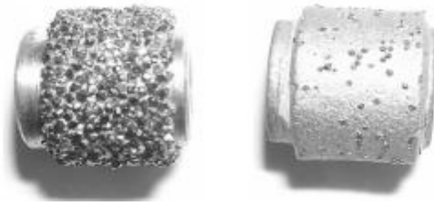
Slika 2-4: Galvanizirana i sinterirana perla ( Cardu, Patrucco, 2005)