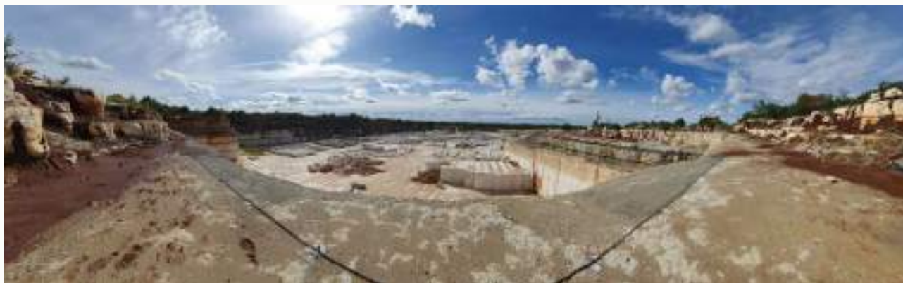
Kamenolom Kanfanar u kojem se nalaze naslage vezane za gornjoaptsko–gornjoalbsku emerziju (zelenkasto-siva paleotla) i najmlađu emerziju (crvenice)