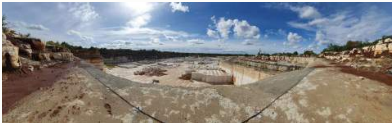
Kamenolom Kanfanar u kojem se nalaze naslage vezane za gornjoaptsko–gornjoalbsku emerziju (zelenkasto-siva paleotla) i najmlađu emerziju (crvenice)