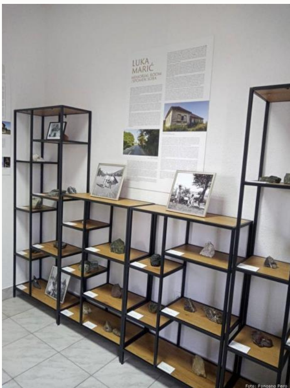
Dio postava izložbe