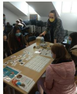
ENGIE projekt na Noći muzeja u Radoboju

Početkom godine, 28. siječnja, u okviru manifestacije „Noć muzeja“ u Muzeju Radboa u Radoboju održane su dvije ENGIE radionice „Stijenski ciklus“ i „Zemljina vremenska linija“ za 44 učenika četiri razreda (od 5. do 8. razreda) osnovne škole iz Radoboja koji su pokazali iznimni interes za geoznanosti.