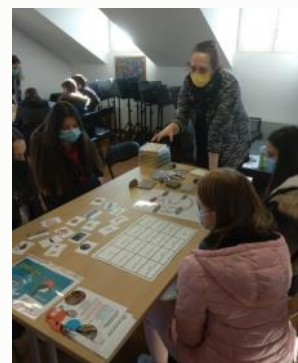
ENGIE projekt na Noći muzeja u Radoboju

Početkom godine, 28. siječnja, u okviru manifestacije „Noć muzeja“ u Muzeju Radboa u Radoboju održane su dvije ENGIE radionice „Stijenski ciklus“ i „Zemljina vremenska linija“ za 44 učenika četiri razreda (od 5. do 8. razreda) osnovne škole iz Radoboja koji su pokazali iznimni interes za geoznanosti.