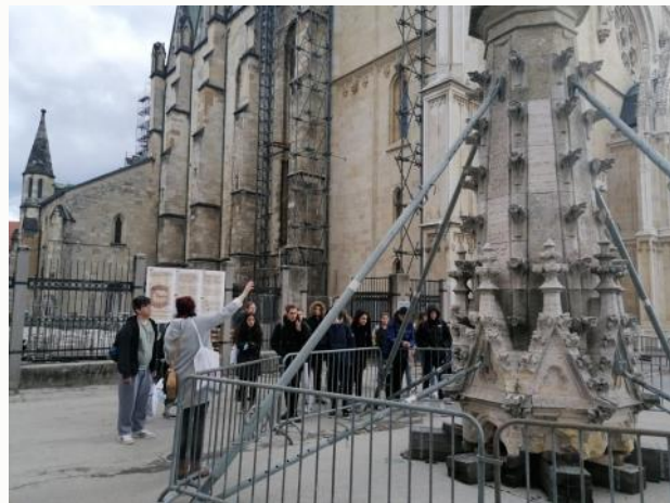
Radionica „Zemlja, čovjek i geotehnologija“