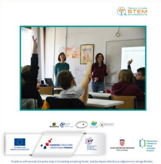
STEM ambasadorice u osnovnoj školi Petra Preradovića u Zagrebu

https://www.civilnodrustvo.hr/stem-ambasadorice-ucenicima-s-volovcice-odrzale-predavanje-o-gradi-zemlje-nastanku-i-jacini-potresa/ ; https://poduzetnik.biz/produktivnost/petasi-s-volovcice-s-velikim-zanimanjem-ucili-o-potresima/ , zatim u reportaži prikazanoj u Dnevniku HRT-a: https://magazin.hrt.hr/mladi/djecu-se-uci-kako-se-ponasati-u-slucaju-potresa-ali-i-kako-se-osloboditi-straha-6316894 te u gostovanju dr. sc. Marije Mustać na Otvorenoj televiziji.