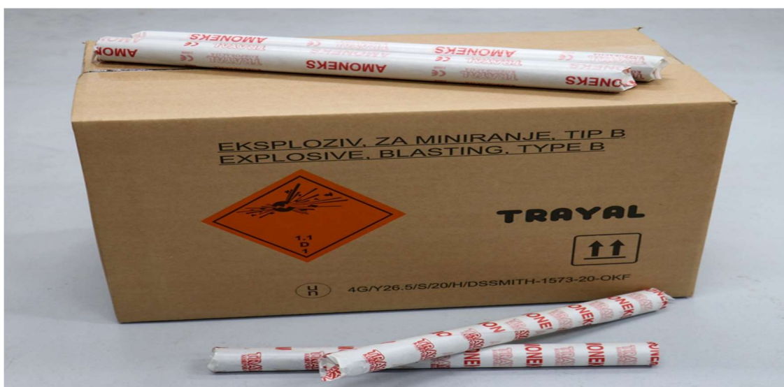
Slika 4-8. Amonij nitratni praškasti eksploziv AMONEKS. (Trayal, 2023)

Amonij nitratni praškasti eksplozivi su praškasti eksplozivi izrađeni na bazi TNT-a i amonijum nitrata. Slabe su osjetljivosti na udar i trenje, zbog čega spadaju u eksplozive sigurne za rukovanje i transport, a nisu ni štetni za okolinu. Pri niskim temperaturama ne smrzavaju. Primjenjuju se prije svega za masovna rudarska miniranja u podzemnoj i površinskoj eksploataciji, za miniranje od mekih do čvrstih stjenskih masa, gdje nisu prisutni metan i eksplozivna ugljena prašina. Iniciraju se klasičnim sredstvima za iniciranje: rudarskom kapicom, električnim detonatorima, neelektričnim sustavom iniciranja i detonirajućim štapinom. Zbog svoje niske vodootpornosti koriste se za miniranja u suhim i vlažnim mitskim bušotinama, a nisu primjenjivi za miniranje u bušotinama u kojima ima vode. na Slici 4-8 prikazan amonij nitratni praškasti eksploziv.