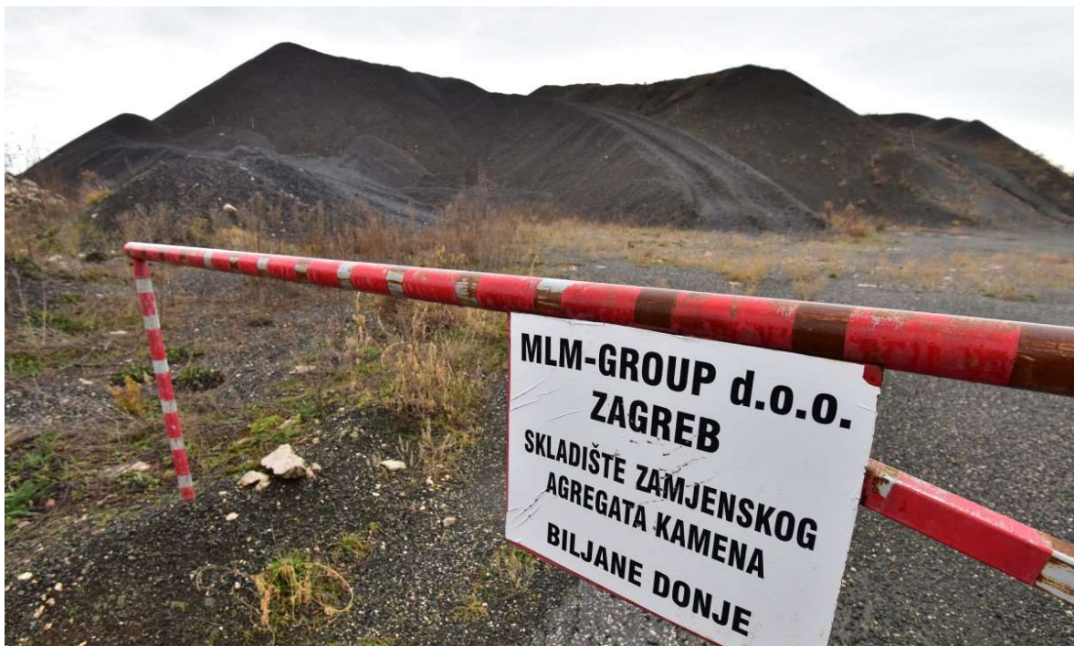
Slika 5-1. Odlagalište Biljani Donji

Oko 140.000 tona silikomanganske i feromanganske troske s područja bivše Tvornice elektroda i ferolegura pohranjeno je od svibnja 2010. do veljače 2011. godine na zemljište u Biljanima Donjim, prikazano na slici 5-1. Europska komisija je 2013. godine zaprimila pritužbe o crnom brdu troske koji se nalazi svega 50-ak metara od kuća u Biljanima Donjim te je 2014. godine uputila prigovor Republici Hrvatskoj o mogućem lošem gospodarenju otpadom. Europska komisija je još u nekoliko navrata pozivala Republiku Hrvatsku preko Europskog suda na što ranije zatvaranje i saniranje odlagališta u Biljanima Donjim zbog potencijalnog rizika za okoliš i zdravlje čovjeka.