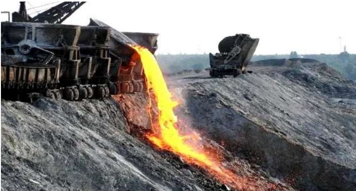
Slika 2-1. Izlivanje troske

Odlaganje troske iz električnih peći provodi se na način da se troska iz peći izlijeva u lonac s vatrostalnom oblogom te se vozilima ili vagonima prevozi do mjesta gdje se izlijeva i zatim hladi. Troska se najčešće izlijeva na betonirane površine ili bazene gdje se hladi na zraku ili ubrzanim putem hlađenja vodom, što vidimo na slici 2-1.