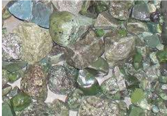
Slika 6-1. Silikomanganska troska (Izvor: Građevinar 63 (2011) 5, 441-447)