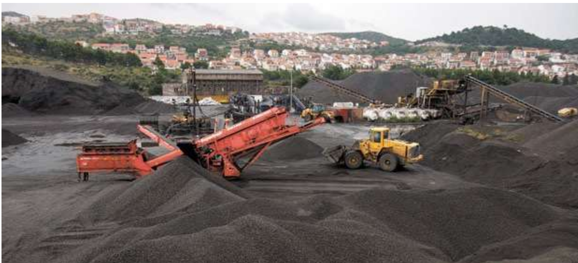
Slika 4-1. Početak sanacije troske

Nakon zatvaranja Tvornice elektroda i ferolegura u Šibeniku, na lokaciji su ostavljene različite vrste otpada, kao što su fenolni ostatci, otpadne grafitne elektrode, feromanganska i silikomanganska troska, katran, reciklirani odvojeni granulati i drugi. Sanacija lokacije odvijala se u tri neovisna segmenta. Rušenje građevinskih objekata odvijalo se od 1999. do 2002. godine. Druga faza bila je ekološka sanacija terena, koja se sastojala od uklanjanja opasnog i neopasnog otpada te sanacije kontaminiranog tla. Zadnja faza bila je sanacija otpadne troske. Na slici 4-1. vidimo početak sanacije troske s područja bivše tvornice.