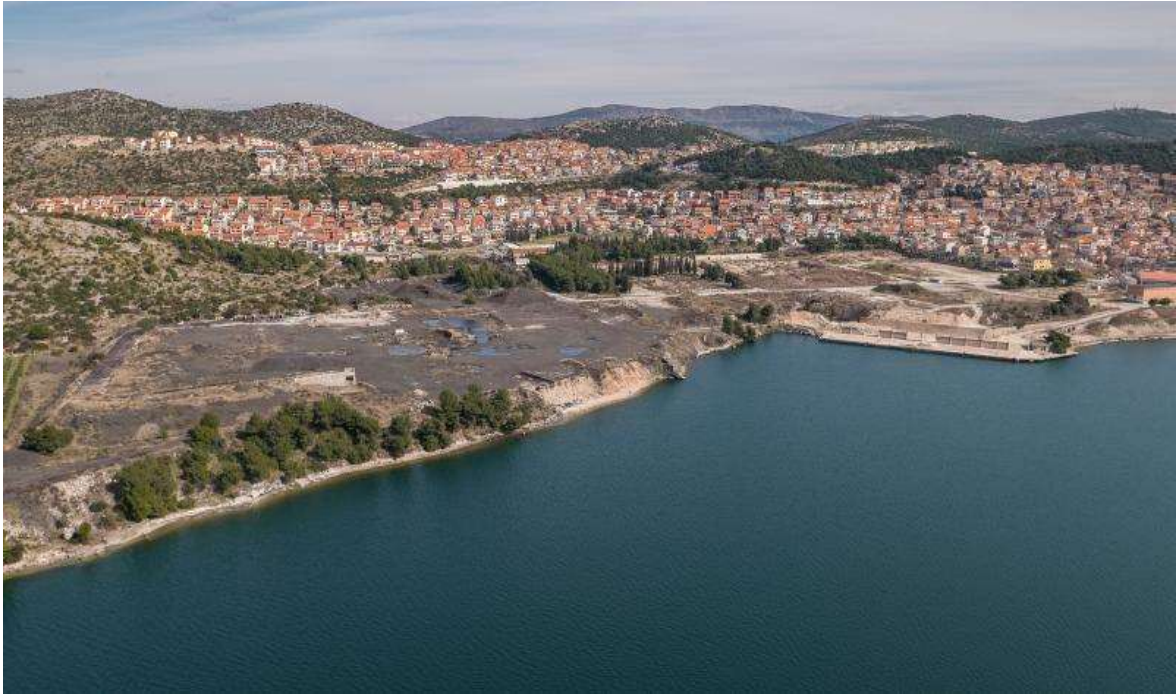
Slika 4-2. Prostor bivše tvornice

U skladu s rezultatima istraživanja, otpad treba predati ovlaštenom sakupljaču na daljnje analize ili odlaganje na odlagalištu neopasnog otpada te na kraju provesti kontrolne analize preostalog tla na lokaciji. U budućnosti, ukoliko se pojavi bilo kakvo onečišćenje, vlasnik zemljišta ima odgovornost provođenja i financiranja dodatnih sanacija (ARUP, 2020a, 2020b i 2020c).