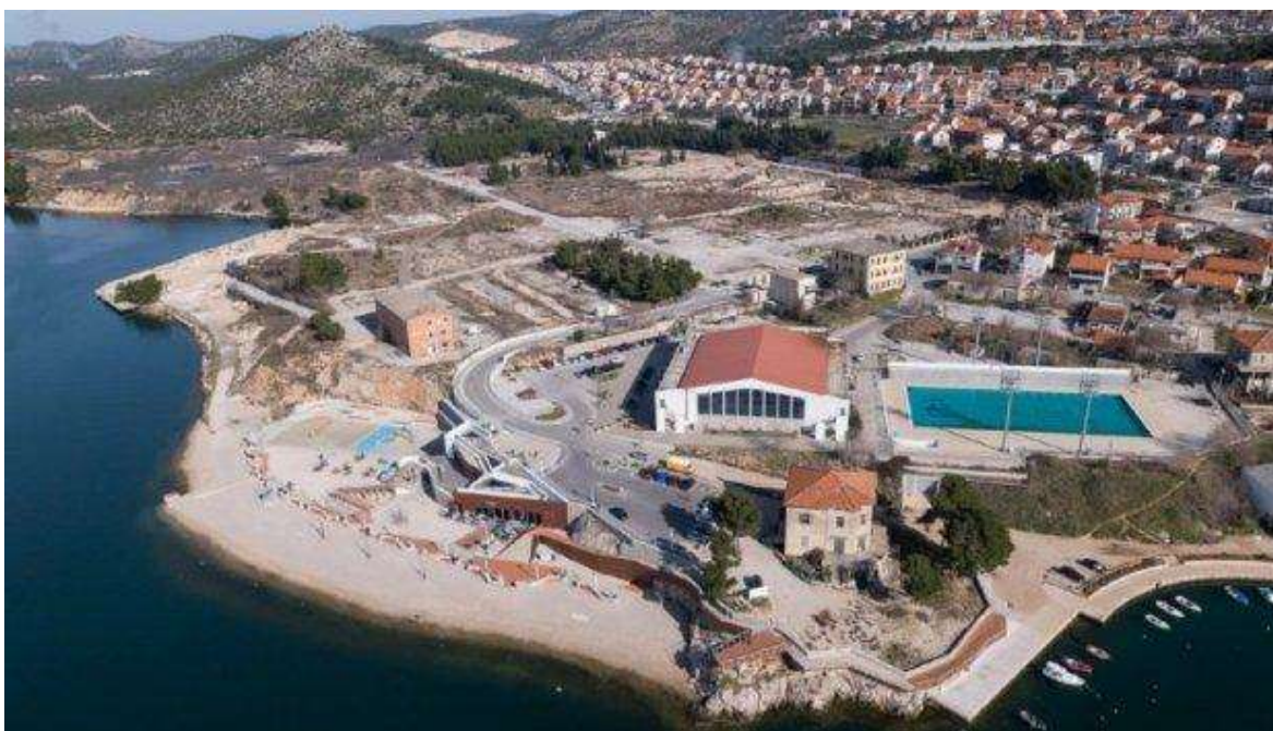
Slika 7-1. Plaža Banj

Na području jugoistočnog dijela terena od 12.000 m 2 bivše tvornice 17. lipnja 2012. godine otvorena je gradska plaža Banj koja je prikazana na slici 7-1. Institut Ruđer Bošković 2011. godine dobio je projektni zadatak izrade elaborata stanja okoliša područja namijenjenog budućoj plaži. Elaborat sadržava kemijsku analizu koncentracija metala u morskoj vodi, geokemijsku analizu masenih udjela metala u sedimentu morskog dna, analizu radioaktivnosti tla i sedimenta te popis životnih zajednica morskog dna (Institut Ruđer Bošković, 2011).