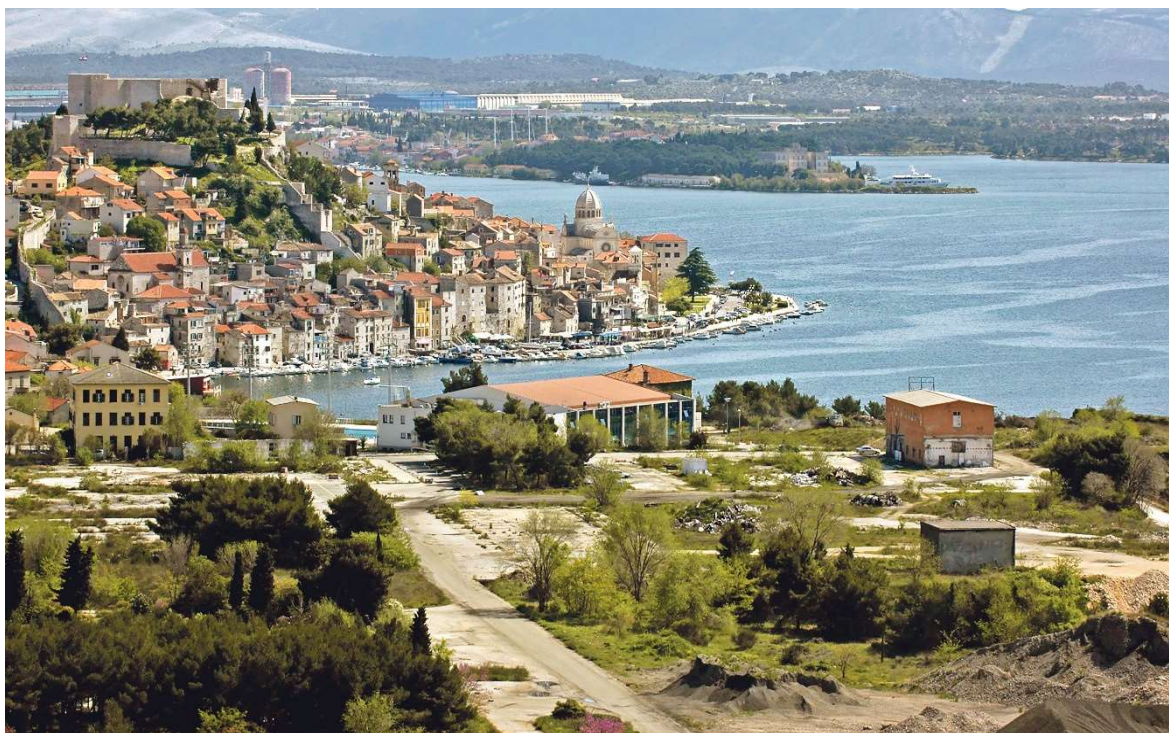
Slika 8-1. Blizina bivše tvornice i centra Šibenika

Lokacija Batižele (zemljište bivše tvornice) nalazi se na svega deset minuta hoda od centra Šibenika s kojim je povezana pješačkom stazom uz obalu, što je vidljivo na slici 8-1. Predstavlja važnu ulogu u razvitku i širenju grada Šibenika. Prijedlogom strategije razvoja područje može biti višenamjensko. Predviđena mu je osnovna namjena kao mješovita zona stambenih objekata, sportsko-rekreacijskih objekata, javno-društvenih prostora, tvrtki, ugostiteljskih objekata, prometa te zelenih prostora. Najmanje 10 % ukupnog prostora treba biti namijenjeno zelenim površinama, 30-ak % turističko-hotelijskim objektima, izgradnji pješačkih staza i izgradnji plaže u nastavku na plažu Banj (ARUP, 2020a, 2020b i 2020c).