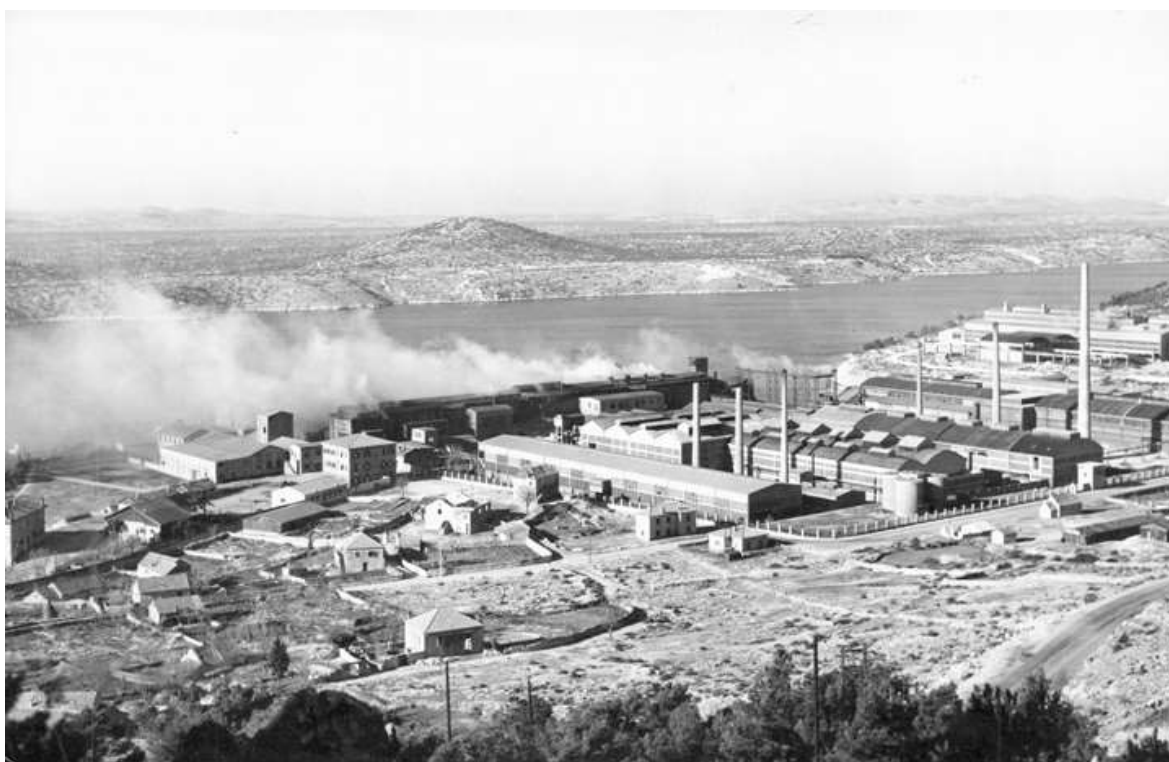
Slika 1-1. Tvornica elektroda i ferolegura

Odluku o zatvaranju Tvornice elektroda i ferolegura donijela je Vlada Republike Hrvatske. HEP d.d. bio je zadužen od strane Vlade Republike Hrvatske za provođenje programa zatvaranja koji se u prvoj fazi isključivo bavio zbrinjavanjem radnika. Grad Šibenik nakon prve faze zatvaranja uz Vladu Republike Hrvatske postaje glavni akter u sanaciji zemljišta tvornice i postaje vlasnik TEF-a d.d. i cijelog zemljišta tvornice. Sanacija lokacije započela je 1999. godine i trajala je oko dvije godine, a prvotno je obuhvaćala rušenje svih građevinskih objekata tvornice. Međutim, sanacija osim rušenja objekata nije obuhvaćala i sanaciju zemljišta. Kada je tvornica prestala s radom, prestalo je zagađenje zraka, koje je TEF godinama uzrokovao. Međutim, ekološka sanacija zemljišta na prostoru bivše tvornice na kojem su bili ostatci katrana, feromanganske i silikomanganske troske, grafitnih elektroda, fenolnih ostataka, recikliranih separiranih granulata i drugih potencijalno štetnih ostataka nije u potpunosti provedena. Otpadni ostatci prema stručnim analizama svrstani su u opasni i neopasni otpad. Prema podacima iz dokumenta pod nazivom „Predinvesticijske studije za poduzeće TEF d.d.“ (2010) iskop površinskog sloja materijala je obavljen te preostaje zbrinjavanje opasnog i neopasnog otpada sa prostora bivše tvornice (Poljičak, 2014).