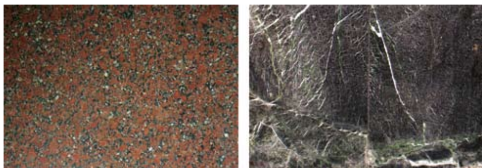
Sl. 2. Varijetet crvenog granita (lijevo) i serpentinit (desno)

Dijabaz koji se koristi kao arhitektonsko-građevni kamen tamnosive je do tamnozeleno boje, a ponekad je gotovo crn. Serpentin (sl. 2, desno) ukrasni je kamen zelene boje u različitim tonovima, što ovisi o količini željeza. Veća količina željeza daje serpentinu tamniju boju koja je mjestimice posve crna.