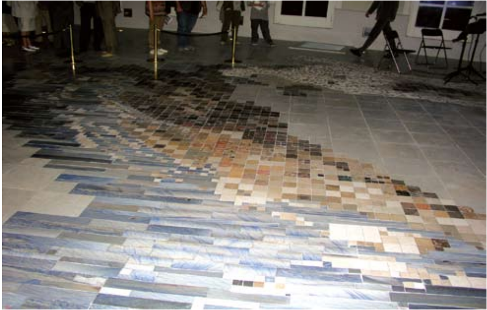
Sl. 3. Kamenospisna geološka karta Hrvatske

Pigment i boja metamornih stijena potječu iz magmatskih i sedimentnih, koje su prethodno bile podvrgnute metamorfozi. Nijanse obojenja pojedinih varijeteta gnajsa i škrljevca nalik su boji magmatskih stijena iz kojih su nastale. Sadrže iste, nepromijenjene i relativno postojane pigmente. Sedimentne stijene pri metamorfozi pretrpjet će znatne promjene boje. Obojeni vapnenac uslijed sadržaja fino raspršenog limonita, dat će bijeli mramor s nekoliko raspršenih zrnaca hematita te ponekad magnetita, ovisno o promjeni oksidacijskih uvjeta. Organska tvar tamnosivih i crnih vapnenaca metamorfizirat će u koncentrirane i izdužene crne nijanse grafita unutar bijelog mramora.