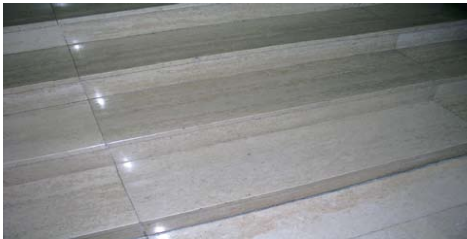
Sl. 4. Istarski onkolitni vapnenac Kanfancar

Kao primjer možemo navesti varijetet istarskog onkolitnog vapnenca, koji na tržište dolazi pod komercijalnim imenom Kanfancar ili Giallo d'Istria ( istarski žuti ). U njegovoj se strukturi ističu brojni tamniji žućkastosmečkasto nijansirani onkoidi (sl. 4) uloženi u mikritsko vezivo.