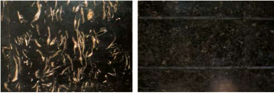
Sl. 5. Crni litiotis vapnenac s ostacima školjke Lithiotis problematica (lijevo) i brački vapnenac rasotica (desno) ugrađen na unutrašnju vertikalnu površinu

i crne boje, ovisno o udjelu organske tvari, fosilnog kršja te udjela i odnosa ferio i feriona željeza. Vapnenci mogu biti i zelenkasti uslijed primjesa glaukonita.