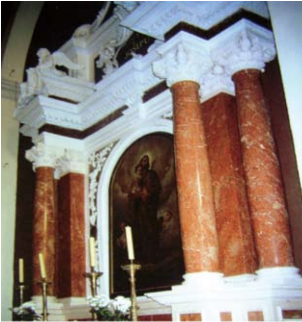
Sl. 7. Varijeteti prirodnog kamena Rosso Dalmatia i Veselje unito ugrađeni u oltar sv. Josipa u crkvi Gospe Sinjske

Kao primjer lijepo obojenog i na tržištu traženog i izrazito visoko dekorativnog vapnenca možemo istaknuti kamen Rosso Dalmatia . Kataklažirani i stilolitizirani foraminiferski vapnenac izgrađen je od gustih i jedrih fragmenata pastelno žućkastocrvenkaste do crvenkaste boje. Porijeklo boje najvjerojatnije možemo pripisati limonitu i hematitu. Detaljna istraživanja nisu provedena. U crvenkastoj osnovi pojedinih skeleta nalaze se skeleti sitnijih i krupnijih foraminifera. Petrografski je određen kao kataklažirani i stilolitizirani foraminiferski vapnenci brečolikog izgleda sastavljeni od fragmenata u rasponu od biomikrita do biosparita. Kontakte na rubovima fragmenata obilježavaju brojni obojeni crvenkasti stiloliti. Sporadično su „otvoreni“ i oštećeni u obliku spleta mikropukotina, kao posljedica naprezanja među fragmentima. Rosso Dalmatia s bijelim bračkim vapnencem Veselje unito pruža odličnu kombinaciju kao što se vidi na slici 7 na kojoj je prikazana unutrašnjost crkve Gospe Sinjske.