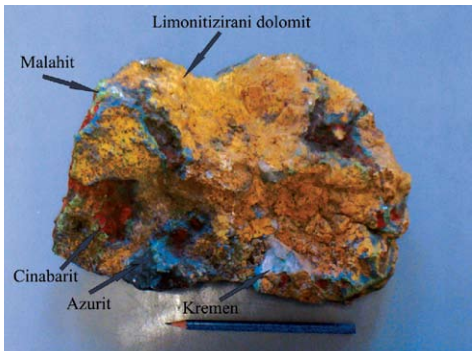
Sl. 1. Uzorak iz Kreševa čuvan u zbirci Zavoda za mineralogiju, petrologiju i mineralne sirovine, RGNF-a u Zagrebu

Elementi kao titan, vanadij, krom, željezo, mangan, kobalt, nikal ili bakar mogu obojiti mineral kada su njegov sastavni dio, odnosno dio kemizma minerala, ili kao primjese prisutne tek u tragovima. Određeni elementi koji uzrokuju pojedine boje u idiokromatskim mineralima, uzrokuju iste boje i u alokromatskim mineralima. Posebno treba naglasiti da isti element može prouzročiti drukčije boje u različitim mineralima uslijed različitog intenziteta zahvaćenosti oksidacijom tog elementa. Malahit i azurit sadrže bakar kao sastavni element u građi svoje kristalne rešetke. Pritom bakar boji malahit u zeleno, a azurit u modro (sl. 1). Željezo također kao najjači i najčešći kromofor boji minerale i stijene u ovisnosti o stupnju oksidacije u kojem se nalazi. Željezni oksid hematit pritom je crvene, a željezni sulfid pirit žute boje.