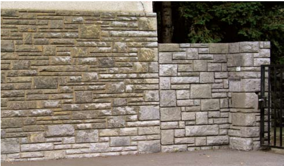
Sl. 6. Lipovečki vapnenac zahvaćen oksidacijom

Dok su žuta i crvena obojenja vapnenaca postojana, siva i posebno crna obojenja su nepostojana. Sivi i crni vapnenci su ponajviše obojeni ujednačenim ili promjenljivim udjelom raspršene organske tvari. Pod djelovanjem atmosferilija oksidiraju i izblijede, gube svježinu, postaju svijetlosivi, puni svijetlih mrlja. Takvi varijeteti kamena nisu pogodni za ugradnju na vanjskim površinama. Njihova dekorativnost dolazi do punog izražaja prilikom oblaganja unutrašnjih površina. Izrazito dekorativni crni litiotis vapnenac s ostacima školjke Lithiotis problematica (sl. 5 lijevo) i tamnosivi do crni lipovečki vapnenac (sl. 6) pogodni su za unutarnja oblaganja. Cjelokupna masa lipovečkog i litiotis vapnenca, impregnirana je finom bituminoznom organskom tvari. Osjetljivi su na utjecaj egzogenih čimbenika. Prirodna tamnosiva boja lipovečkog vapnenca, sporadično crna i plavkasta na vertikalnim vanjskim površinama, ovisno izloženosti atmosferilijama,