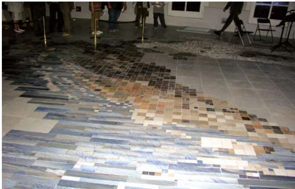
Sl. 3. Kamenospisna geološka karta Hrvatske

Pigment i boja metamornih stijena potječu iz magmatskih i sedimentnih, koje su prethodno bile podvrgnute metamorfozi. Nijanse obojenja pojedinih varijeteta gnajsa i škriljevca nalik su boji magmatskih stijena iz kojih su nastale. Sadrže iste, nepromijenjene i relativno postojane pigmente. Sedimentne stijene pri metamorfozi pretrpjet će znatne promjene boje. Obojeni vapnenac uslijed sadržaja fino raspršenog limonita, dat će bijeli mramor s nekoliko raspršenih zrnaca hematita te ponekad magnetita, ovisno o promjeni oksidacijskih uvjeta. Organska tvar tamnosivih i crnih vapnenaca metamorfizirat će u koncentrirane i izdužene crne nijanse grafita unutar bijelog mramora.