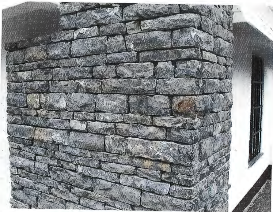
Sl. 4. - Betonski stup obložen Lipovečkim kamenom . Reške bez vidljivog morta (izradio klesar iz Dalmacije)