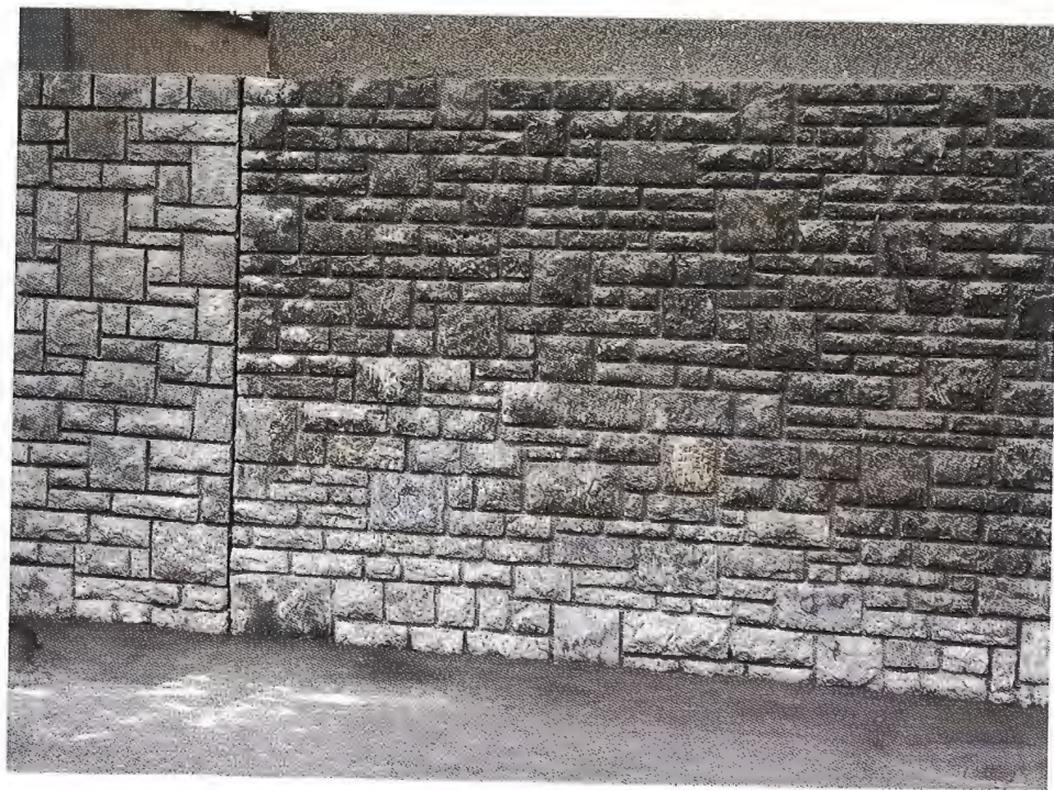
Sl. 5 - Pogled na dio ogradnog zida i fasade obložene Lipovečkim kamenom na obiteljskoj kući (Zagreb)