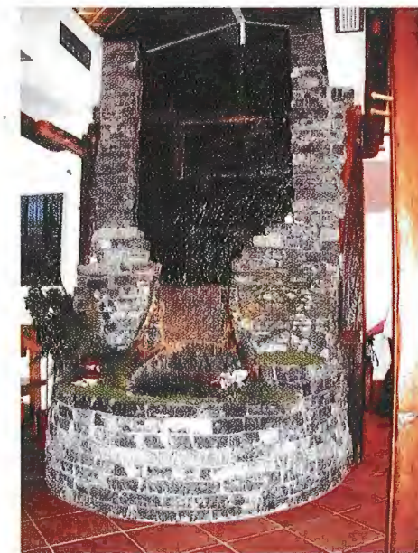
Sl. 6 Slastičarnica u Zagrebu. Lipovečki kamen ugrađen u fontanu i slap preko kojega se prelijeva voda a vegetacija cijelom objektu daje posebnu draž

Kamen je tržištu zanimljiv zbog lagane obrade i ugradnje. Ovim se kamenom relativno lako zida. Manja atraktivnost s obzirom na boju može se poboljšati ukoliko se sporadične žučkastosmeđe slojne površine (rezultat limonitizacije) orijentiraju u zidu ili ogradi tako da budu vidljive ( face bedded ) kao što to prikazuje slika 5. Posebno je atraktivan prilikom primjene u interijerima. Na slici 6 (slastičarnica u Zagrebu) prikazan je primjer kamene fontane i slapa preko kojega se prelijeva voda a vegetacija cijelom objektu daje posebnu draž. Kamen se u kamenolomu razvrstava po debljinama. Prilikom ugradnje omogućuje različiti strukturni izraz. Udio ploča po debljini je sljedeći: učešće kamena debljine 2-3 cm je 6 %; debljine 3-5 cm-12 %; debljine 5-7 cm-15 %; debljine 7-10 cm -17 %; debljine 10-13 cm-19 %; debljine 13-17 cm-21 % i učešće debljine kamena preko 17 cm je 10 %.