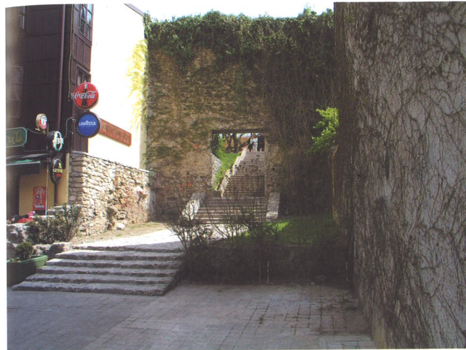
Prolaz prema parku Opatovina (litotamnijski vapnenac i mramorizirani vapnenac s kojima je obavljena obnova dijela konstrukcije bedema i prolaza)

Povijesno najstariji dio Tkalče čini visoki i debeli kaptolski kameni zid prema Potoku (današnja Tkalčičeva). Bio je to nekoć zapadni obrambeni zid Kaptola. Danas se on najbolje može vidjeti na mjestu gdje se iz Tkalče stepenicama stiže u park Opatovina. Tu je također upotrebljen litotamnijski vapnenac iz