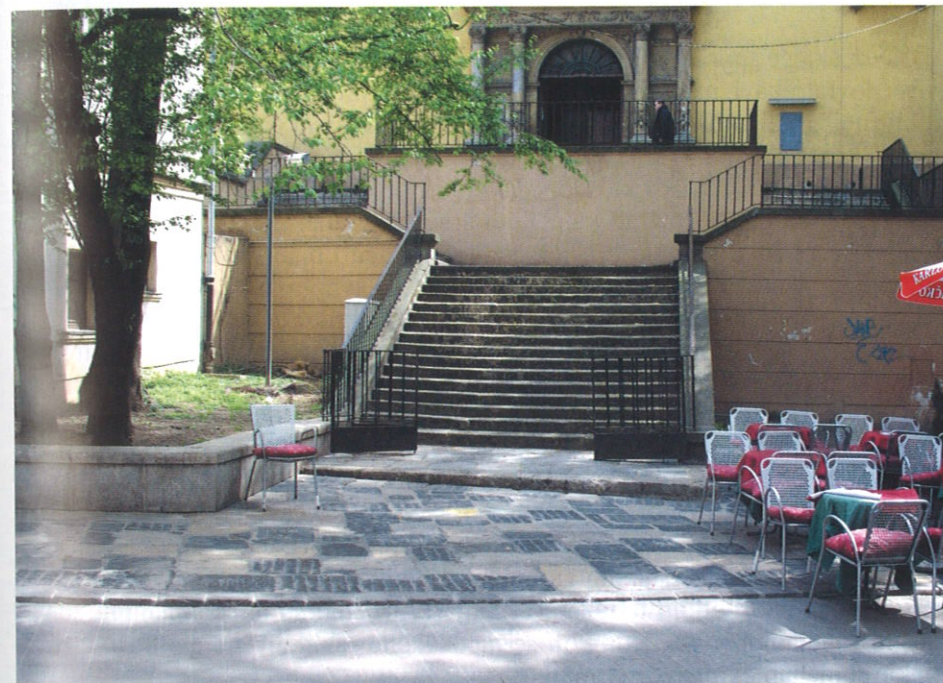
Prilaz crkvi Sv. Marije. Za pješačko kolničku konstrukciju je upotrebljen trahit-trahiandezit (novo), za pješačku stazu lipovečki kamen, ograda je izrađena od sivog granita, stube dijelom od litotamnijskog vapnenca a dijelom od lipovečkog, dok je portal izrađen od litotamnijskih i pjeskuljavih vapnenaca.

U novi dio pješačko-kolničke konstrukcije ugrađen je prirodni kamen vulkanskog podrijetla, trahit-trahiandezit s lokaliteta Colli Euganei u blizini Padove u susjednoj Italiji. Odabran je tip konstrukcije od nestandardnih kamenih