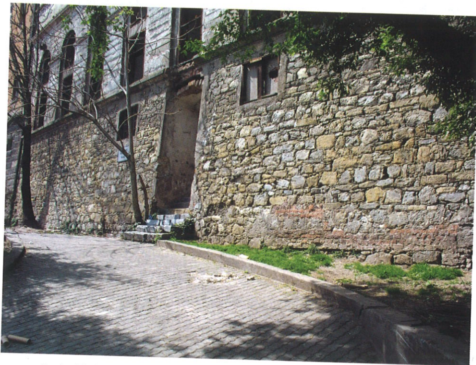
Prolaz Tkalčićeva-Kožarska, litotamnijski vapnenci u gornjogradskim bedemima

spomeničke cjeline. No bez obzira na sve ova ulica pri obnovi zaslužuje posebnu pozornost. Za sada su sporadično obnovljene pojedine fasade, a samo je poneka zgrada temeljito obnovljena i rekonstruirana. Mnoge su zgrade i fasade u vrlo lošem stanju, oronule, doslovce ruševine. Skrivene su od očiju tankim naličom koji nas tek trenutno uspjeva zadovoljiti. Gotovo svaki posjetilac koji prvi puta kroči u staru Tkalčićevu ulicu zaželi i nametne mu se misao neophodnosti njene obnove.