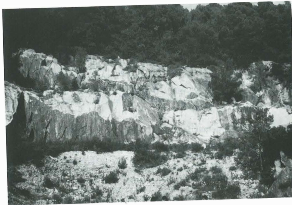
Kamenolom Mala Burina