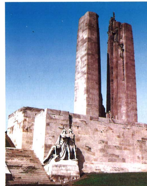
Spomenik palim Kanadanima u Vimyu

Autor je spomenuo da je tih dana iz jednoga od kamenoloma izvađen ogroman bijeli blok kamena iz kojeg je Ivan Meštrović želio izraditi križ za obiteljsku grobnicu u svojem rodnom mjestu. U drugom kamenolomu poviše prvog radila je tada tvrtka "H.T. Jankins et. Son Ltd" iz Torquila u Engleskoj, sa zadaćom da