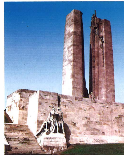
Spomenik palim Kanadanima u Vimyu

Autor je spomenuo da je tih dana iz jednoga od kamenoloma izvađen ogroman bijeli blok kamena iz kojeg je Ivan Meštrović želio izraditi križ za obiteljsku grobnicu u svojem rodnom mjestu. U drugom kamenolomu poviše prvog radila je tada tvrtka "H.T. Jankins et. Son Ltd" iz Torquila u Engleskoj, sa zadaćom da