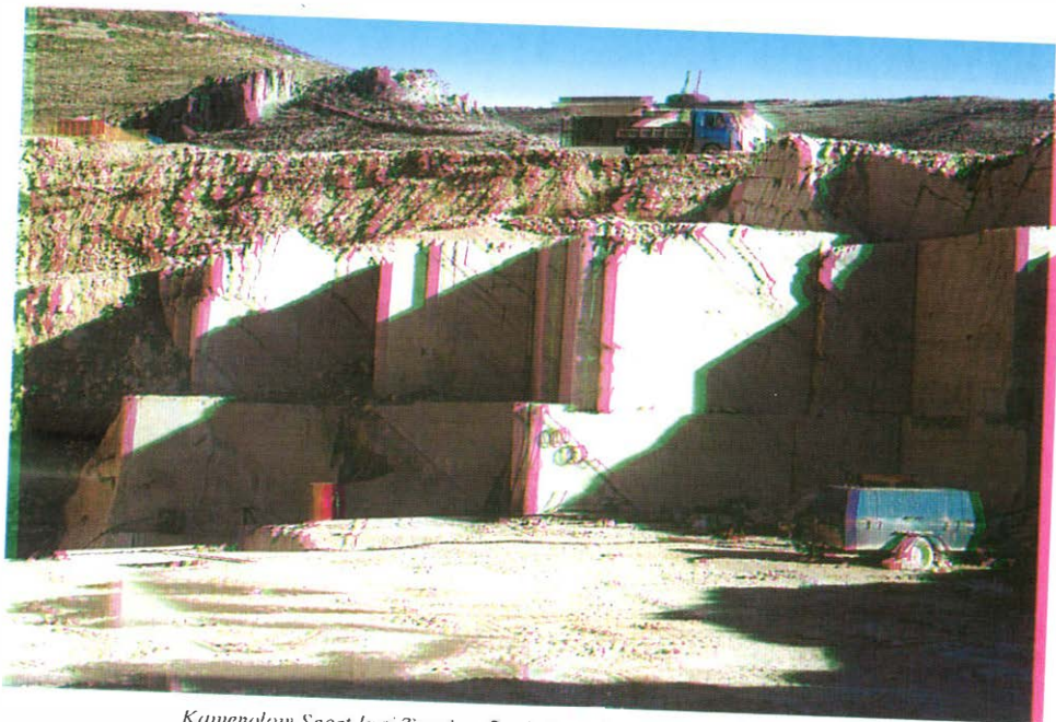
Kamenolom Seget kraj Trogira. Pogled na sjeverni dio otkopne fronte. Lijevo dolje izvodi se dubinska etaža.

i usporedila uzorke iz Vimya s onima iz kamenoloma. Izradili su brojne skice o strukturnim značajkama kamenoloma te izmjerili dimenzije otkopanog prostora (sl. 1).