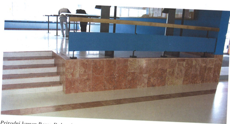
Prirodni kamen Rosso Dalmatia ugrađen na fakultetu Strojstva i brodogradnje u Zagrebu ( boridura , gazište stuba i sokl izradeni od prirodnog kamena Rosso Dalmatia , ostalo je kamen Veselje unito )

Danas su zbog sporadičnih defekata, najčešće u obliku pukotina i prslina, brojni kamenolomi malih blokova i tombolona prirodnog kamena izvan eksploatacije. U njima bi se ponovno mogli pridobivati varijeteti vrlo dekorativnog kamena, dobrih fizikalnih i mehaničkih svojstava. Neki od njih upotpunili bi današnje i buduće potrebe za kamenom u Hrvatskoj a i šire. Posebno su važni zbog primjene u interijerima.