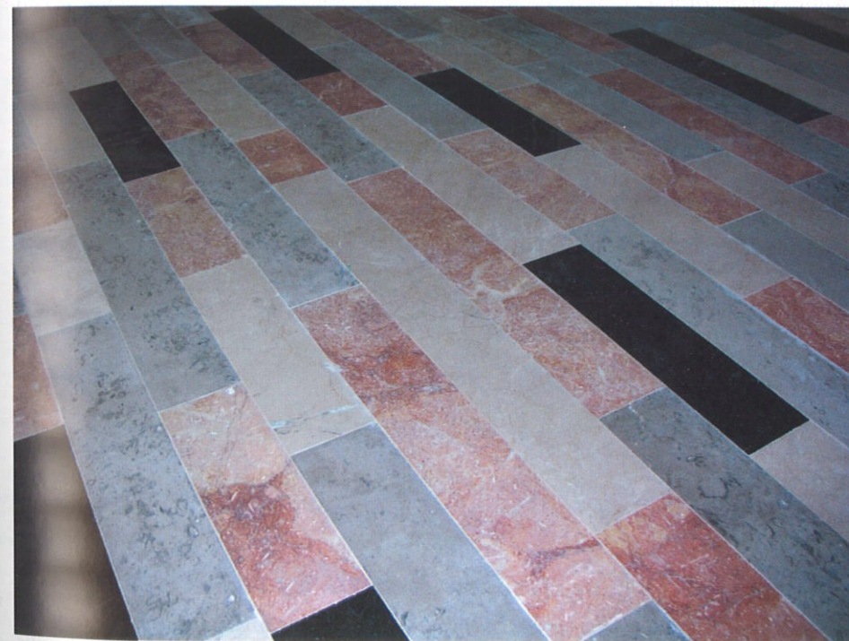
Prirodni kamen Rosso Dalmatia ugrađen u mozaik u Vojnom ordinarijatu u Zagrebu

Dosadašnji rezultati upoznavanja značajki kamena Rosso Dalmatia , stečeni tijekom istražnih radova i probne eksploatacije, piljenja i ugradnje kamena, ukazuju na visoko dekorativni varijetet koji zbog izrazito crvenkaste boje i strukturnih značajki pobuđuje sve veći interes.