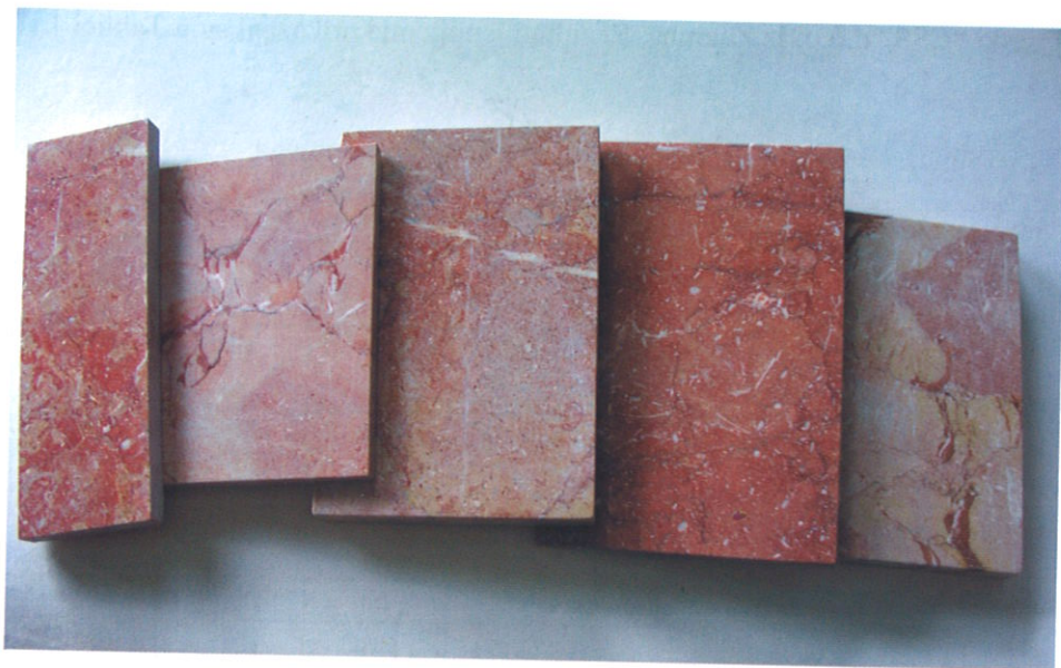
Obradene ploče i varijeteti prirodnog kamena Rosso Dalmatia

Kao najveći nedostatak ovog kamena može se istaknuti njegova sporadična mikroraspucanost, posebice duž stilolita odnosno na rubovima fragmenata koji su oštećeni uslijed kataklaziranja. Zbog toga mu je ograničena primjena. Pogodan je za ugradnju u zatvorenim prostorima. U nekim bi se slučajevima mogao primjenjivati i na vanjskim vertikalnim površinama. Mikroraspucanost zahtijeva obradu kojom bi ovaj varijetet kamena mogao biti uzdignut do najviše razine primjene.