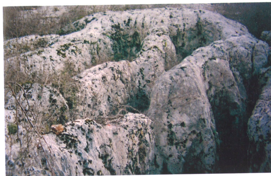
Pogled na šire područje kamenoloma Čvrljevo

Ležište prirodnog kamena Čvrljevo kraj Unešića udaljeno je 25 km od Drniša u smjeru jugozapada. Do njega se stiže iz pravca Splita preko Dugobaba ili iz pravca Unešića. Uže i šire područje ležišta izgrađuju slabo uslojeni kataklazirani i stilolitizirani foraminiferski vapnenci brečolikog izgleda. Ove se naslage, starosti donji-srednji eocen prostiru kao izdužena zona podudarno s dinarskim pružanjem. Nagnute su prema SSI pod kutem 10°. Debljine su preko 10 m. Ispresijecane su tektonskim zonama pružanja ZSZ-IJI i SSI-JJZ. Tektonske zone odjeljuju stijensku masu u velike blokove-monolite površine do 10 x 25 m. Razlomljene tektonske zone sporadično su zapunjene zemljom crvenicom. Koriste se pri eksploataciji kao prirodni "pašarini". Njihovim otkopom omogućuje se bolji pristup "zdravoj" stijenskoj masi. Manji broj pukotina koje presijecaju blokove-monolite ima približno isto pružanje kao i spomenute tektonske zone.