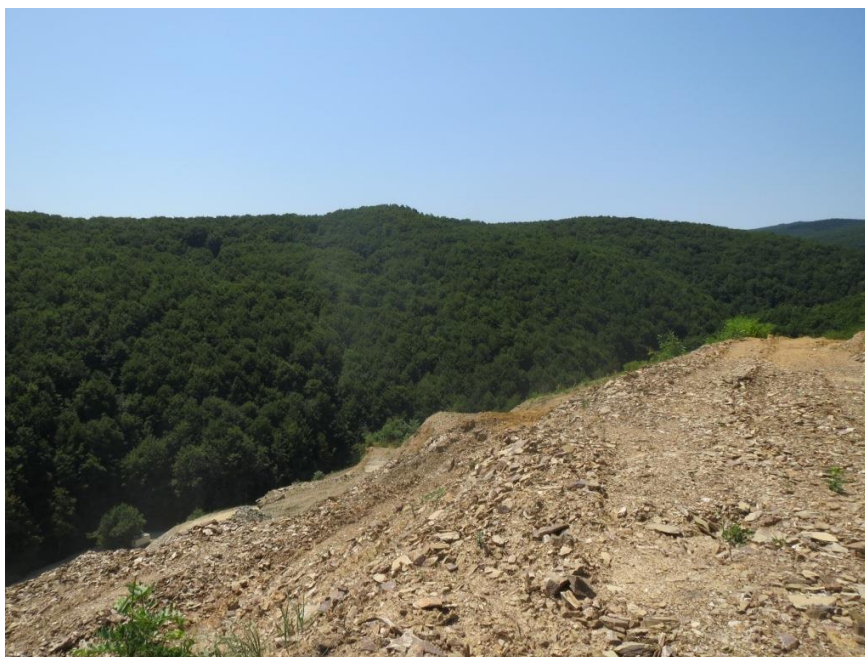
Slika 5-1. Šuma na širem području zahvata (Vrkljan, 2015)

Do visine od 350 m najviše su zastupljene šume hrasta kitnjaka i graba. Iznad toga, pa sve do 700 m prevladavaju bukove šume, koje rastu u nekoliko različitih šumskih zajednica, dok se iznad bukove šume nalazi panonska šuma bukve i jele. Najzastupljenije vrste drveća su bukva (47%), hrast kitnjak (34%), jela (6%) i grab (5%).