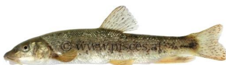
Slika 5-4. Potočna mrena

Potočna mrena (Slika 5-4) i peš su ribe koje se nalaze na području ekološke mreže HR2000580 te predstavljaju cilj očuvanja iste, kao i žuti mukač (žaba) od vodozemaca na slici 5-5.,