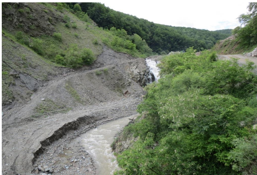
Slika 5-2. Potok Žervanjska (Vrkljan, 2015)

Semimetamorfite Radlovačke serije i mineralnu sirovinu dijabaza karakterizira pukotinska i rjeđe međuzrnska poroznost. U površinskom dijelu su raspucani, čime omogućavaju infiltraciju vode u podzemlje. Prodiranje vode u podzemlje nije duboko, tako da se te stijene smatraju barijerom kretanju dubljih podzemnih voda. Na području eksploatacijskog polja „Žervanjska“ nisu zapaženi izvori.