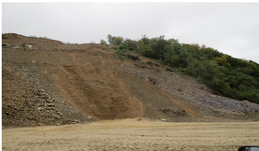
Slika 2-2. Otkopno polje „Žervanjska nova“

Razvijene su svega 3 etaže različitih visina prikazanih u tablici 2-2.