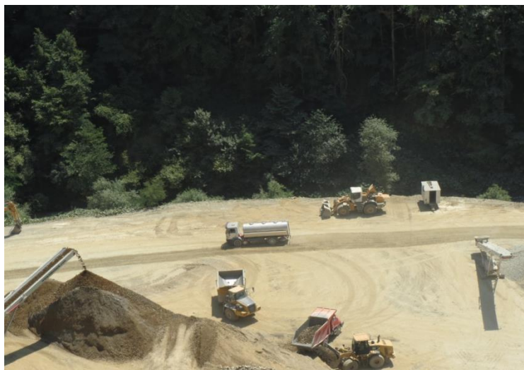
Slika 3-1. Utovar mineralne sirovine (Vrkljan, 2015)

Utovar i transport izvan eksploatacijskog polja (Slika 3-1) podrazumijeva utovar i transport klasiranih poluproizvoda od pokretnog postrojenja za klasiranje i poluproizvoda nakon primarnog drobljenja na pokretnom postrojenju van granica eksploatacijskog polja "Žervanjska". Poluproizvod se usipava u usipni bunker stacioniranog separacijskog postrojenja na području eksploatacijskog polja "Brenzberg-Točak". Prosječna udaljenost transporta iznosi otprilike 4,0 km, ovisno o lokaciji eksploatacije unutar eksploatacijskog polja "Žervanjska". Utovar se izvodi bagerima gusjeničarima i utovarivačima dok se materijal do stacioniranog separacijskog postrojenja prevozi damperima.