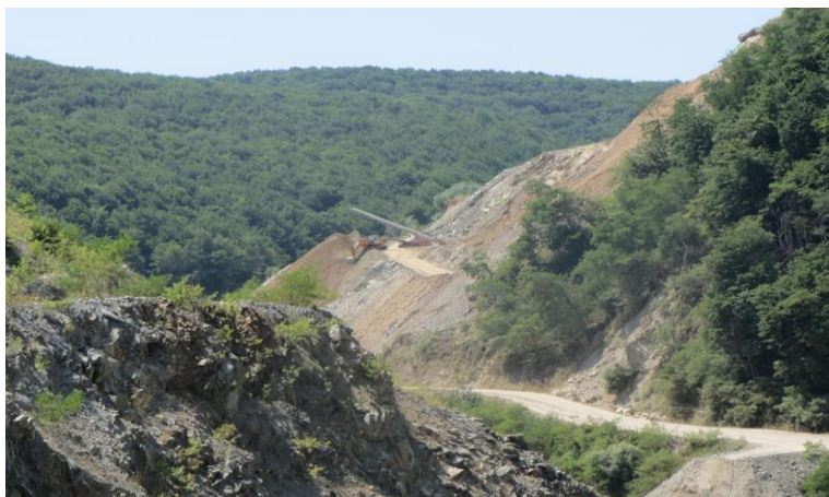
Slika 2-1. Otkopno polje „Žervanjska stara“

Otkopno polje „Žervanjska stara“ (Slika 2-1) nalazi se na istočnom dijelu eksploatacijskog polja „Žervanjska“ na desnoj, južnoj obali potoka Žervanjska. Osnovni plato, koji je na istočnom dijelu povezan na prometnicu nalazi se na koti + 443 m uz postepeno podizanje do + 460 m u smjeru jugozapada. Osnovni plato relativno je uzak, izdužen do širine od 30 m.