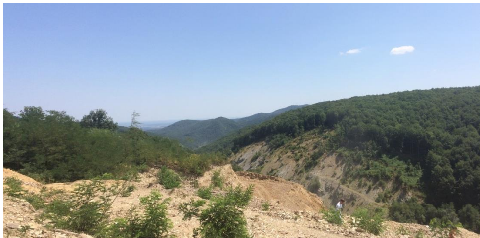
Slika 5-3. Panorama šireg područja s vrha otkopnog polja „Žervanjska nova“

Prirodni krajobraz šireg područja zahvata (Slika 5-3) okarakteriziran je prepoznatljivom reljefnom plastikom gorja koja se uzdižu nad nizinom. Gorja su u potpunosti obrasla šumskom vegetacijom, dok se u nizinskom predjelu izmjenjuju mozaične površine naselja, poljoprivrednih površina sa doprirodnim elementima šuma i vodotokova.