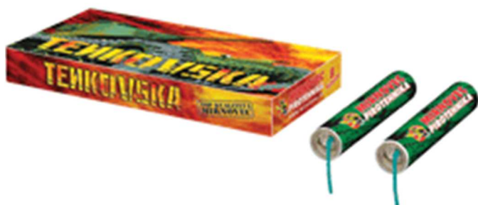
Slika 3-2. Pirotehničko sredstvo razreda II – petarda Tenkovska (;Mirnovec, 2015).

Na slici 3-2. prikazano je pirotehničko sredstvo razreda II– petarda komercijalnog naziva Zolja.