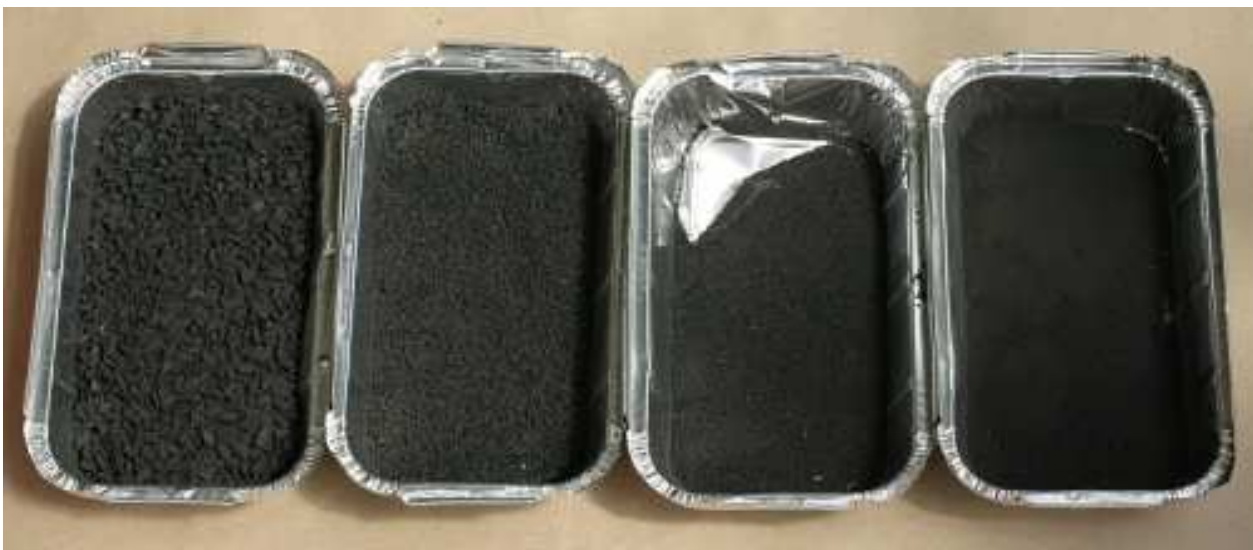
Slika 4-5. Barut različitih granulacija

Na slici 4-5. je prikazan barut raznih granulacija.