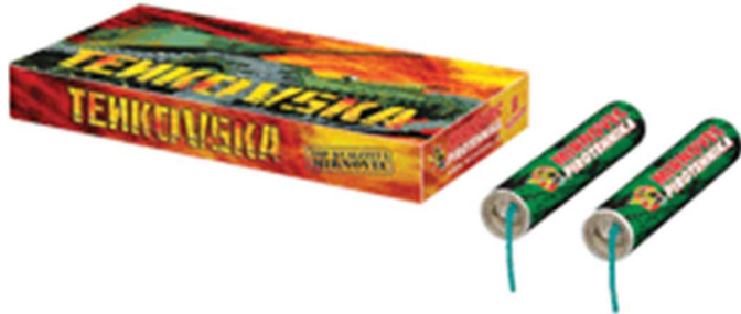
Slika 3-2. Pirotehničko sredstvo razreda II – petarda Tenkovska (;Mirnovec, 2015).

Na slici 3-2. prikazano je pirotehničko sredstvo razreda II– petarda komercijalnog naziva Zolja.