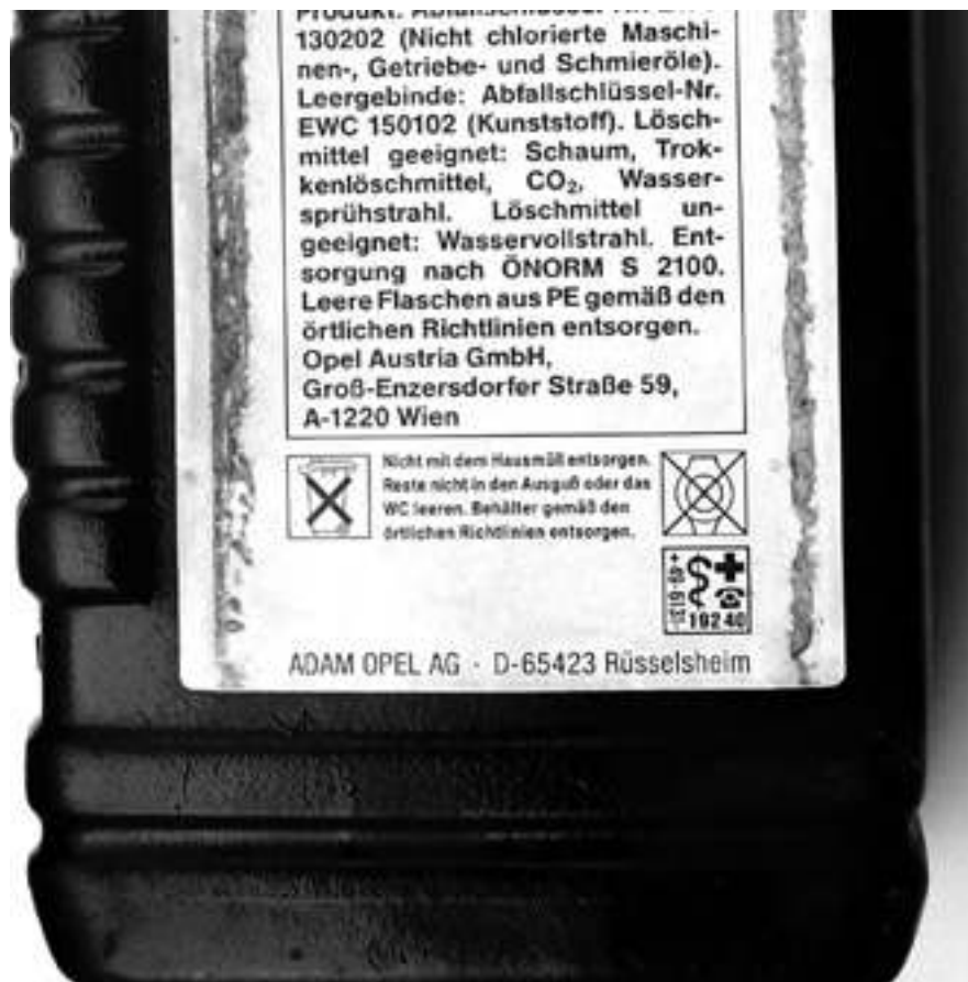
Slika 2-4 Ambalažni otpad – još jedan primjer upozoravajućih piktograma na kantici motornog ulja u Njemačkoj ( http://lerotic.de/opasni/index.htm )

Slika 2-4 pokazuje još jedan primjer upozoravajućih piktograma na kantici motornog ulja u Njemačkoj.