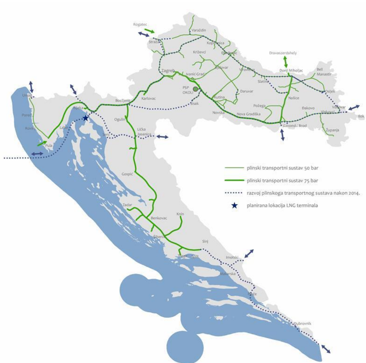
Slika 2-2. Plinski transportni sustav u Republici Hrvatskoj (Plinacro, 2017.)

Kako bi hrvatsko plinsko tržište bilo integrirano s europskim tržištem plina, zadaća operatera plinskog transportnog sustava jest izgraditi međudržavne spojne plinovode ili po potrebi povećati kapacitete postojećih uzimajući u obzir ekonomski razumne i tehnički izvodive zahtjeve. Pri tome je ključna suradnja i razmjena informacija s institucijama Europske unije čija je obveza praćenje planova razvoja transportnog sustava (Ministarstvo zaštite okoliša i energetike, 2017.).